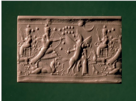
5. ábra. Anzú démont üldöző Ninurta istent ábrázoló pecséthenger lenyomata.

világára lesújtó isteni harag perszonifikációjaként is szerepel Marduk, Istar, Ninurta, Assur és Nergal istenek himnuszaiban. Közülük Marduk és Ninurta alakja kapcsolható a legszorosabban a vízözön megszemélyesítéséhez. 22 A vízözön Ninurta isten fegyvere, esetleg fegyverének epithetonja is egyben, emellett ezen istenségre a vízözön, illetve a tavaszi áradás megjelenéseként tekintettek. 23 A vízözönt keveréklényként is ábrázolták az újasszír kori Ninurta alakjához kapcsolódó ikonográfiában. 24 Az alábbi képen 25 egy újasszír kori pecséthenger lenyomata látható, az ábrázolás bal oldalán az említett keveréklény, illetve az annak hátán álló Ninurta alakja.