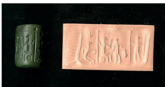
3. ábra. A „babilóniai Noét”, Utnapistimet ábrázoló pecséthenger és lenyomata (BM 89349).

Az előadást követő lelkesedésnek köszönhetően G. Smith a következő évben Irakba utazhatott a töredékes tábla hiányzó darabjának megkeresésére. Smith a Kujundzsik-dombon Ras-sam által megkezdett ásatási területen folytatta a keresést, és néhány nap után egy újabb agyagtáblát talált, amely a vízözön-történet egy másik változatát tartalmazta. 5 A vízözön-tábla megtalálását és kiadását követően a Mezopotámiából származó régészeti leletek iránti érdeklődés jelentősen növekedett Angliában, és e híres tábla mellett egyéb, a korai mezopotámiai ásatásokról előkerült vagy ott vásárolt tárgyakat is összekapcsoltak a vízözön-történettel, köztük több, a British Museumban őrzött pecséthenger-ábrázolást is. Az alábbi ábrán látható zöld jászpisból készült pecséthenger adományként került a British Museum tulajdonába 1880-ban, a tárgyon látható ábrázolást a korabeli múzeumi katalógus a vízözön-történet képi ábrázolásaként értelmezi.