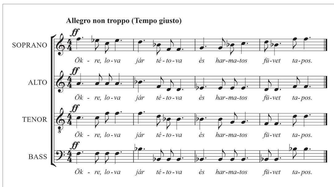
6. kép. Hubay Jenő: Petőfi-Szimfonia — Pásztorok kara