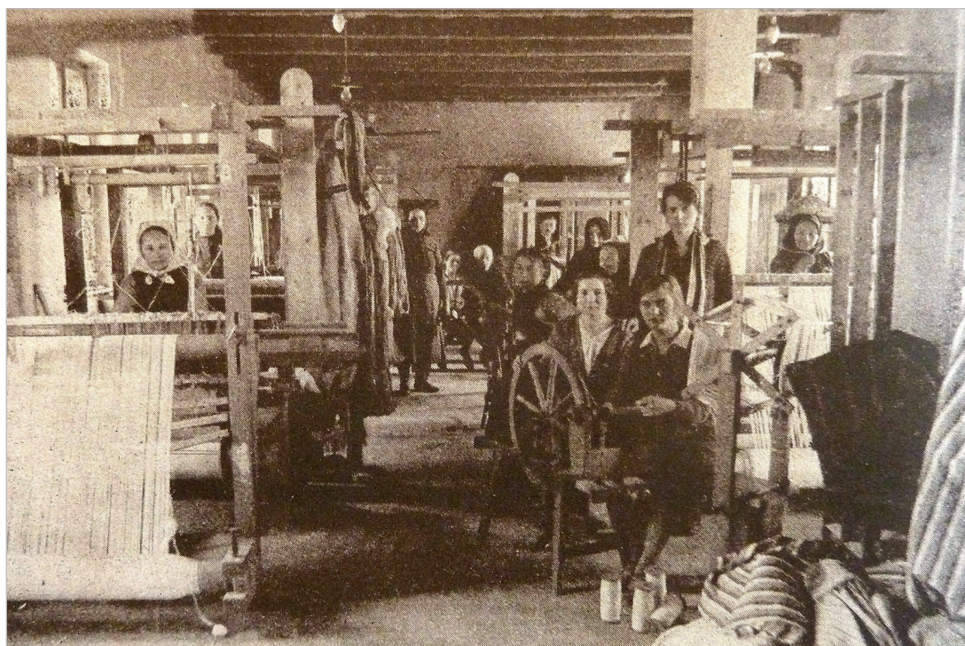
3. kép. A szövőműhely fotója „Egy falu, amelyet az egész világ épít” című brosúrából (FÓT-ÚJFALU 1929: p. 48.)