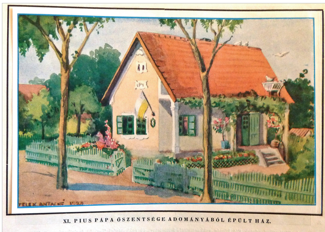
1. kép. „Egy falu, amelyet az egész világ épít” című népszerűsítő kiadvány egyik rajza a XI. Piusz pápa adományából felépült házról. Jól látszik a házon az adományozó zászlója, mivel a telep szabálya szerint minden épületre az adományozó ország zászlóját kötelezően el kellett helyezni. (FÓT-ÚJFALU 1929: 35.)

lakások bérlői a megterhelő lakbérek miatt gyakran idegen al- és ágybérlőkkel kényszerültek megosztani otthonukat. A Suum Cuique-telep mennyiségben ugyan nem vette fel a versenyt az állami lakásépítésekkel, de a kb. 40 m 2 alapterületű, szoba-konyha-kamra elosztású, tornáccal és kerttel rendelkező házak egészségesebb feltételeket biztosítottak az agglomerációs munkáslakásoknál.