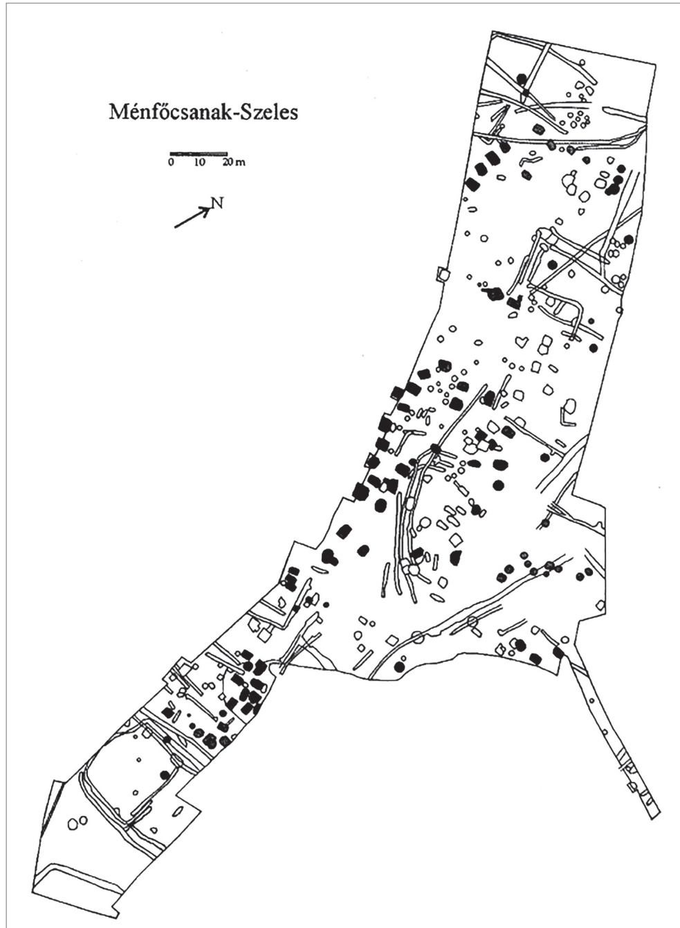
2. ábra. A ménfőcsanak-szeles-dűlői feltárás összesítő alaprajza.

Alább az ilyen estekkel fogunk részletesebben foglalkozni, azonnal kiemelve, hogy a superpozíciók ilyen, első ránézésre bonyolultabb és kaotikusabb típusa az utóbbi évtizedek számos további feltárásán is megfigyelhető volt. 10