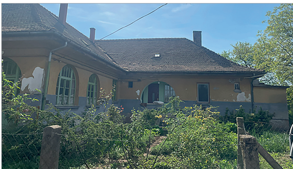
Az egykori székkutasi tanyai iskola épülete

Magyarországon, és Vásárhelykutason (Székkutason) a 19–20. század fordulóján ültették végig vele az útmentét a vasútállomástól a templomig. Minden tanyai iskolában kötelező volt artézi kutat fúratni, hogy legyen a gyerekeknek és a környéknek egészséges ivóvize.