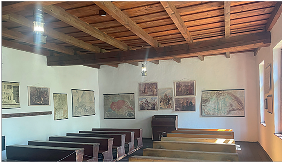
Az Ópusztaszeri Nemzeti Történelmi Emlékpark Szabadtéri Néprajzi Múzeum tanyasi iskolabelsője

holdnyi illetményföld. Ezen termelhetett jószágainak kukoricát vagy éppen eladásra cirkot az orosházi seprűgyárnak. Az 1970-es évektől a sláger a fűszerpaprika volt, amelyet a Szegedi Paprikafeldolgozó vett meg októberben a szedés után.