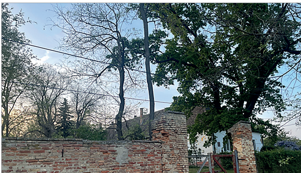
A téglafallal körbevett egykori településközpont Székkutason