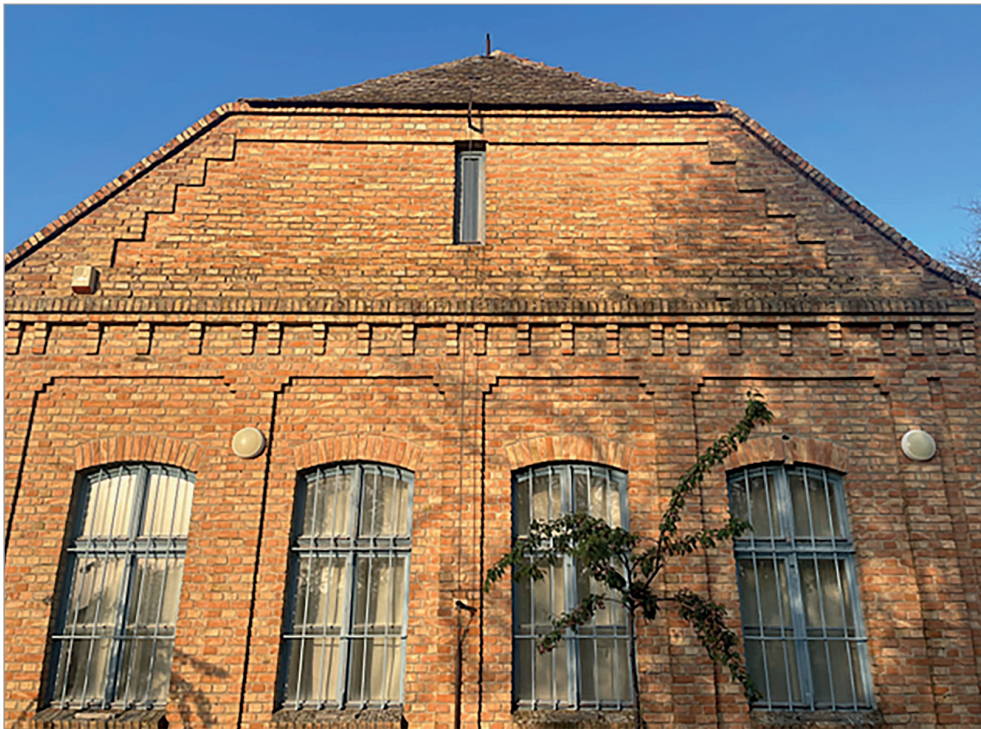
A sósalmi tanyasi iskola épülete

1948-ban felszámolták, mivel az új államhatalom nem tűrte az önszerveződő kulturális intézményeket.