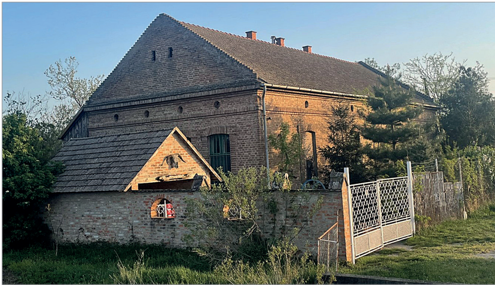
Egykori tanyai iskola Szőkehalmon

ben fekvő Csengelére akarták helyezni, de a mindig intézkedő nagyanyám két kacsáélete árán, amit felpucolva szállított az ügyintézőnőnek, elérte, hogy a Szentesi járásban maradjon.)