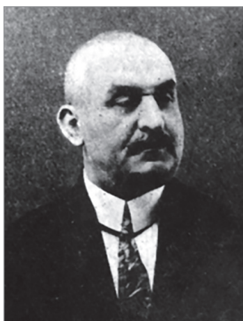
5. kép. Dr. Négyesi Imre polgármester portréja.