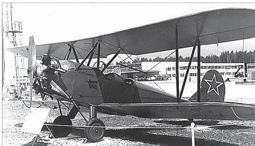
3. kép. Polikarpov 2 repülőgép