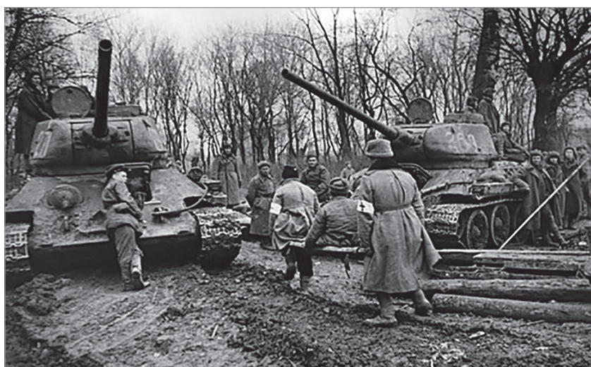
4. kép. T-34-85-ösök és legénységük Magyarországon.