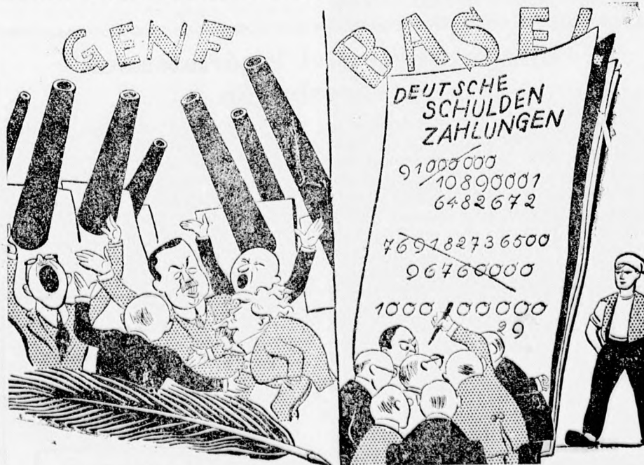
Német karikatúra a genfi leszerelési és a bázeli gazdasági konferenciáról. — Amott a fegyverek, emitt az uzsorás aranyak beszélnek érthetően, — mondja a német.

— Megszűnt a sertéspestis. A Derekegyháza község területén szörvénnyesen fellépett sertéspestis megszűnéséről jelentés érkezett a város-hoz.