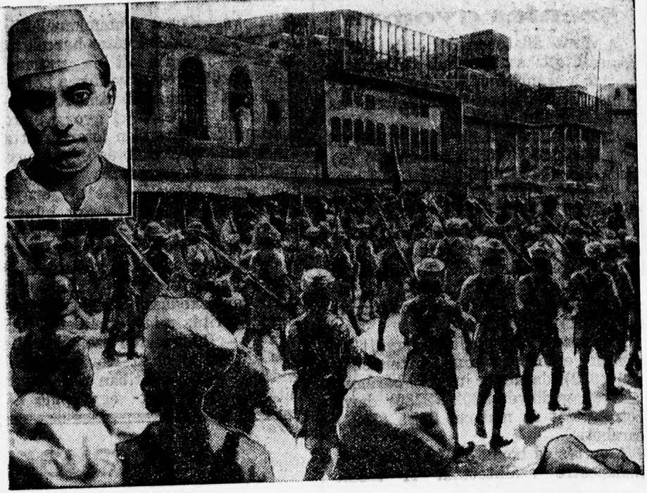
Indiában újabb nemzeti zavargások törtek ki Pandit Javaharlal Nehru vezetésével s valóságos utcai harcok folynak a zavargók és a katonák között

A magyar mezőgazdaság vesztesége tehát két-három év alatt messze felülmúlja a kétmilliárd pengőt. Ebben az elvesztett kétmilliárd pengőben benne van az államháztartás deficitje, a külföldi tartozások nagyrésze, azok kamatszolgáltatása, a magyar föld újabb eladósodása, a hitelkriszisa, a gazdasági élet vérkeringésének teljes megbénulása és mind az a baj, amit ennek a kétmilliárd pengőnek az elmaradása okozott.