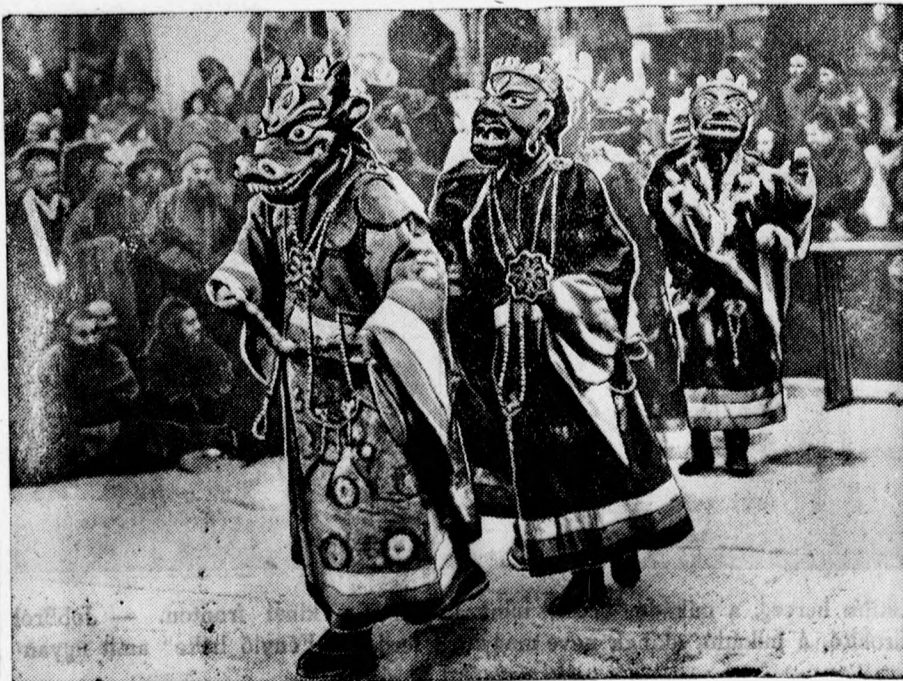
Karneval herceg diszkiséréte felvonul Húshagyókedden