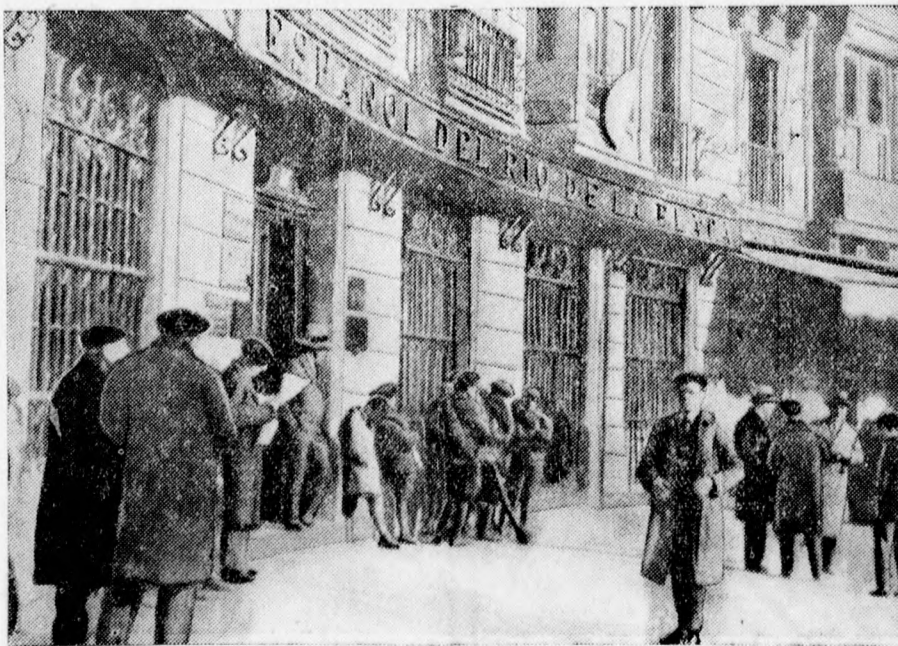
A spanyol Bilbao, ahol véres forradalmi jelenetek voltak