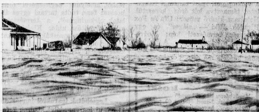
A Missisipi áradása egész falvakat sodort el