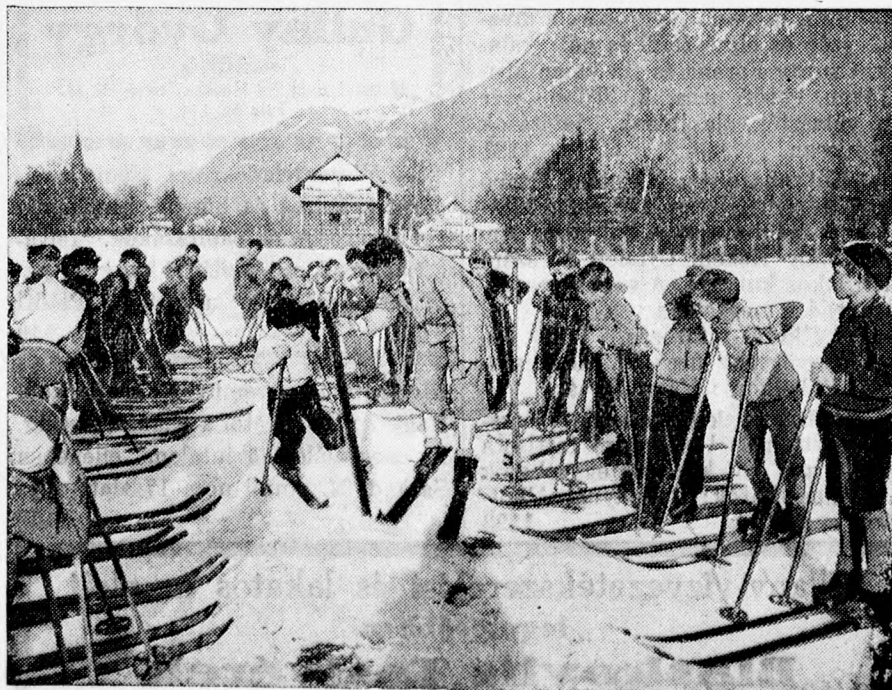
Az egyik legegészségesebb téli sport a sízés. A hegyvidéki gyerekek rendszeresen gyakorolják benne magukat