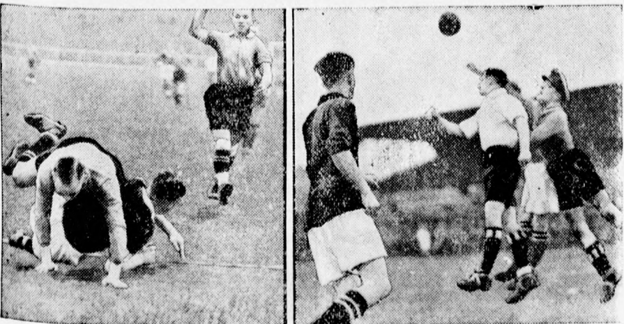
Futballisták tréning közben

A tavaszi szezonhoz a Vasutas is nagyobb reményeket fűz és ha már nem is előzheti meg a csongrádi AK-ot és az SzMTK-át, jó harmadikok szeretnének lenni. Ez is szép teljesítmény lenne a mindössze egy év óta működő egyesülettől.