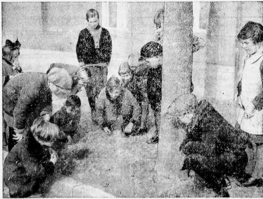
Itt a tavasz!