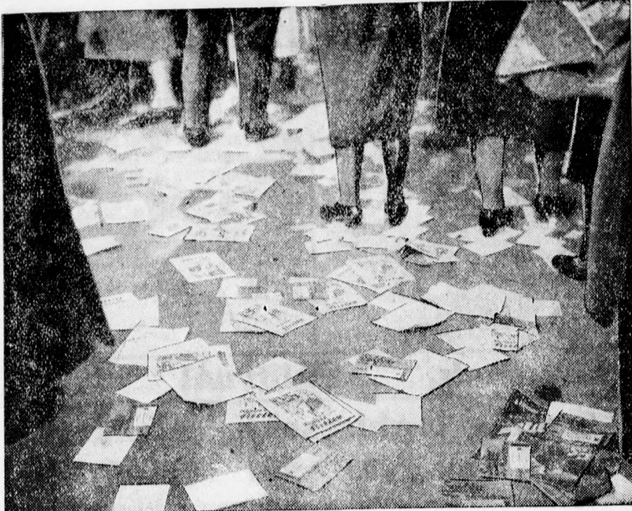
Az elnökválasztás alkalmából a berlini utcák röpcédulákkal és plakátokkal vannak elborítva