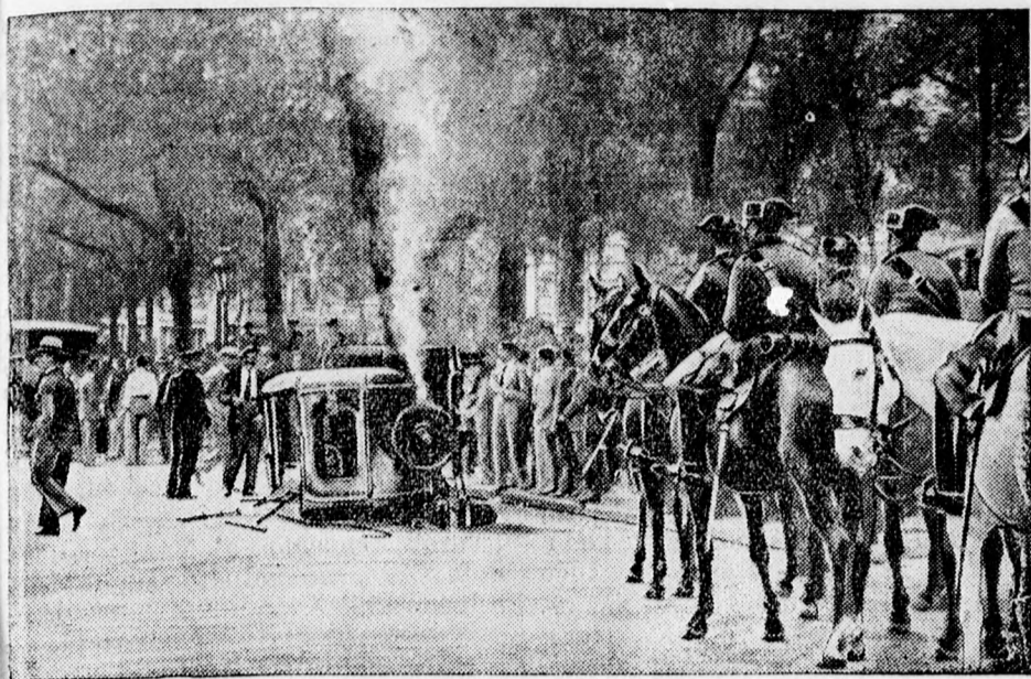
Kép a chilei forradalomból. Egy autót felgyújtottak az utcán