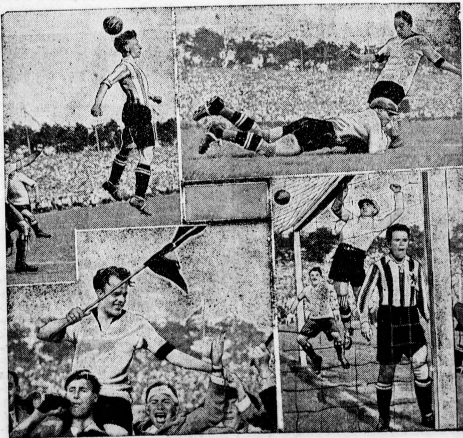
Küzdelem a középeurópai kupáért