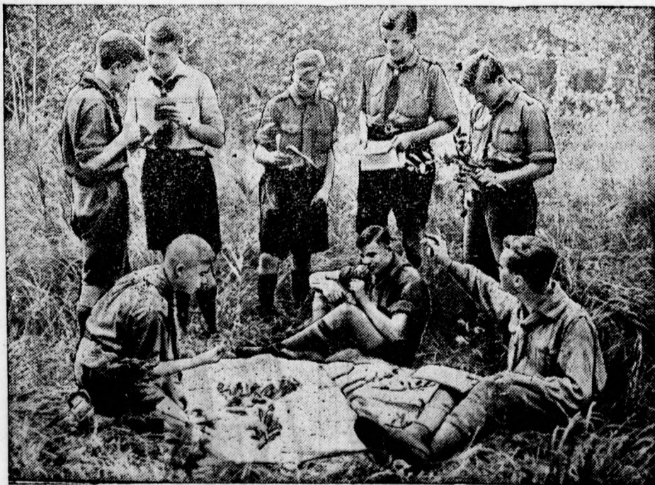
A cserkész táborban