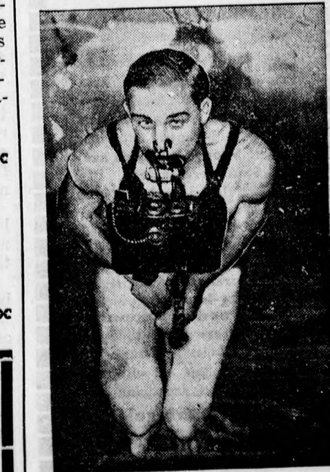
Készülék az elsüllyedt tenger alattjárók legénységének megmentésére