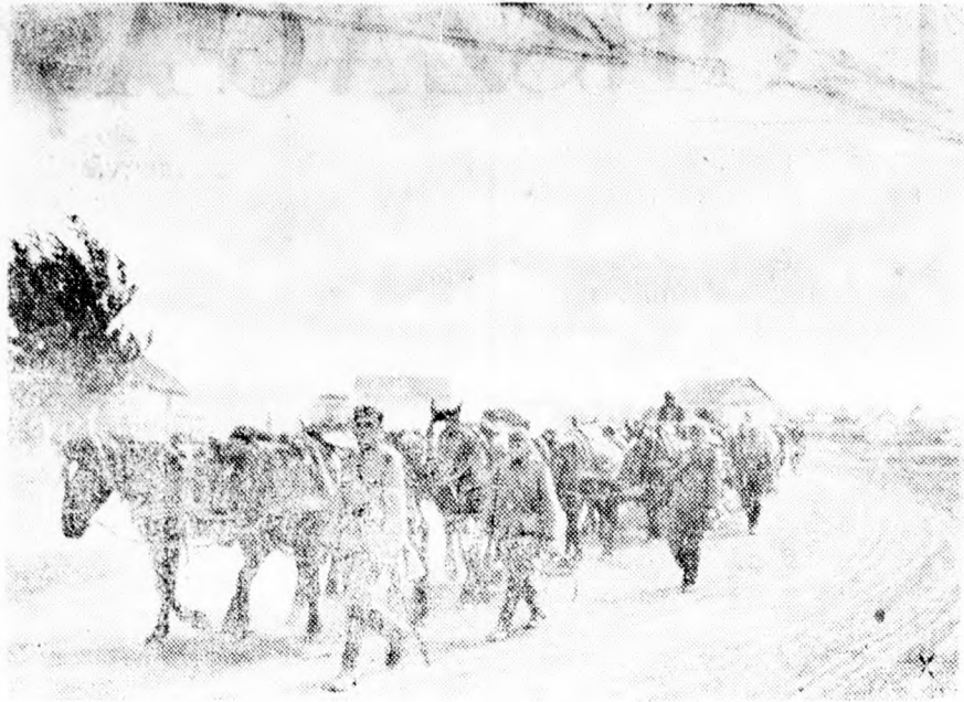
Előretörés a keleti fronton.