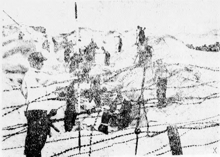
Készül Európa déli védővonala.