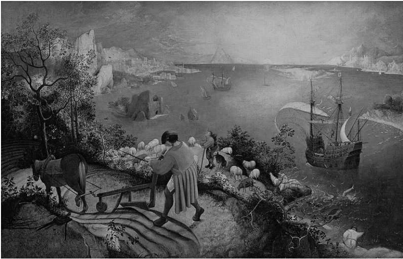
Pieter Bruegel l'Ancien (1526/1530–1569) : La chute d'Icare (1558)

le verbe. Mais alors, et selon le même exercice de transposition toujours, il faudra aussi revoir les rapports entre études culturelles et études littéraires ! J'en tire la conclusion qui s'impose. Je réécris et m'approprie également la phrase de Barthes dans Eléments de sémiologie : « Les cultural studies n'ont eu jusqu'ici qu'à traiter que de problématiques dérisoires, des issues comme on dit dans le monde anglo-saxon ; dès lors que l'on passe à des ensembles doués d'une véritable profondeur sociale, on rencontre de nouveau la littérature ». La littérature est l'alpha et l'oméga de mon histoire. Je n'y puis rien. C'est plus fort que moi. Je ne suis bon qu'à ça , comme disait quelqu'un.