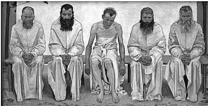
Ferdinand Hodler : Fatigués de la vie

Il serait bien trop ambitieux pour le présent article que de vouloir détailler les différents usages du parallélisme dans l'histoire des arts, nous nous contenterons en guise de préambule à notre investigation de l'usage du parallélisme dans le cinéma de Michael Mann, de mentionner le travail du peintre symboliste de la fin du 20 e siècle et du début du 20 e siècle, Ferdinand Hodler, qui le premier développa un usage systématique de la notion de «parallélisme» dans la création de ses tableaux. Pour Hodler, le parallélisme est la répétition de formes semblables dans un espace commun, ladite répétition devant provoquer, selon lui, une fascination du spectateur pour l'ordre, la symétrie et le rythme des apparitions picturales (voir en guise d'illustrations les œuvres suivantes : Fatigués de la vie , Vision de l'infini , Une, consacrée , ou encore Émotion II ).