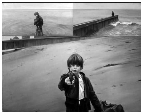
Jacques Monory : Antoine N°6 (1995)

Que ce soit l'océan dans Heat , Le Sixième Sens , Révélation , Miami Vice et Ali , une rivière dans Le Dernier des Mohicans , ou encore le lac Michigan dans Le Solitaire , l'élément aquatique prend formellement la fonction esthétique d'une méditation qui permet toujours aux personnages de réajuster leur présence dans un milieu qui leur échappe constamment. Mais la fonction symbolique