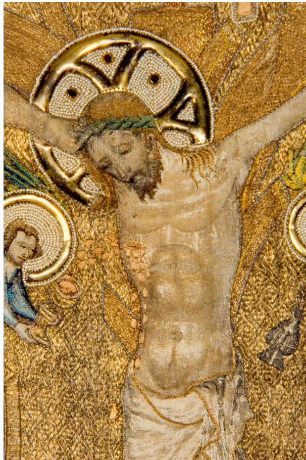
Figura 8: Casula di Broumov (particolare), Umeleckoprůmyslové Museum v Praze, n. inv. 52.901, foto: u(p)m, The Museum of Decorative Arts in Prague

Secondo la tradizione, la regina Elisabetta (Přemysl) di Boemia, madre di Carlo IV, imperatore del Sacro Romano Impero (dal 1355 al 1378) decorava i suoi ricami con perle e pietre preziose (anche i ricami di perle della cattedrale di San Vito sono a lei attribuiti). 56 Tracce di una donazione simile da parte di una regina si trovano anche nel Regno d'Ungheria: si sa, infatti, che la moglie di Carlo Roberto d'Angiò (1308-1342), ossia Elisabetta di Polonia (Łokietek, 1305-1380), nel suo testamento della fine del XIV secolo (1380) donò diversi