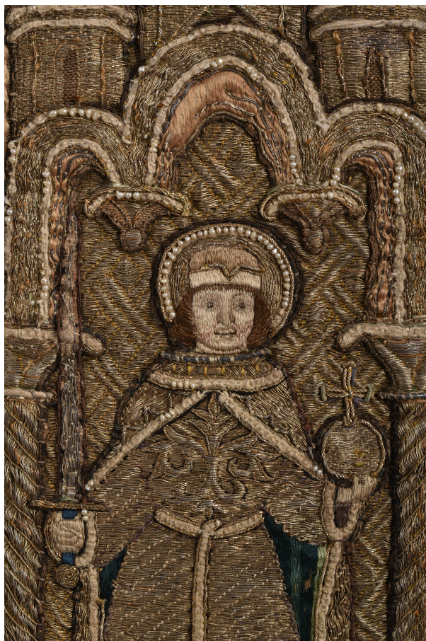
Figura 9: Figura di San Ladislao re d'Ungheria. Casula (particolare), Tesoro della Cattedrale di Esztergom, n. inv. 1964. 299

Inoltre, su un frammento lapideo di un sepolcro pontificale sconosciuto della prima metà del XVI secolo, rinvenuto nel Castello di Buda, è riconoscibile un'altra variante del ricamo a filo d'oro delle croci di casula. Si tratta in questo caso di una versione perlata basata sui motivi tipici del Rinascimento all'antica, dove la decorazione con perle appare sui bordi della croce. 67