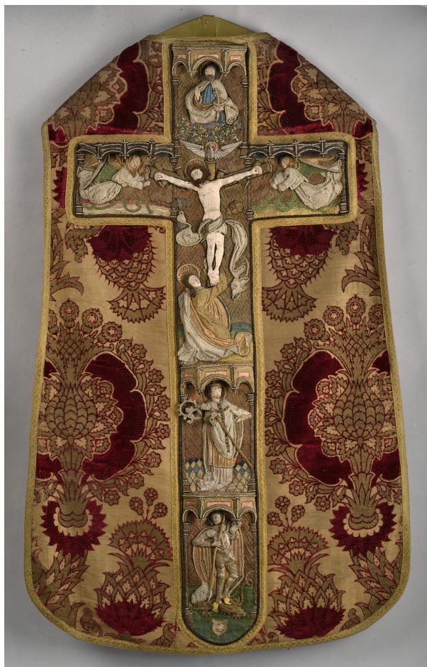
Figura 5: Dietro di una casula, Tesoro della Cattedrale di Esztergom, n. inv. 1964. 303

Dato che gli inventari del 1818 e del 1852 registrano ancora quest'oggetto come "caerulea", cioè di colore blu, è probabile che in seguito sia stato messo su un fondo nuovo. 31 Dal libro d'inventario del 1818 si evidenzia che a Nagyszombat (Trnava, SK), negli anni prima del trasferimento a Esztergom, c'erano in