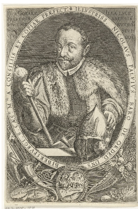
Retrato de Nicolás Pálffy, 1615 (Rijksmuseum Amsterdam) 2

red de contactos con socios comerciales extranjeros con los que comunicaba no sólo en latín, húngaro o alemán, sino también en italiano y español.