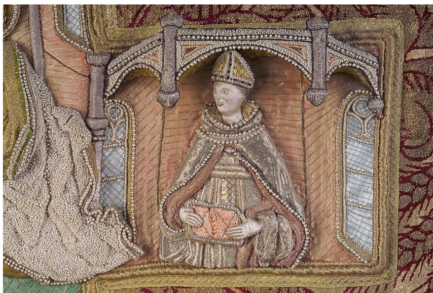
Figura 6: Figura di un vescovo (particolare), Tesoro della Cattedrale di Esztergom, n. inv. 1964. 308

totale 11 vecchie casule con le perline tutte consumate o cadute, principalmente a causa della loro età. Queste vecchie casule, quindi, non venivano usate nel servizio sacro, erano tuttavia conservate appese negli armadi. 32 La terza casula identificabile era una veste precedentemente bianca, il cui tessuto di fondo era stato ravvivato, nel 1609, da colori oro e verde. La sua “preziosa” croce di perline raffigurava la Vergine Maria che teneva in braccio il Bambino, con un monaco da un lato e un vescovo dall’altro. 33 Il testo ricorda pure che l’infula del santo vescovo era decorata con perle e piccole pietre. La casula, in base alla sua croce ricamata, può essere identificata con il paramento corrispondente al numero d’inventario 1964.308, con la differenza che l’inventario registra che il braccio longitudinale della croce fu decorato nel XVII secolo con la figura di un santo vescovo e con quella di Santa Caterina con la ruota.