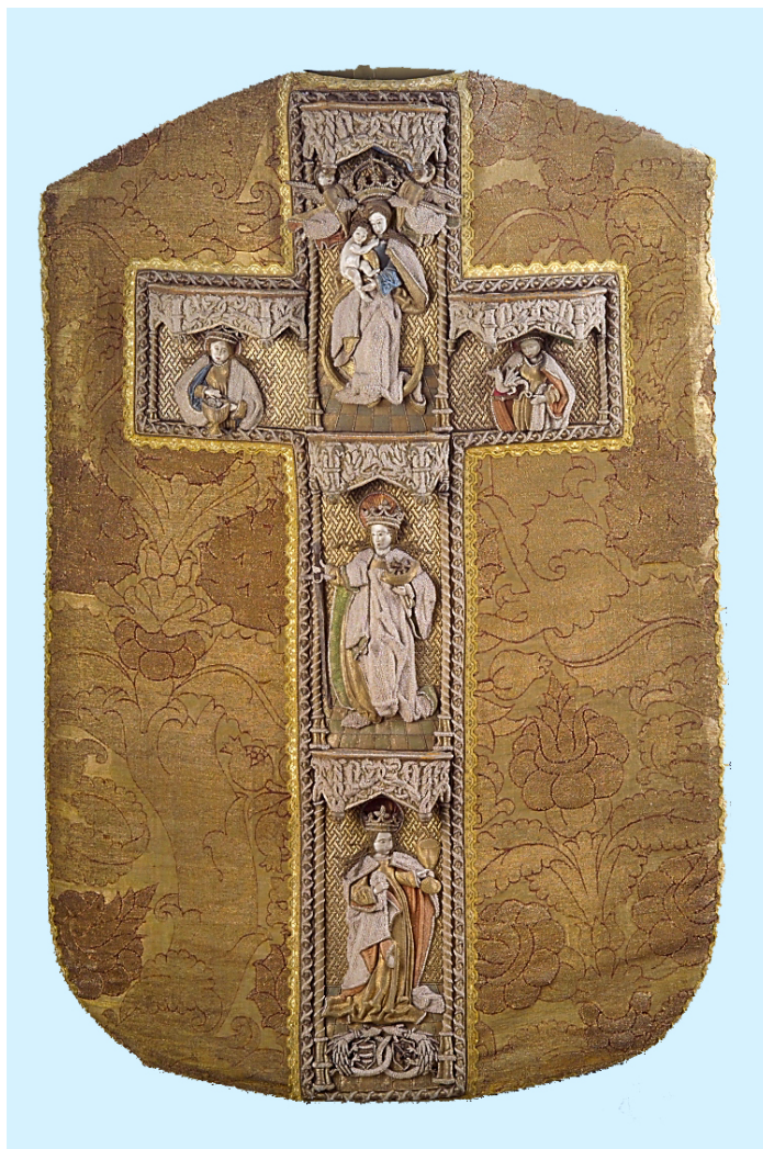
Figura 2: Dietro di una casula, Tesoro della Cattedrale di Esztergom, n. inv. 1964.310

L'inventario del 1609 sottolinea che il paramento ha una larga croce ricamata con perle e filo d'oro. Si tratta di una croce davvero imponente: le intere e le mezze figure ricamate a rilievo sono poste sotto baldacchini tardogotici plastificati, l'esterno delle loro vesti è poi interamente ricoperto di piccole perline, la cui presenza fa sembrare la corona di gigli sulla testa delle sante un gioiello.