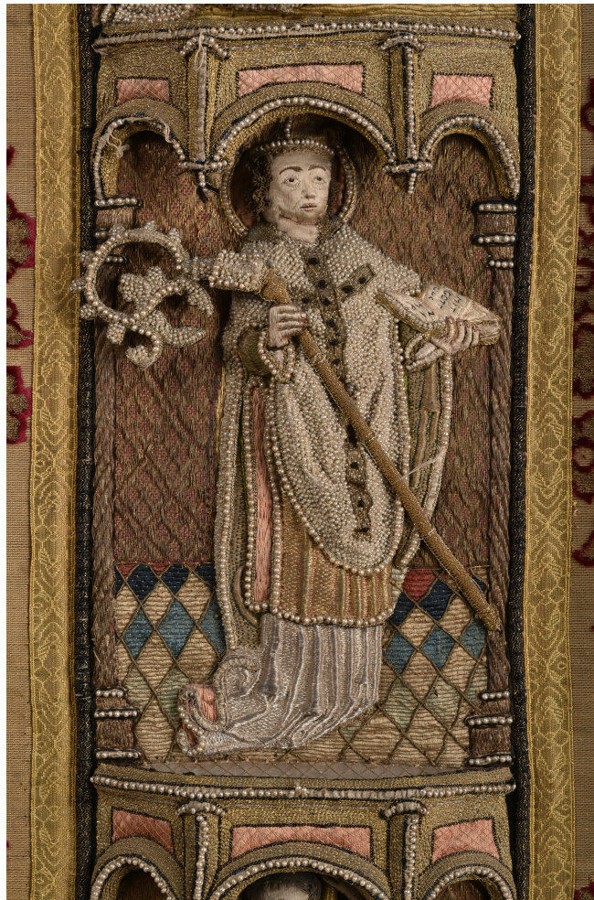
Figura 4: Figura di un santo vescovo. Casula (particolare), Tesoro della Cattedrale di Esztergom, n. inv. 1964. 303

La composizione della croce ricamata, posta su un fondo di velluto attualmente di colore rosso e intrecciato con filo metallico, è intatta e la sua base è curvata. In un lavoro che riassume il materiale archeologico ungherese dell'esposizione mondiale di Vienna del 1873, si nota tuttavia che la croce fu restaurata in molti punti. 30