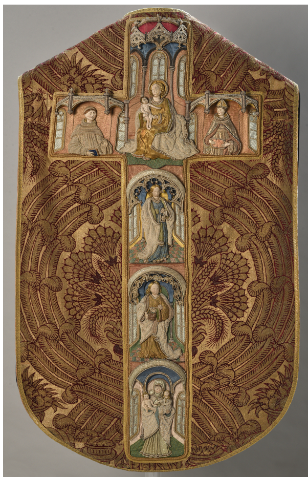
Figura 7: Dietro di una casula, Tesoro della Cattedrale di Esztergom, n. inv. 1964. 308

La parte superiore della croce sul dietro del paramento è identica al testo corrispondente all'inventario del 1609, le raffigurazioni del braccio della croce sono tuttavia diverse, poiché oggi vediamo la figura di Santa Dorotea e la raffigurazione della Sant'Anna Metterza sotto la figura di Santa Caterina. Grazie a una tecnica speciale e al bellissimo disegno rinascimentale dell'attuale tessuto di fondo del paramento, questo viene chiamato dai posteri la casula di Mattia Corvino.