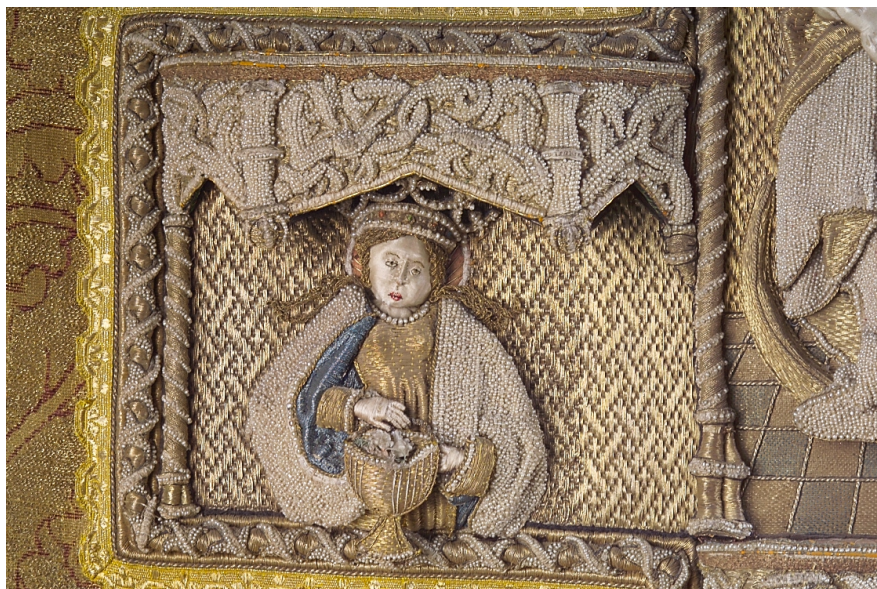
Figura 3: Figura di Santa Dorotea. Casula (particolare), Tesoro della Cattedrale di Esztergom, n. inv. 1964. 310

Sono inoltre ricoperti di perle anche la superficie dei baldacchini a schiena d'asino, intrecciati da viticci di piante, nonché il doppio stemma alla base della croce.