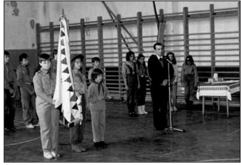
A vásárosnaményi cserkészszavató ünnepségén jelen van a polgármester és a helyi nagy egyházak képviselői.