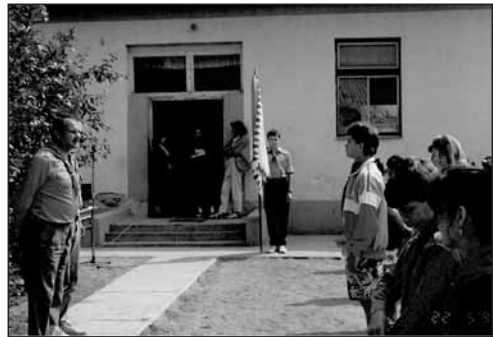
A Brassai Sámuel cserkészcsapat seregszemléje a tiszaadonyi iskola udvarán 1992 tavaszán