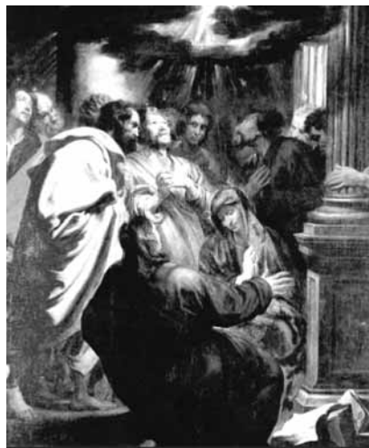
Anthonis Van Dyck (1599-1641): A szentlélek kiáradása, 1618-1620