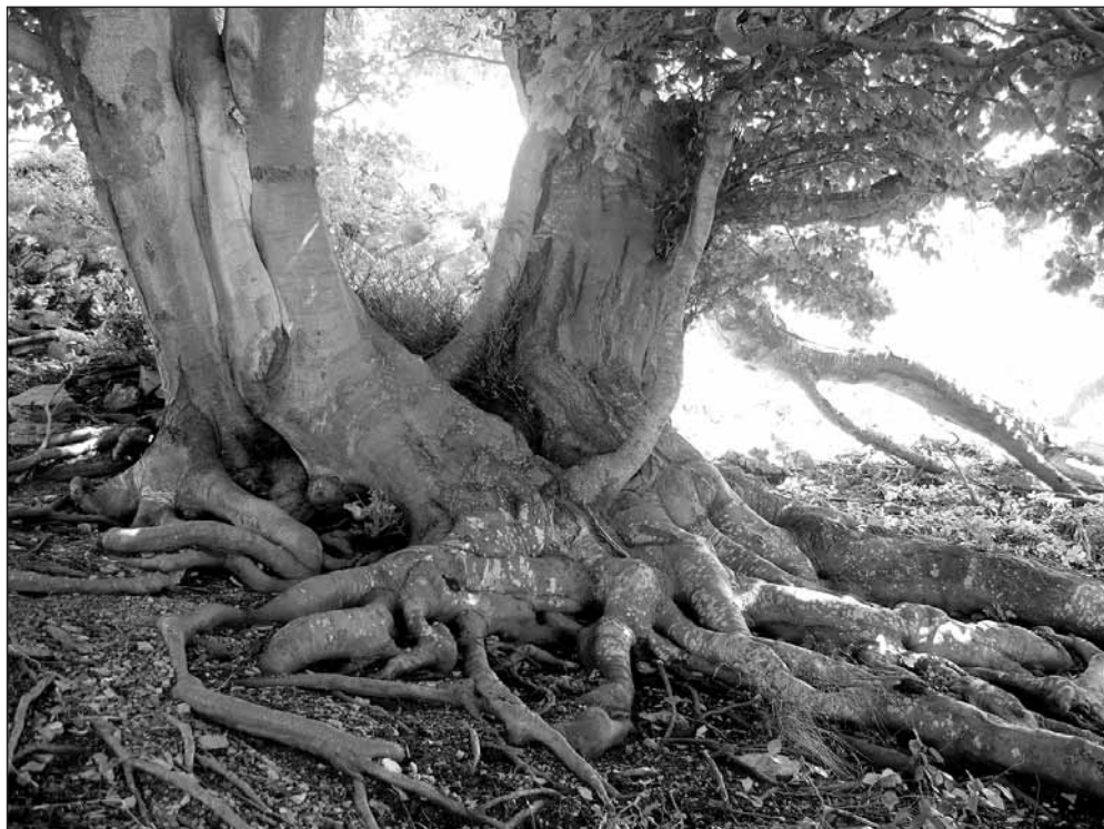
Oláh András: Gyökerek