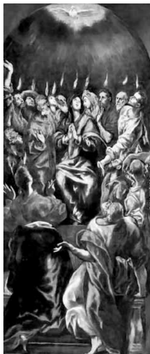
El Greco (Doménikos Theotokópoulos, 1541-1614): A Szentlélek kiáradása, 1604-1614

Már az előző ábrázoláson is tetten érhető a kiáradástémából fakadó miszticizmus, ez azonban még fokozottabban van jelen El Greco „A Szentlélek kiáradása” c. képén, mely a manierizmus stílusában fogant, a figura serpentinata eszközével juttatva kifejezésre az ábrázolt tanítványok és Mária érzelmének szenvedélyességét, dinamizmusát. A kép éber kolorizmusa, a hidegek és melegek ritmikus játéka, részben átlós összekapcsolódása, valamint a bőven redőzött drapériák által teremtett fény-árnyék jelensége adja a kép mély érzelmi töltését, így érzékeltetve a hívekben tomboló mély hitélmény valóságát. Ráadásul az alakok valószínűtlen megnyújtásával El Greco – a szent szellem munkálkodásán és a mély hitélményen túl – képes kifejezni az apostolok fenségességét is. A képen azt láthatjuk, ahogyan a Szentlélek galambja lángnyelvek formájában száll a hívekre, akik aztán majd különböző nyelveken megszólalva értetik meg magukat a különböző vidékekről hozzájuk zárandoklókkal. E kép nagyfokú miszticizmusát többek között a festőre hatást gyakorolt bizánci hatással magyaráz-