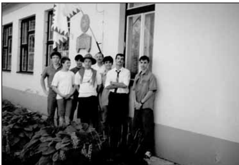
A Brassai-emlékfal előtt Tiszaadonyban