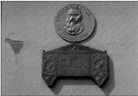
A Brassai Sámuel cserkészcsapat emléktáblája a tiszaadonyi iskola falán (1991)