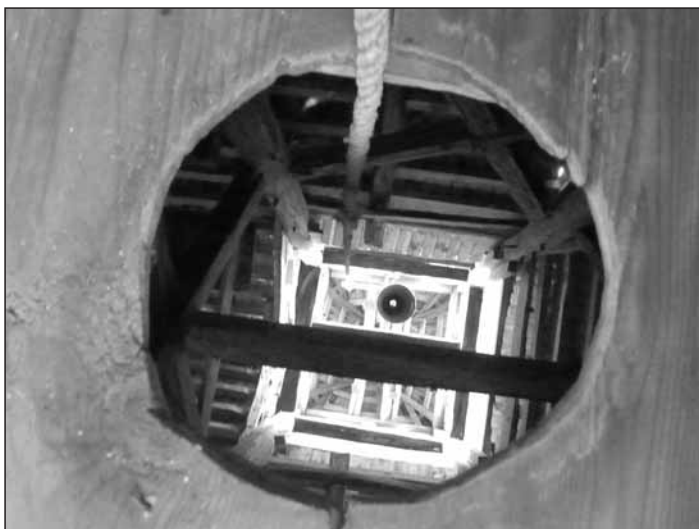
Oláh András: Harangláb