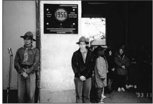
A beregi cserkészek a helyi közéletben II. A vásárosnaményi 1956-os emléktábla főtéri avatása 1993.októberében.