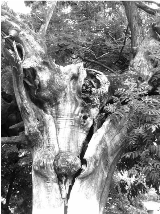
Oláh András: Átváltozás