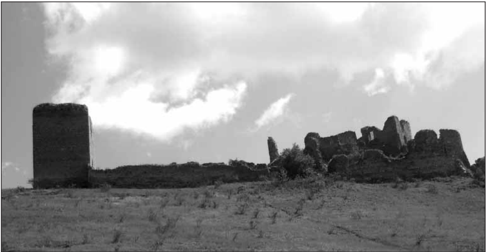
Oláh András: Torockószentgyörgy

a házad előtt állsz, áttetsző vagy. integet felém egy nem látható tartomány.