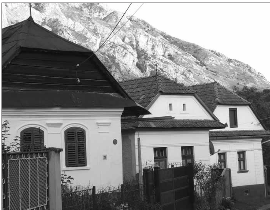
Oláh András: Otthonaink