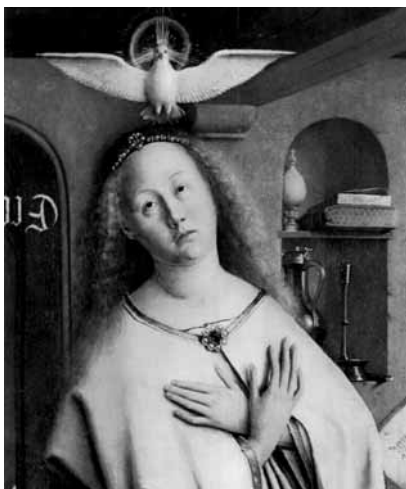
Jan van Eyck (1390-1441): Mária és a Szentlélek, 1426-1432