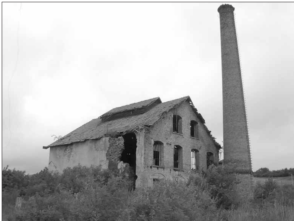
Oláh András: Nyomaink

Nem ismertem, de azóta a szívembe zártam. Nálam ez a három obeliszk tartja egyben a Nagy Idők emlékezetét Pákozdtól a Nyergestetőig. Majd 600 kilométerre egymástól, de most nem a távolság számít. Hanem a helytállás tanulsága. Aminek megértése mintha fogyatkozna az emberekből.