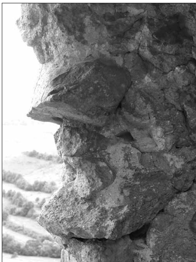
Oláh András: Kőarc

Kocsis Csaba: Elrabolt ötven évem... (Intermix Kiadó, Ungvár-Budapest – 2017)