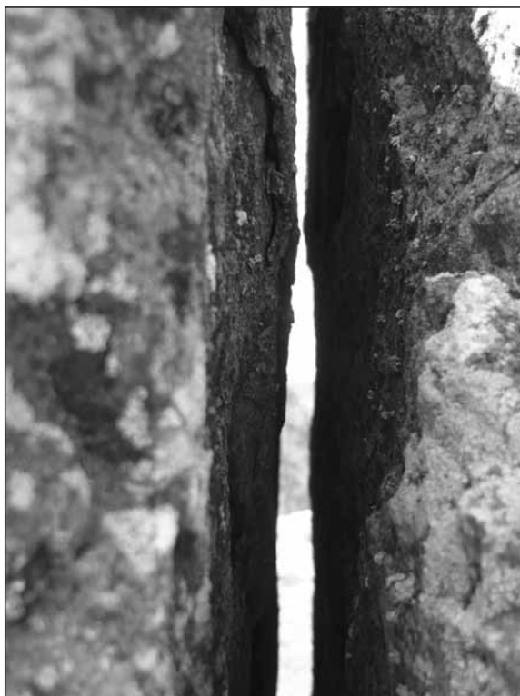
Oláh András: Rések

Fél óra múlva horkolt a 110-es szoba és Tomcsi azt álmodta, hogy a háza kertjében nyírta a fűvet, amikor a banki ember becsöngetett. Levegő után kapkodva ébredt.