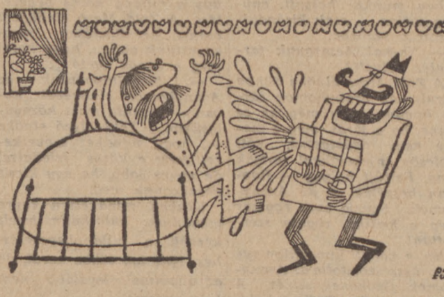
(Fülöp György rajza)

- Megörültél? Férfiaknál nincs locsolás! - De tavaszi munka van!