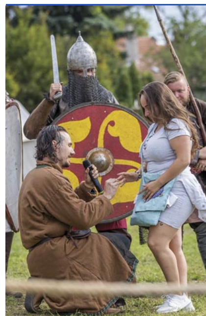
Lánykérés a Történelmi Témaparkban

az időjárás miatt, de pénteken és vasárnap a szokásosnál is gazdagabb volt. Meglepő program is bőven akadt. Viszonylag új fesztiváltrend, hogy a kifejezetten gasztronómiai rendezvények mellett más eseményekbe is becsempészik a szervezők a főzőkultúrát, és ezt most a szombathelyi szervezők is megtették, összefüggésbe hozva a történelemmel. A GusztóTéren állt az a színpad, amelyen ókori ételeket készített a Collegium Gladiatorium csapata, ők azzal készültek, amit az egykori gladiátorok ehettek. Főztek a Savaria Legio Egyesület tagjai, nagy sikert arattak au-