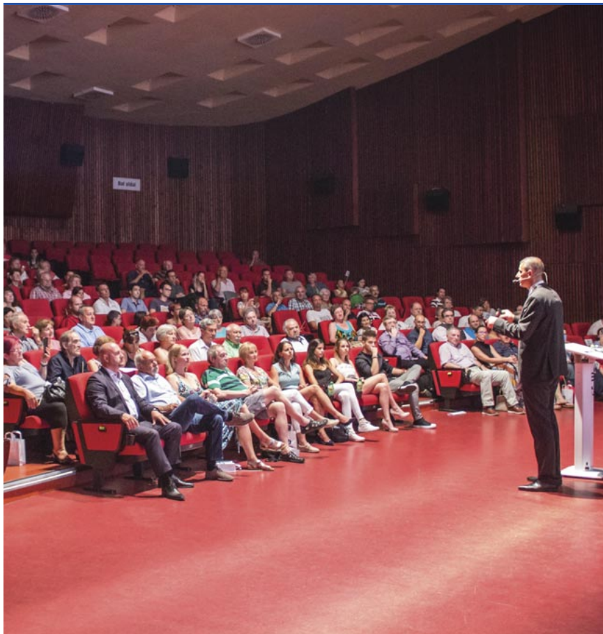
Több száz érdeklődő előtt mutatta be programját az Éljen Szombathely!