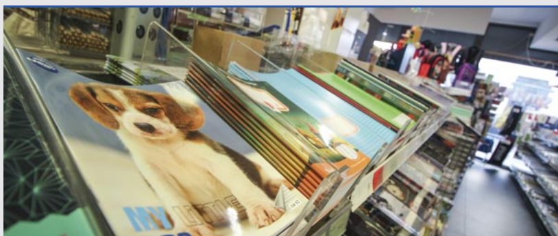
A tanévkezdés nagy kiadással jár a családoknak

Augusztus első napjaiban megérkeztek a tankönyvek az iskolákba, amelyeket pedagógusok és közösségi szolgálatot teljesítő diákok csoportosítottak a vakáció utolsó hetében. A legtöbb helyen ezen a héten ki is osztották a csomagokat. Ezeket a 2019/2020-as tanévben az 1-9. évfolyamon már minden diák ingyen kapja használatra, a magasabb évfolyamokon tanulók közül pedig szintén nem kell fizetniük a nagycsaládban élőknek és más rászorulóknak. A jövő ősszel kezdődő tanévben várhatóan mindenki számára ingyenesek lesznek a könyvek. A tartós darabok jellemzően több évig kiszolgálják a gyerekeket, azokat minden tanév végén le kell adniuk az intézményben, hogy a következő évfolyam