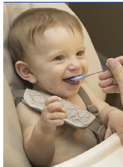
Ha van útközben gyerekbarát pihenőhely, akkor könnyebb dolgunk lehet az etetéssel

már kicsit kitolható az étkezés ideje. Ha kisebb babával utazunk, még indulás előtt nézzük meg, hol lesz lehetőség megállni, pihenni. Lehetőleg olyan pihenőhelyet keressünk, ahol benzinkút és étterem is van, hogy megkérhessük a személyzetet, melegítsék meg az üveges bébiételt. Ha ilyet nem találunk, akkor érdemes beszerezni egy autós cumisüveg- és bébiétel-melegítőt. Érdemes olyan üveges bébiételt vinni magunkkal, amit már ismer és szeret a pici. Amit feltétlenül vigyünk magunkkal az etetéshez, akár több darab előke, pár kanál, törülközők, textilpelenka, zacskó a termelődő szemétnak. Arra viszont érdemes számítani, hogy ha a gyerek hátul, a biztonsági ülésbe kötve egyedül kezd eszegetni, a kocsit tele lesz morzsával, maszattal, ahogy a gyerek is. Ezért jó, ha a kistáskában ott lapul egy