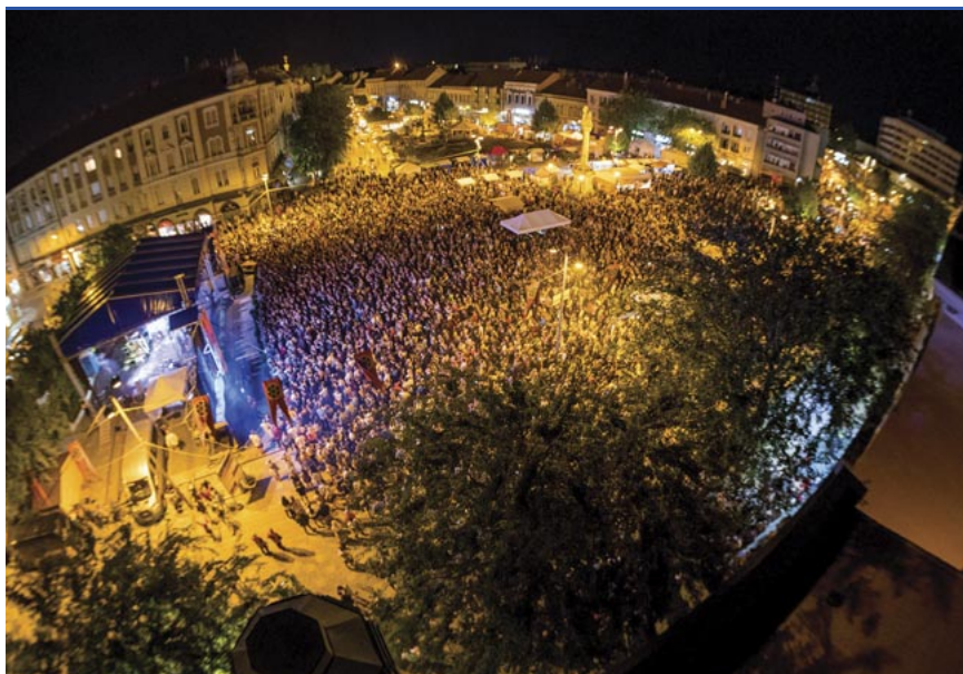
A Bagossy Brothers Company koncertje madártávlatból