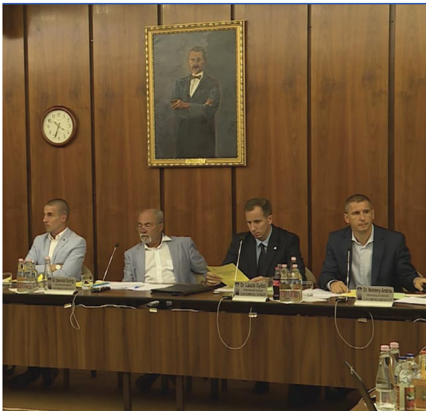
Ellenzéki képviselők a rendkívüli közgyűlésen

A közgyűlésben résztvevők közül mindenki a zöld gombot nyomta annál a szavazásnál, ami arról szólt, hogy a jövőben két héten belül a városi delegáció vezetőjének be kell számolnia a városi utazásokon törtétekről. Ezen felül támogatták a képviselői keretek felhasználását, illetve a költségvetési módosításokat is elfogadta a városi közgyűlés.