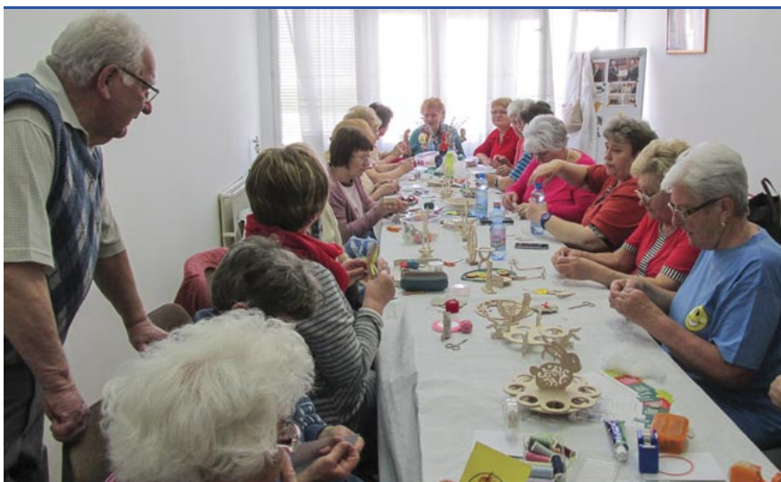
Számos program várja a nyugdíjasokat

désre tartanak számot. Hagyományos rendezvényeink közé tartozik a húsvéti kreatív foglalkozás. Ehhez is kapcsolódik az a tavaszi kézműves kiállítás, ahol tagjaink bemutathatják alkotásaikat. Megszerveztük az idén is a nyugdíjasok sportnapját, ahol öt sportágban versenyeztek a nyugdíjasok, mintegy 100-an voltunk, de többen kettő-három sportágban is elindultak. A sportnap folytatása Ózdon a Nyugdíjasok Országos Sporttalálkozója volt, ahol az Aranykorúak Sportegyesület tagjai alkotta Vas megyei csapat huszonhárom érmet szerzett és egy vándorserleget