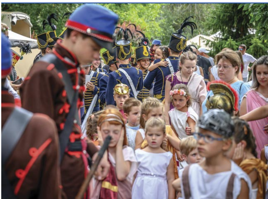
Ismét nagy sikert aratott a Mini Karnevál, a gyermekek felvonulása

jú tevékenység várta a kicsiket. Volt például, ahol a római edények mintázatát idéző virágok és egyéb motívumok öltöttek formát agyagból, és készültek belőlük medálok, csebecsék. A színpadon szinte megállás nélkül szólt a zene, és léptenyomon lehetett játszani, okosodni, szórakozni. Újított a tűzoltóság, idén nem házat kellett oltani, hanem fergeteges habpartit rendeztek a gyerekeknek, aminek óriási sikere volt.