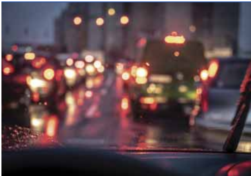
A közlekedési dugók mindennaposak a városban

– A dugók mindennaposak lettek a vasi megyeszékhelyen. A minap Szombathelyre jöttem, és a Hunyadi