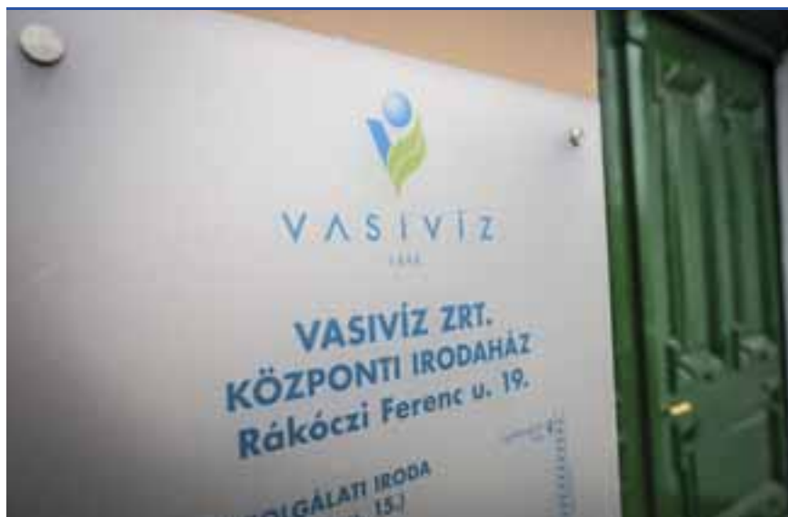
VASIVÍZ: mennyit kapjon a távozó vezérigazgató?

hozott a vezérigazgató munkaszerződésének módosításáról (egy hónappal annak javasolt megszüntetése előtt!), hogy 2019. évre egyszeri bérkiegészítésként a vezérigazgató bruttó 35.327.000 Ft összegre jogosult a havi alapbérén és a prémium összegén felül. Információink szerint e javaslatot – amely további 26 havi bérkifizetés, így mindösszesen mintegy bruttó 60 millió forint kifizetését jelentheti számára – maga a vezérigazgató személyesen terjesztette elő az ülésen.”