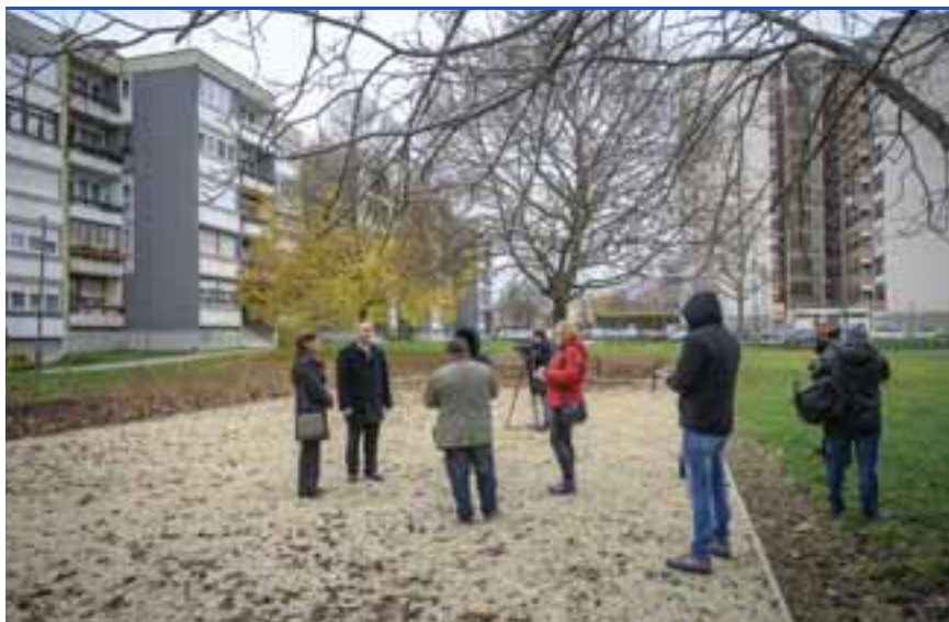
Kicsérélték a padokat, fákat, cserjéket ültettek

– Nemcsak itt, hanem a Pázmány Péter körút 42–52. és az 54–64. közötti területeken is zajlanak javában a munkálatok, az említett helyeken a fásítás mellett játékokat is helyeznek ki tavasszal. Szombathely városának fontos a környezetünk megóvása, a kampányban tett ígéretünk, miszerint