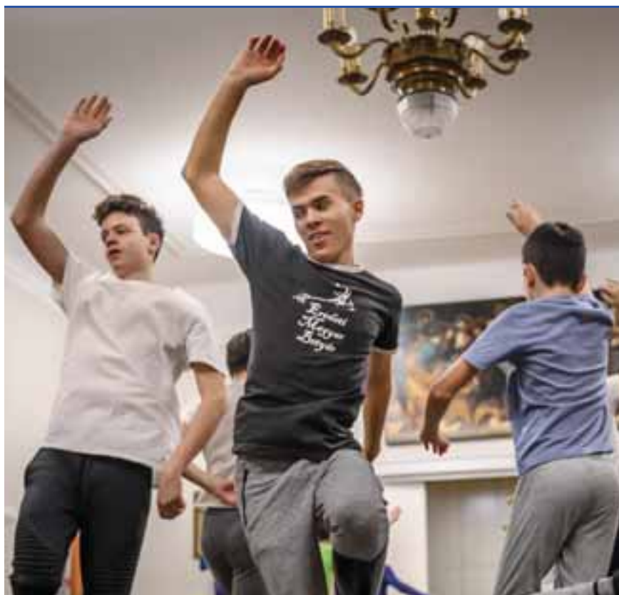
Jövő pénteken szerepelnek a középdöntőben az ifjú néptáncosok