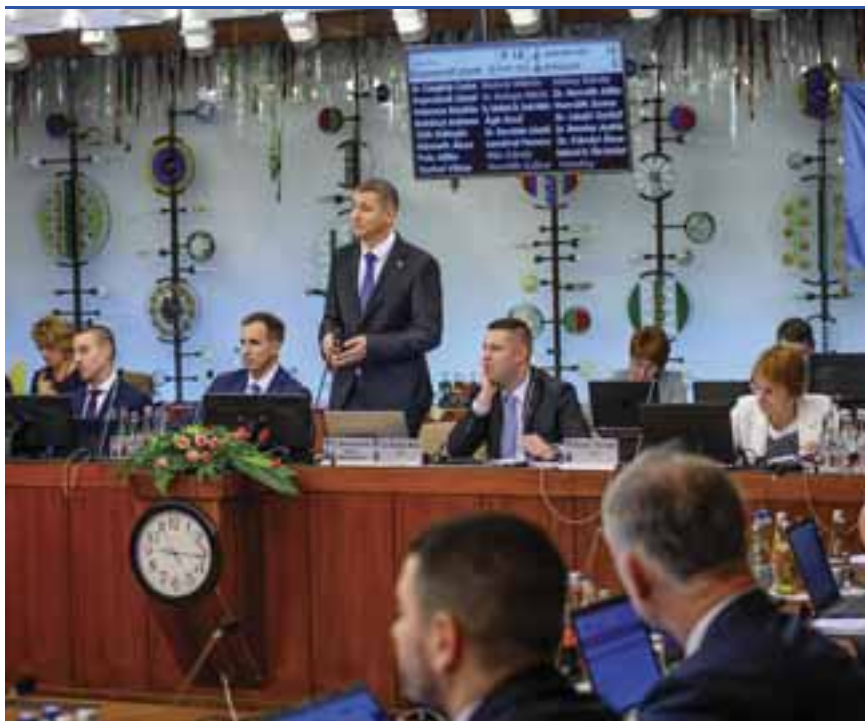
Délelőtt a Nagyszállóról, szociális lakásokról és utakról vitáztak a képviselők