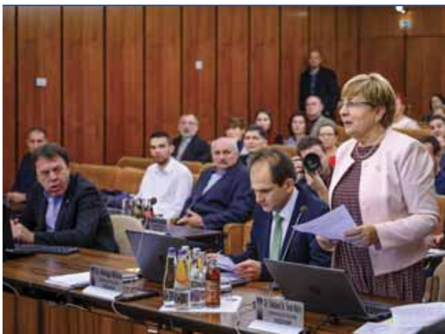
Délután a személyi ügyek kerültek napirendre

Az alapítványok elnevezése volt terítéken az utolsó szünet után. Az előterjesztés szerint a jóléti alapítványt Szombathely Szent Márton Városa Gyebrovski János Jóléti Alapítvány névre változtatnák, tisztelegve az egykori szociális bizottsági elnök emlé-