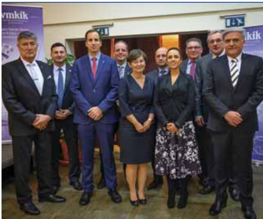
Ünnepi csoportkép: 25 évvel ezelőtt alakult meg a Vas Megyei Kereskedelmi és Iparkamara

Magyarországon a kereskedelmi és iparkamarák létrehozásáról először egy 1850-es királyi pátens rendelkezett, az első törvény pedig 1868-ban jelent meg. Ez kötelezően kiterjedt a magyar állami minden kereskedőjére, iparosára, iparvállalatára. A második világháború után, 1948-ban a Rákosi-rendszer jogutód nélkül számolta fel a kamarákat. Az 1994. évi törvény a magyar közjogi hagyomá-