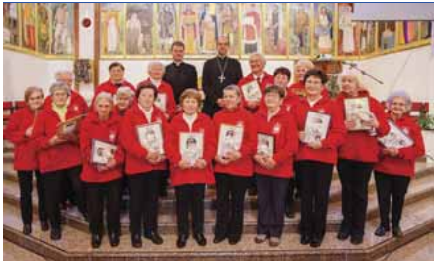
Megköszönték az önkéntesek áldozatos munkáját