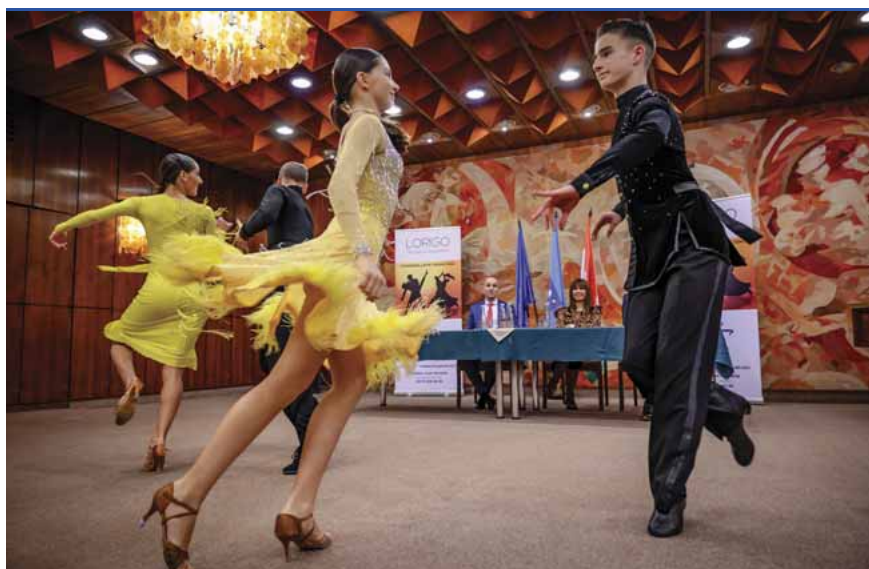
Szombathelyi párosok is indulnak a Tíztánc Magyar Bajnokságon