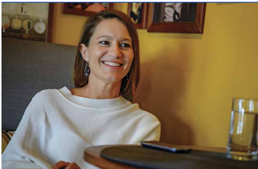
Nem szimpla kávézó: volt már művészterasz, divatbemutató, kertmozi is

– Szerettünk volna a vendéglátáson és a kiszolgáláson kívül valami pluszt adni a vendégeknek. A kezdet kezdetén az első teraszon tartottuk a koncerteket, leginkább helyi zenekarok léptek fel. Amikor ezt kinőttük, beköltöztünk a Zsinagóga udvarra, ami kiváló helyszínnek bizonyult, ide már nagyobb volumenű koncerteket is szervezhettünk. Az évek során egyre gyűltek a fellépők, épültek a kapcsolataink, bővült az ismeretségi körünk, és mind többen találtak meg minket is, akik szerettek volna jönni. Az első nagyobb koncert, amire emlékszem, a Blues Jam volt, valamikor 1999-2000-ben. Akkoriban még kevesebb zenekar működött a városban, de akik voltak, szívesen jöttek hozzánk fellépni. A vendégek is vevők voltak, hamar rákaptak az ízére, hogy