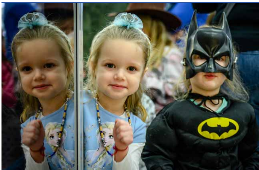
Jelmezes gyerekek lepték el a hivatal auláját

A gyerekeket és szüleiket több program is várta: felléptek a Bartók Béla Zeneiskola növendékei, a Szamáoca