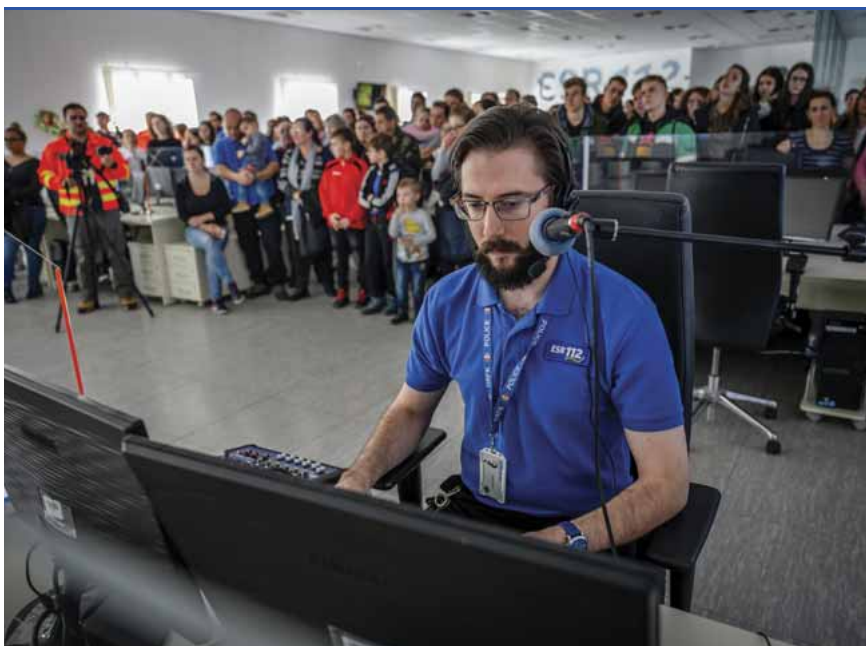
Sokan voltak kíváncsiak a Szombathelyi Hívásfogadó Központ nyílt napjára

Idén először az együttműködő szervezetek egy-egy tagját is jutalmazták. A nyílt napon az érdeklődők elsősegélynyújtási és újraélesztési