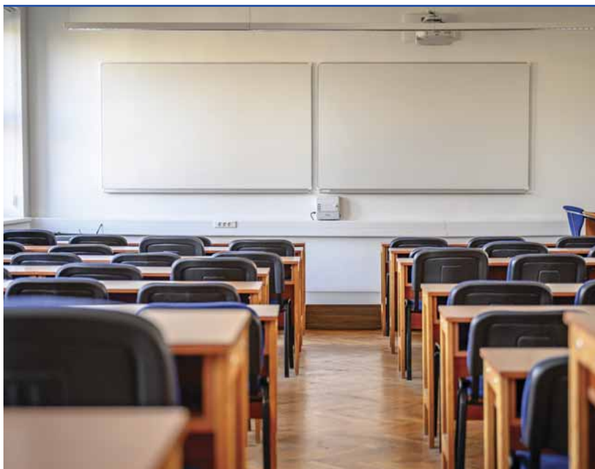
Üres előadóterem az ELTE SEK-en: bezárták az egyetemeket

Közölte: megpróbálnak kellő mennyiségű kézfertőtlenítőt beszerezni, azon munkahelyeken azonban, ahol ez nem áll rendelkezésre, a kézmosás is egyfajta fertőtlenítést jelent. Beszámolt arról is, hogy színházi és mozielőadások maradnak el a jövőben, a bevásárlóközpontokra azonban nem vonatkozik a százfős tilalom. Az óvodák, bölcsődék önkormányzati fenntartásúak, így a helyhatóságok döntenek azok esetleges bezárásáról. A sok embert foglalkoztató cégeknek is azt ajánlják, hogy saját hatáskörben