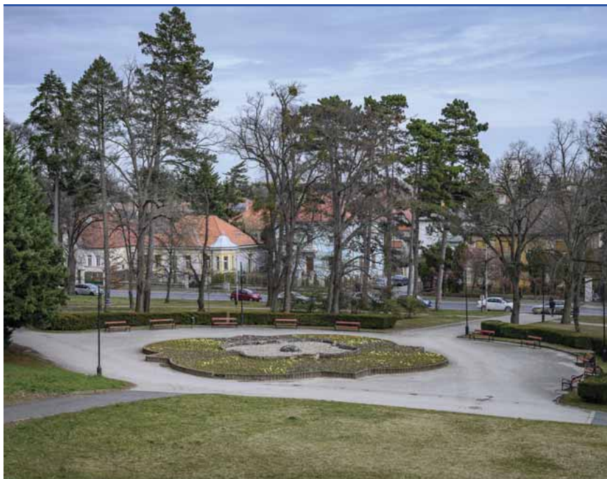
Itt állítanák fel a tervezett emlékhelyet