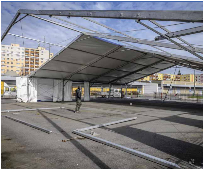
Jövő tavaszig tart a Vásárcsarnok felújítása

A több mint 40 éves épület villany- és vízhálózata, a gáz- és központi fűtési rendszere is igencsak elöregedett, megette az idő a berendezéseket, de a padló is töredezett. A hangosítás sem megoldott: egy tűzriadó esetén például kézi hangszórót tudnának csak használni a vásárcsarnokban. Az 1,8 milliárd forintból megújulnak a belső és külső árusító-, illetve kiszolgálóhelyek, az irodák; korszerűsítik a gépészeti rendszert, és az akadálymentesítést is megoldják. Egybeépítik a két különálló csarnokrészt is, de a vásárcsarnok homlokzata is megszépül. Egyebek mellett a kültéri árusítóhelyeket is kényelmesebbé teszik, fejlesztik.