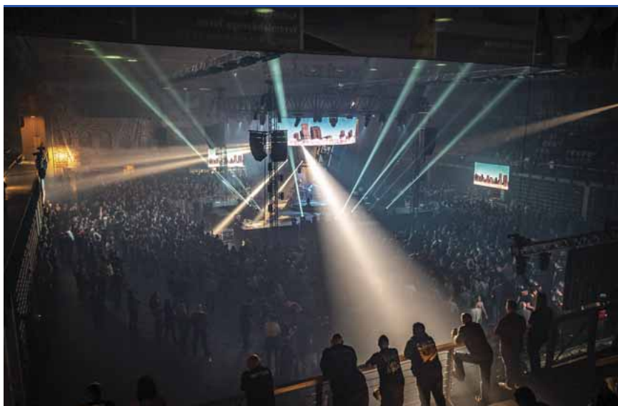
Korábbi koncert Szombathelyen: a nagyrendezvényeket lemondták

A Magyar Labdarúgó Szövetség a kormány rendkívüli döntését követően csütörtöktől visszavonásig az összes magyarországi labdarúgó-mérkőzés zártkapus megrendezését rendelte