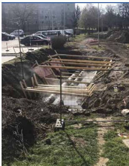
Kicszerélik a hibás szakaszt

Szombathelyen összesen 22 kilométer távvezetéken keresztül biztosítják a távhőszolgáltatást, amely vezetékrendszer egyes szakaszai előregedtek