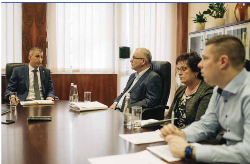
A Szombathelyi Védekezést Segítő Tanácsadó Testület ülése

Szombathelyen a héten így festett a helyzet koronavírus-ügyben: a múlt vasárnap fertőzégnyával szállítottak Budapestre egy szombathelyi nőt, aki egy debreceni fertőzöttnél járt még a betegség lappangási ideje alatt. A hölgy első tesztje negatív lett, lapzártakor még nem érkezett meg a nemzetközi protokoll szerint elvégzett, második vizsgálat eredménye. Sajtóhírek szerint a nő a Nevelési Tanácsadóban és egy másik, szintén