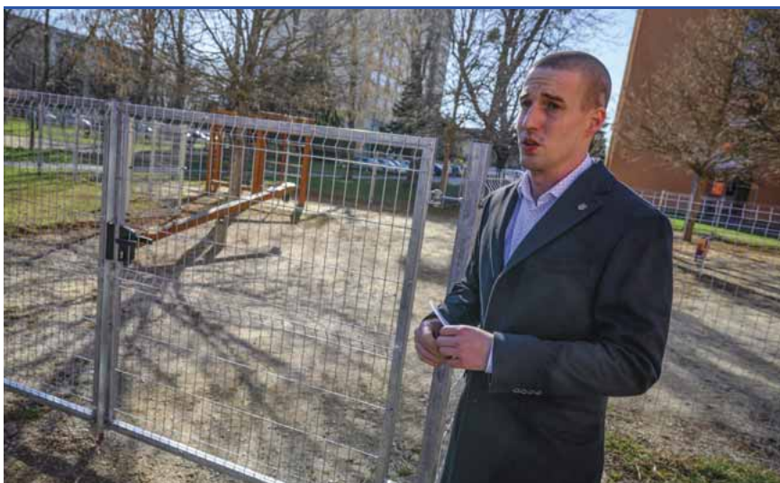
Több beruházás is elkészült a lakótelepen