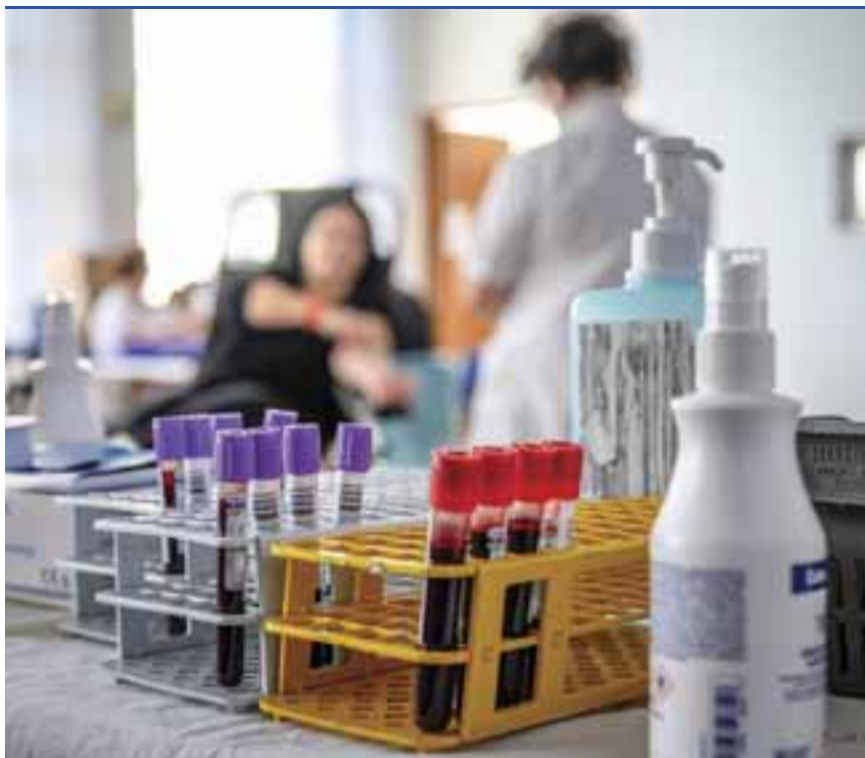
A tervezett műtéteket elhalasztják a kórházak, de a vére így is nagy szükség van

A nagy cégek, intézmények egyre nagyobb hangsúlyt fektettek arra, hogy dolgozóik a lehető legkényelmesebben, időt, fáradságot megtakarítva segíthessenek embertársaikon. Rendszeresen tettek eleget a Vöröskereszt kérésének, és fogadták szervezett véradások keretében a Vérellátó Szolgálat munkatársait. A vállalatok nemcsak a helyszínt biztosították, hanem a legkülönbözőbb juttatásokkal, például üdülési utalványokkal, ajándéktárgyakkal, munkaidő-kedvezményel ösztönözték munkatársaikat arra, hogy minél többen adjanak vért. A koronavírus-járvány miatt a gyárak munkavállalóik és a termelés védelmében belépési stopot rendeltek el, emiatt a szervezett véradások elmaradnak. „Sajnos a vállalatok, intézmények szinte kivétel nélkül lemondták az előre egyeztetett kitelepüléseinket, ami nagy kiesést jelent, hiszen egy-egy ilyen alkalommal 30-40 vagy ennél is több önkéntes nyújtotta a karját. A biztonságos egészségügyi ellátás érdekében így most még nagyobb energiát kell fektetnünk a donorok toborzásába. Heti tervvel dolgozunk. Vidéken nehezebb, Szombathelyen könnyebb a dolgunk, hiszen itt működik a Vérellátó Szolgálat területi intézete, ahol folyamatosan fogadják a véradókat. Tavaly közel 12 ezer véradót toborzott Vas megyében a Vöröskereszt. Március elejétől már 27%-kal esett vissza az önkéntesek száma – mondta el lapunknak Tóthné Horváth Zsuzsanna, a Magyar Vöröskereszt megyei véradásszervező koordinátora.