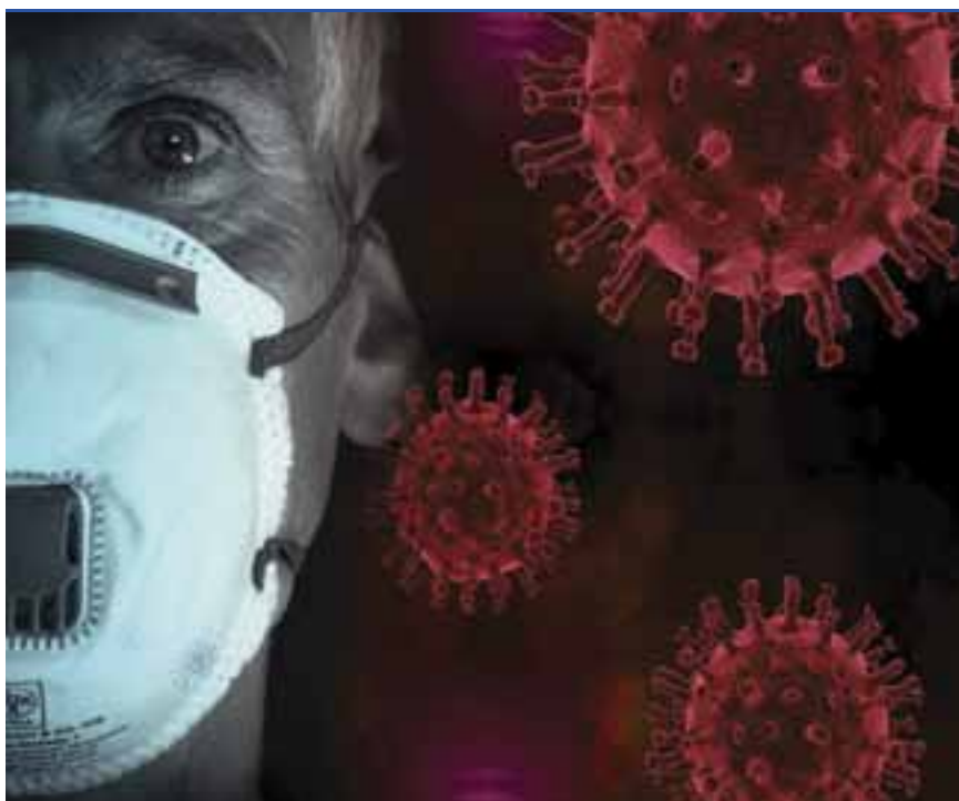
A bűnözők igyekeznek kihasználni az egészségügyi válsághelyzetet

Fontos, hogy ne engedjünk be idegent, és ne higgyünk el valótlan történeteket! A leghatékonyabb módszer