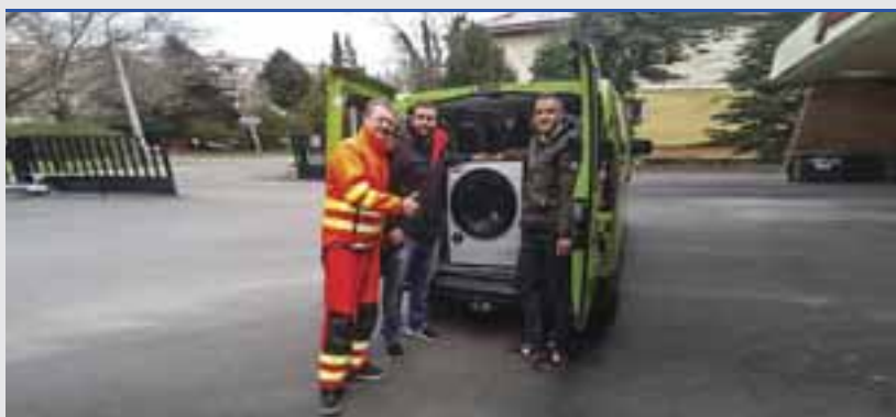
A rumi futballcsapat átadta a mosógépét a sárvári mentősöknek

Az egyik ilyen közösségben vetődött fel, hogy a mentősök nem szívesen viszik haza a munkában használt, a fertőzésnek jobban kitett ruhájukat, így szükségük lenne a mentőállomásokon mosógépre. A hétvégén a tagok egy nap alatt megszervezték, hogy Szombathelyen legyen egy mosó-, illetve egy szárítógép, volt, aki 20 kiló mosóport is felajánlott. A héten a rumi futballcsapat adta kölcsön saját keszülékét a sárvári mentősöknek, a celdömölki mentőállomásra is ju-