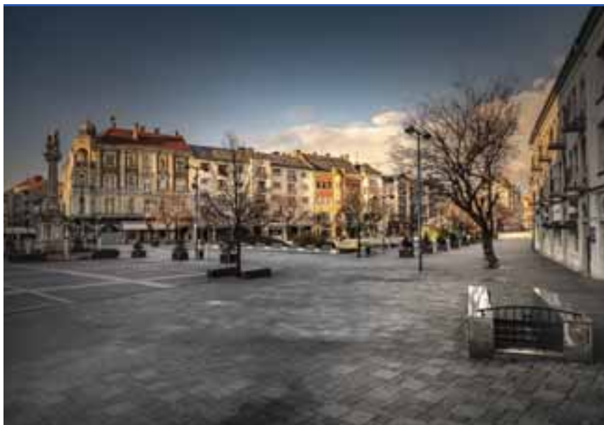
A kiürült Fő tér: segít a megelőzésben, ha otthon maradunk

A kis- és a nagyvállalatok dolgozóit is igyekeznek a saját eszközeivel védeni a város, jelentette ki Nemény András. A többi megyei jogú város vezetőjével együtt újabb csomag kidolgozására tesznek javaslatot a kormányhoz az eddigi mellé. Az ingyenes parkolást nem akarják