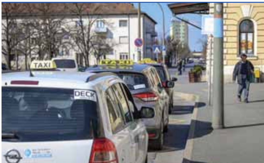
A taxisok után újabb vállalkozók kapnak mentességet

A kormányfő a KATA mentességi körébe eső területek között említette a fodrászatot, a szépségápolást, a festést, az üvegezést, a villanyszerelést, az egyéb humán-egészségügyi ellátást, az előadóművészetet, a víz-, gáz-, fűtésszerelést, az épületasztalosságot, a járóbeteg-ellátást, a padló- és falburkolást, a testedzési szolgáltatást és egyéb sporttevékenységet, valamint az idősek és a fogyatékkal élők ellátását. A pontos felsorolást külön rendelet tartalmazza majd. Azt is közölte Orbán Viktor,