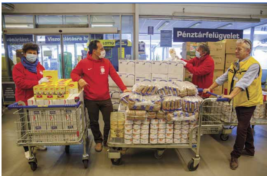
Négyszáz családnak vásároltak tartós élelmiszert

Az adományok célba juttatásában a plébániai karitászcsoportok munkatársai vesznek részt az egyházmegyéhez tartozó Vas és Zala megyei településeken. Felméri, hogy hol mire van igény, illetve a plébánosok