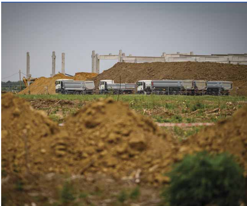
Az épülő új Schaeffler-üzem Szombathely határában: nem lesz változás

A Miniszterelnökség múlt szerdán a hivatalos oldalán aztán közleményben pontosított: azt írták, hogy „a kormány benyújtotta a különleges gazdasági övezetekről szóló törvényjavaslatot. Azonban az ebben foglalt változás nem érinti a helyi és a központi adóarányának eddigi rendszerét, nem vonatkozik a fővárosban, a budapesti