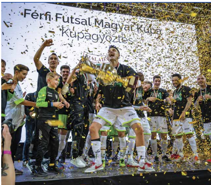
A kupagyőzelem ünneplése: a bajnokságban is jól ment a csapat

– Hazudnék, ha azt mondanám, hogy nincs bennünk hiányérzet, hiszen többször is elmondtam korábban, hogy nagyon jól sikerültek