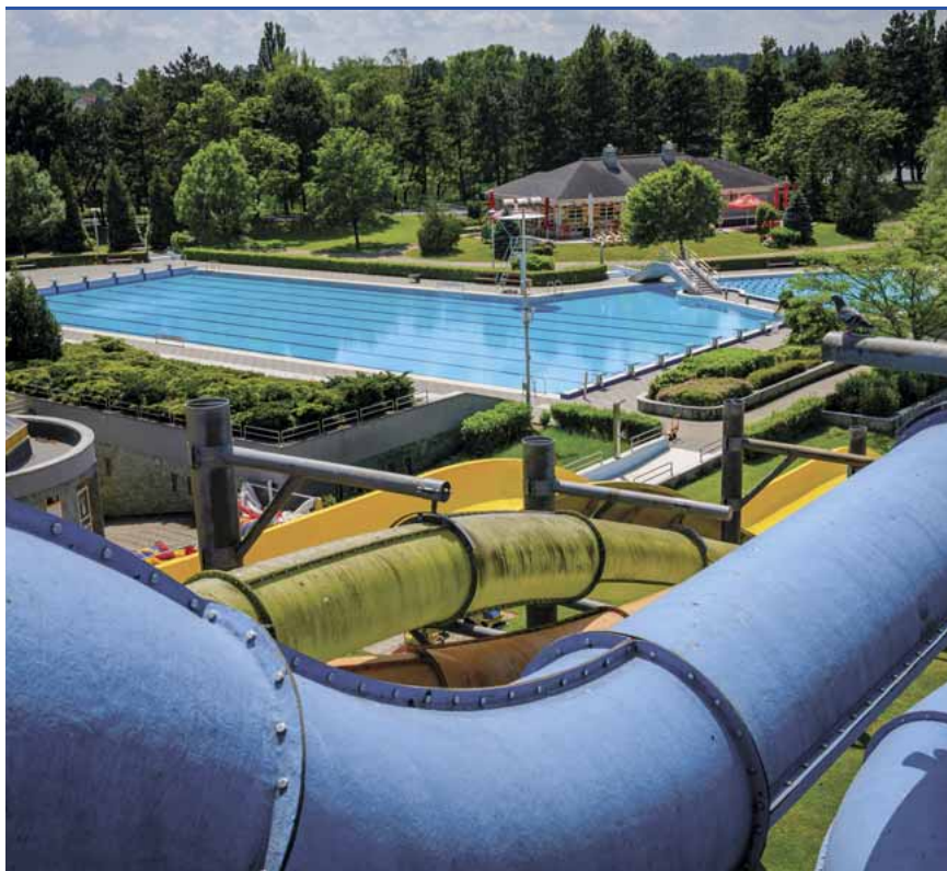
Biztonsági szabályokkal indulhatnak újra a fürdők

A gyerekek számára kifejezetten jó hír lehet, hogy a szigorító intézkedések ellenére a csúszdák, a szabadtéri játszótérek és a hullámedencék a megszokottak szerint üzemelnek majd a szezonban.