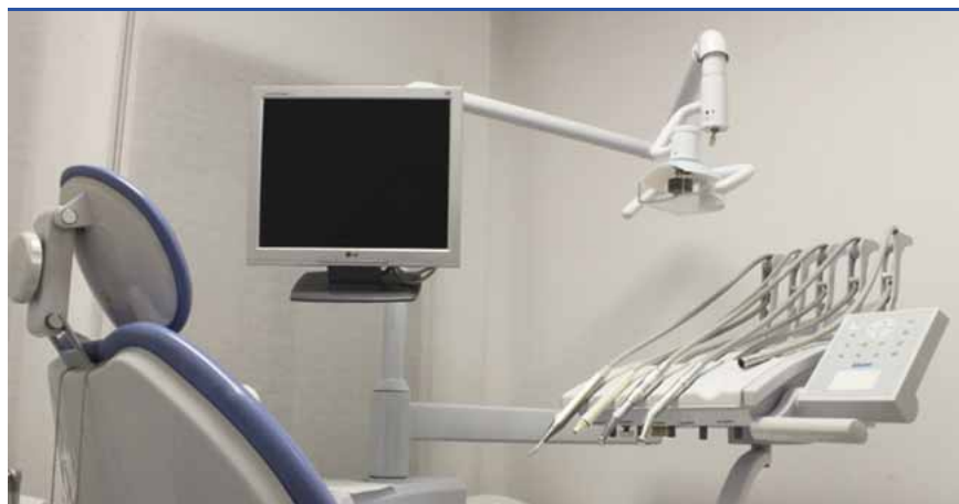
Fogorvosi rendelő betegekre várva: szigorú rendszabályok