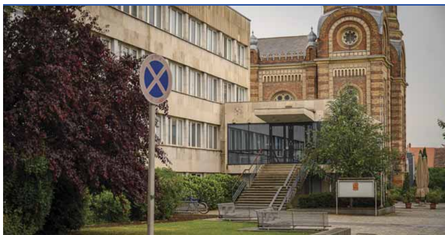
A Zeneiskola épülete: a minősítő vizsga miatt nagy a felháborodás