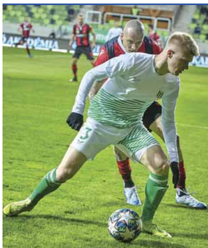
Kupamérkőzés Szombathelyen

– A focisták valóban kértek 20 millió forintot most, ám a történet korábbról indul. Szeptemberben azt mondták a klub tulajdonosai, ha nem kapnak 150 millió forintot, akkor biztosan nem lesz licence a csapatnak, így kizárhatják a gárdát a másodosztályból. Akkor a közgyűlés nehéz döntést hozott, de egyhangúlag megszavazta a kért összeget. Novemberben újabb 100 millió forintos támogatási kérelem érkezett a városhoz, dr. Czeglédy Csaba képviselő akkor azt indítványozta, hogy ezt az összeget kölcsön formájában adja az önkormányzat a klubnak, a kezességért pedig az ügyvezető vállaljon felelősséget. Akkor itt megállt a történet. Később a jelenlegi ügyvezető azt nyilatkozta, hogy nincs szükségük a pénzre. A labdarúgócsapat jellemzően mindig arra szokott panaszkodni, hogy magasak a fizetések, sokba kerül az utazás, minden meccs veszteséges, mivel nincs annyi néző, így a rendezői költségek meghaladják a jegybevételét. Úgy tudom, hogy a játékosok korrekten