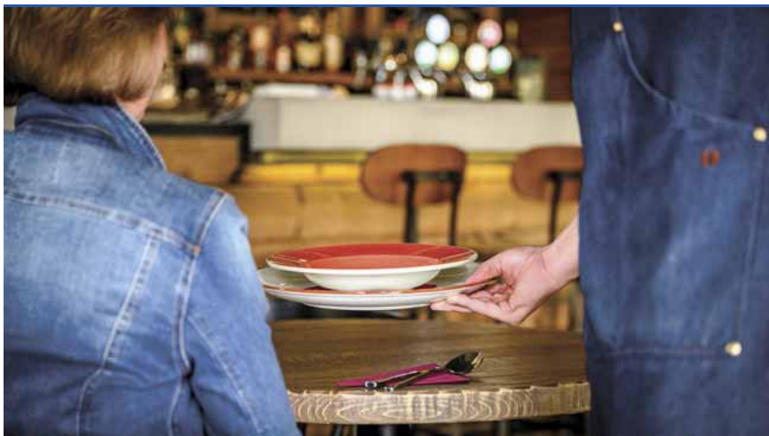
A teraszok után az éttermek belső helyiségei is megnyithattak

Hétfőtől újabb egészségügyi szolgáltatásokat lehet igénybe venni, ismét végezhető a tervezett műtétek, beavatkozások a krónikus és a kúraszerű ellátások területén, továbbá lehe-