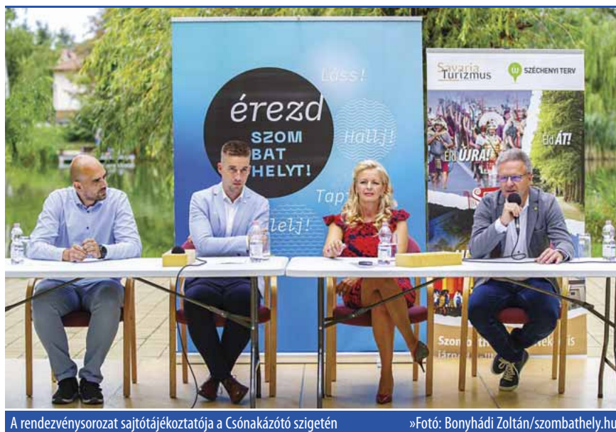
A rendezvénysorozat sajtótájékoztatója a Csónakázó szigetén