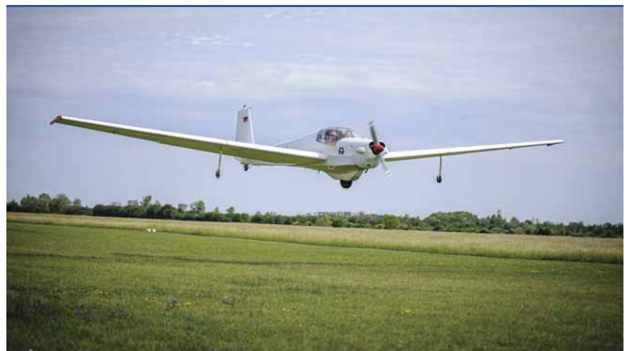
Felszállás a reptéren: magasak a repülés költségei

A belföldi légi járatok működtetése azonban nem volt gazdaságos, azzal az új szocialista közlekedési koncepció már nem is számolt. Az utolsó repülőgép 1967 decemberében szállt fel Szombathelyről. A 80-as évek elején tettek egy újraindítási kísérletet: a MÁLV egy 11 férőhelyes An-2-es gépet közlekedtetett a Szeged-Szombathely-Győr-Budapest útvonalon, de hamar rájöttek, hogy az üzemeltetése nem rentábilis, ezért leállították, s ezzel megszűnt a menetrend szerinti belföldi légi közlekedés.