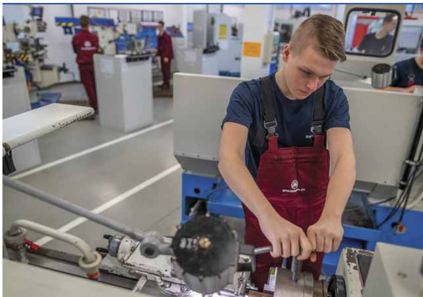
A Puskás Tivadar Szakképző Iskola kiemelt partnerintézménye a BPW-Hungáriának