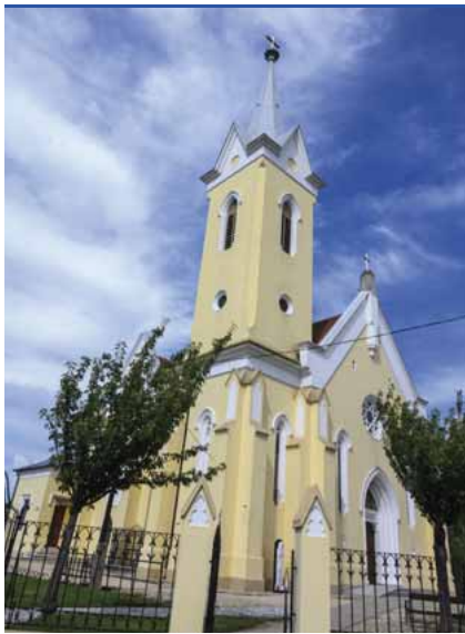
A szentkirályi templom

– Több generáción keresztül itt laktak az őseim. Abban a házban éltek már a dédszüleim, ahová én is születtem. A nagyszüleim építették újjá, ennek immár lassan száz éve. Ma is újítgatom, próbálom megőrizni, amíg élek, mert „lelke” van. Ez a fizikai, tárgyi része a kötődésemnek. Nyilván a lelki az kevésbé kézzelfogható. Emlékek, amik ide kötnek, amik alakítottak, formáltak... Gyerekkori barátok, felnőttek, akik körülvettek sok-sok szeretettel, hatottak rám, alakítottak olyanná, amilyen lettem. Megvan az a fa a szomszédban, amire rendszeresen felmászunk. Akkor nagyon nagyok tűnt. Szabadok voltunk, úgy, hogy mindenki vigyázott ránk. Emlékezetesek voltak a Szent István napi búcsúk és bálók. Felnőttkori életemhez