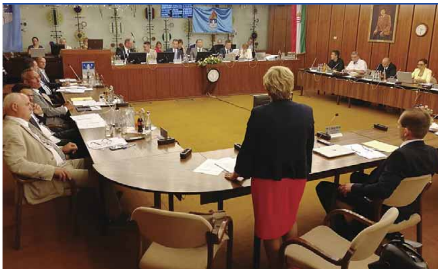
Hétfőn rendkívüli közgyűlést tartott a szombathelyi önkormányzat