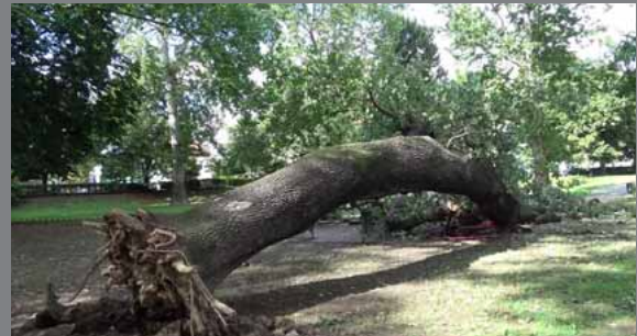
A Pelikán parkban a padokra dőlt egy fa