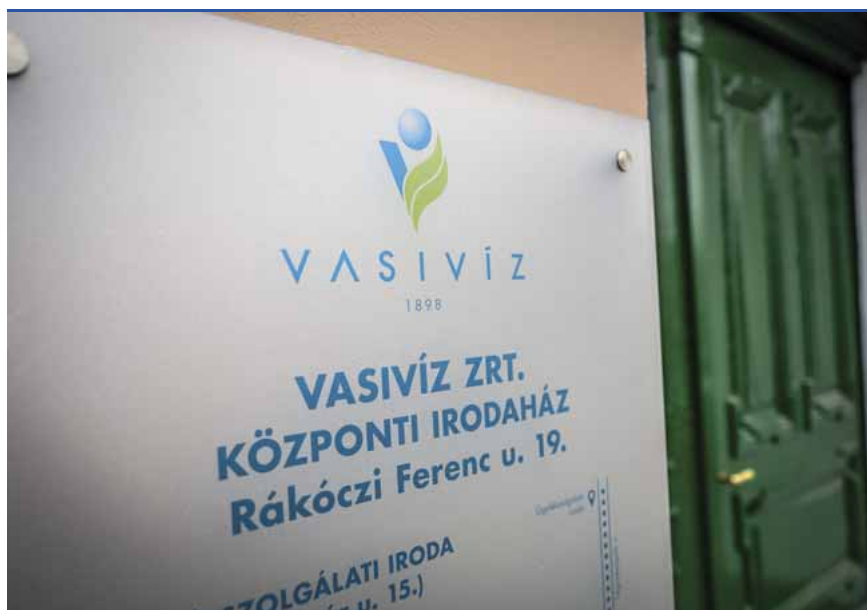
Cégtábla a Vasivíznél: központi kérdés lett a szakmai praxis

A Fidesz politikai okokból személyre szabott jogalkotást folytat most már önkormányzati szinten is. A VASIVÍZ ZRt. vezérigazgatójának visszahívására azért van szükség, mert a társaság közműszolgáltatói engedélyének visszavonásával fenyegették meg