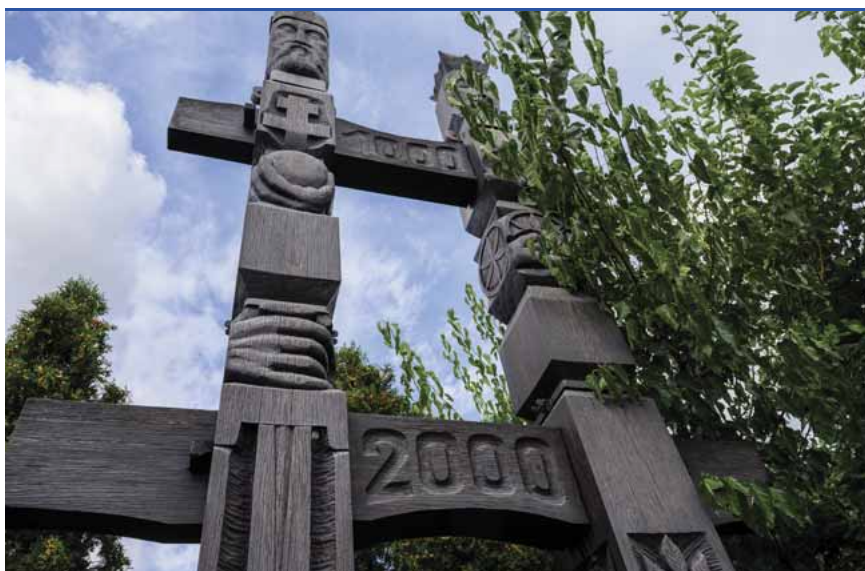
A kettős kopjafa a Szily-kastély kertjében

1787-88-ban Szily János (1735–1799), a Szombathelyi Egyházmegye első püspöke építtette, az osztrák származású Hefele Menyhért tervei alapján. A kastély nyári rezidenciájául szolgált. Immár több mint két évtizede legfőképpen itt végzi sokrétű tevékenységét a Gyöngyöshermán-Szentkirályi