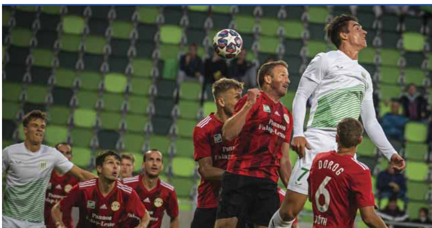
Haladás-helyzet a dorogi kapu előtt: pont nélkül maradt a házigazda