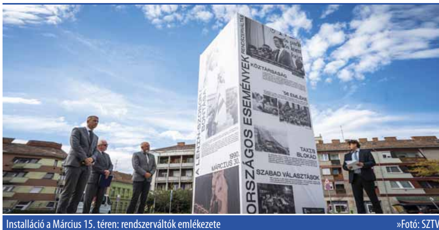
Installáció a Március 15. téren: rendszerváltók emlékezete

30 évvel ezelőtt vér nélküli forradalom ment végbe Magyarországon, megdőlt a Kádár-rendszer, megtartották az első szabad választást, és megalakultak az önkormányzatok. Szombathely is forrongott, a rendszerváltó erők a mai Sportház előtt álló Lenin-szobor letakarásával jelezték: változást akarnak. Több száz fős tömeg gyűlt össze a Fő téri tüntetésen. A „30 éve szabadon” Emlékbizottság támogatásával 18 városban állítanak emlékoszlopot, amely a békés forradalom fontos eseményeit idézi fel. Szom-