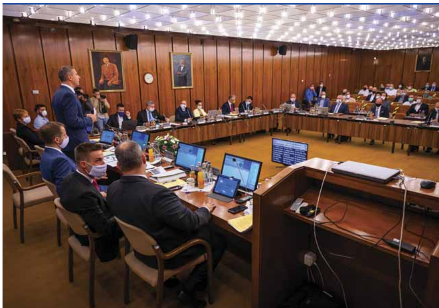
A költségvetés módosításáról is szavaztak a képviselők