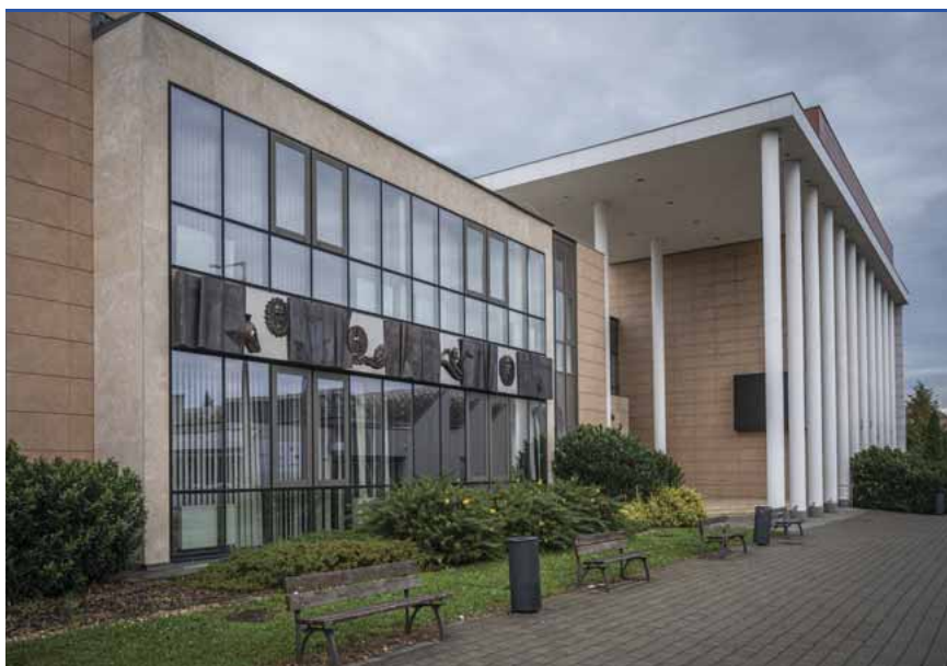
A Weöres Színház épülete: az igazgató személyére bizottság tesz javaslatot

tekinteni, amely a jelen lévő bizottsági tagok többségének támogató szavazatát megkapja.” A szakmai bizottság zárt ülésén nem dönt, „csupán” véleményezi, hogy melyik pályázat felel meg a szakmai minimumnak. Nyílt lesz maga a választás, igennel vagy nemmel lehet szavazni. (De akár mindkettő pályázatra lehet igent, vagy mindkettőre nemet mondani.) „A döntést a szakmai bizottság pályázonként elkészített összegző véleményével és a szavazás részletes eredményével együtt a helyben szokásos módon nyilvánosságra kell hozni.” „A munkakör betöltéséről – a szakmai bizottság véleményét is mérlegelve – a kinevezési jogkör gyakorlója a szakmai bizottság ülését követő harminc napon belül, önkormányzati fenntartó esetén a követ-