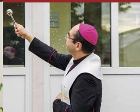
70 millió forintból újult meg Szombathelyi Egyházmegyei Karitás Hársfa háza