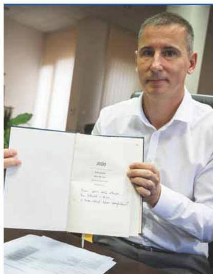
Dr. Nemény András polgármester »Fotó: Nagy Jácint

– Januárban már csapatot hirdettünk, még ha nem is véglegest, de a sok ember kiállása egy célért, az erős üzenetnek bizonyult. Amikor többségbe