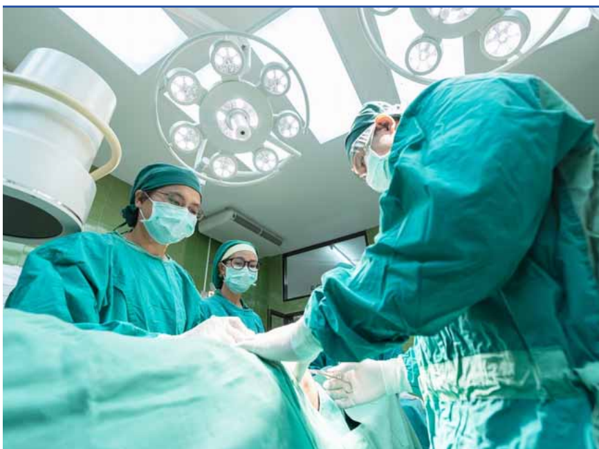
Orvosi beavatkozás: rendszerszintű reformra lenne szükség