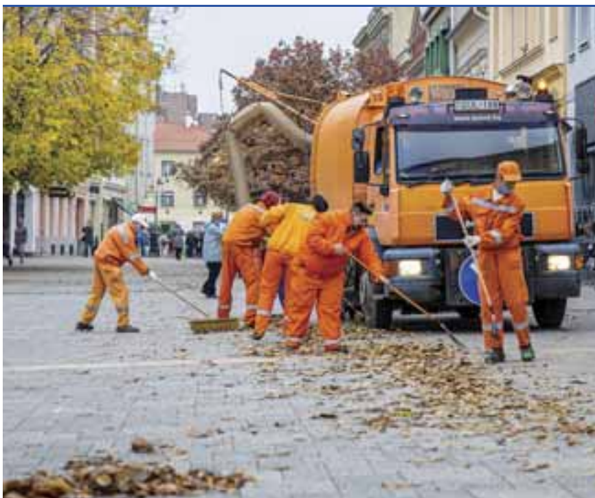
Folyamatosan tisztítják a közterületeket a városban

hete folyamatosan dolgoznak. A sajtótájékoztató napján a Fő téren kívül a Berzsenyi, a Szent Márton és a könyvtár előtti Antall József téren, valamint a Diófa utcában, valamint a Joskar-Ola és Derkovits-lakótelepen folyt a munka.