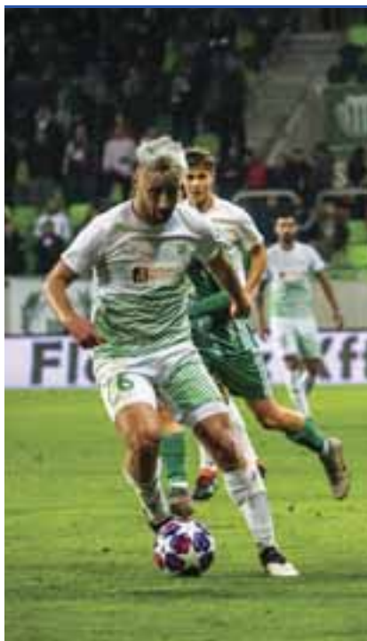
Hazai pályán nyert a Haladás

A csákvári vereség után mindenképpen a három pont megszerzése volt a célja a Mátyus-legénységnek a baranyai együttes ellen. A vasiaknál sérülések és eltiltás miatt alaposan fel kellett forgatni az alapcsapatot, a szakvezető végül a Verpecz – Holdampf, Mocsi, Németh Milán, Debreceni Z. – Kállai, Schusztar (Doktorics, a szünetben), Kiss B., Németh Mária (Tóth B., 71.) – Medgyes Z., Rác F. (Horváth O., 78.) összetételű alakulatnak szavazott bizalmat. A mérkőzés elején a hazaiak voltak aktívabbak, Medgyes révén a vezetést is megszerezte a Hali, amely a játékrész hajrájában Rác révén ismét beköszönt. A Szentlőrinc a mezőnyben méltó ellenfele volt a sok fiatal felálló szombathelyieknek, de a kapura semmiféle veszélyt nem jelentettek a piros-feketék. A félidő derekán aztán Tóth Barna fejjel volt eredményes, majd a hajrában Medgyes alakította ki a 4–0-ás végeredményt. Győzelmével a gárda megőrizte a 7. pozícióját az NB II-ben, Kissék legközelebb november 22-én a sereghajtó DEAC vendégeként lépnek pályára.