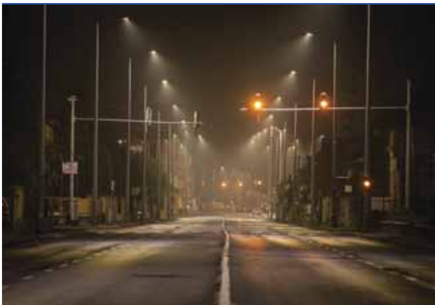
A Hunyadi út kijárási tilalom idején

Az éttermek vendéget nem fogadhatnak, a betérőknek csak az étel elvitele céljából lehet ott tartózkodniuk. A házhoz szállítás adminisztratív terheit a kormány csökkenti. Az üzemi étkezdék nyitva tarthatnak. A magyarázó részből kiderül, hogy a vendéglátó helyekre egységesen vonatkozik az alábbi szabályozás. Az üzletek