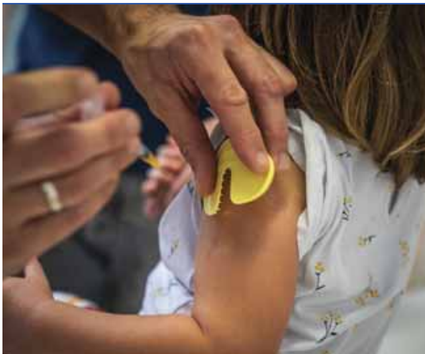
Az oltást már most megkaphatják a gyerekek