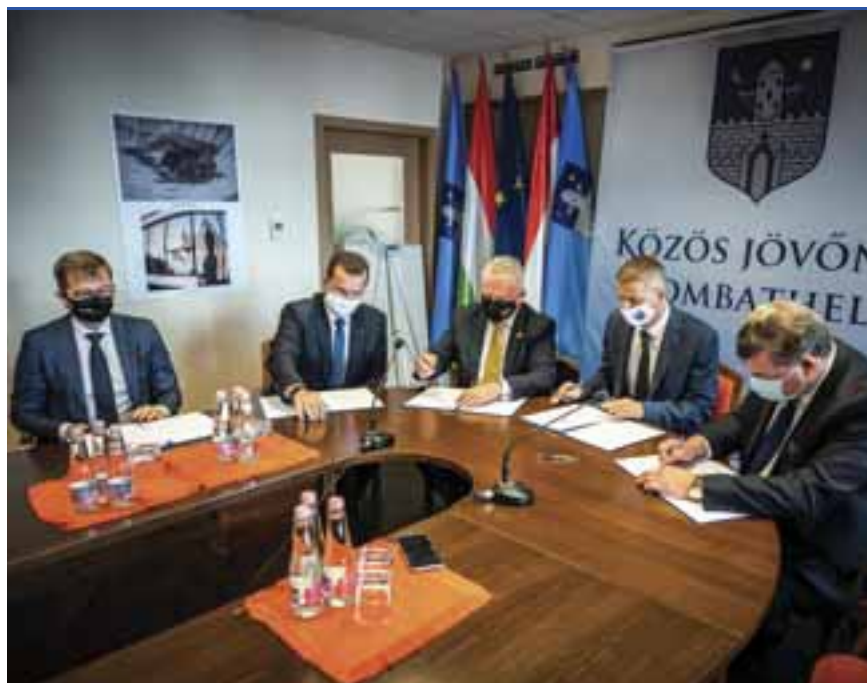
Megállapodást írtak alá a felek a mérnökképzésről