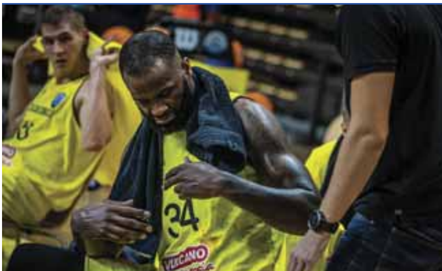
Falco-kispad: halasztás halasztás hátán

A szombathelyiek múlt héten szombaton vasi klasszikust játszottak volna Kőrmenden, a Rába-partiak azonban jelezték, hogy egy játékosuk pozitív tesztet produkált, így karanténba került az egész csapat. A Falco nem tétlenkedett, rögtön egyeztetett a ZTE-vel és az MKOSZ képviselőivel is, és abban egyeztek meg, hogy