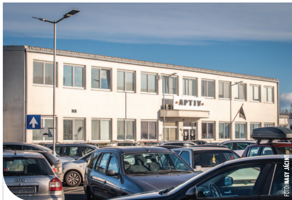
Az Aptiv Zanati úti egysége

„Sajnálattal értesültünk a városunk egyik legnagyobb vállalatának adóoptimalizáló terveiről, melyek kormányzati jóváhagyás esetén a jelenlegi gazdasági helyzetben még kilátástalanabb helyzetbe hozzák önkormányzatunkat. A pandémia és a kormányzati intézkedések egyaránt jelentős mértékben sújtják városunkat, melyeken felül az Aptiv folyamatban lévő változtatása a helyi iparüzési adó befizetésének mértékét érintően szinte kezelhetetlen – előzetes becsléseink alapján mintegy 1.5 milliárd Ft – kiesést eredményezne a költségvetésünkben. A vállalat által elképzelt adó-optimalizáció kapcsán a Pénzügyminisztériumtól kell engedélyt kérniük, melynek