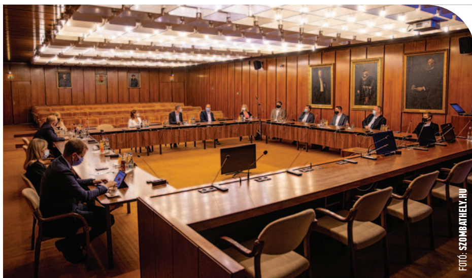
A szombathelyi önkormányzat szeptemberi egyeztetése cégvezetőkkel