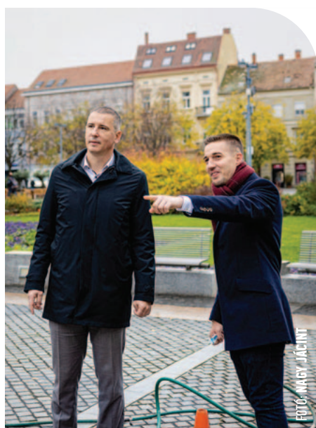
FOTÓ: MAGY JÁCINT

© A Fő teret is megtisztították a SZOVA és a SZOMPARK dolgozói