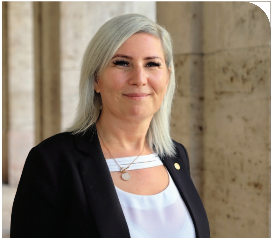
© Lenkai Nóra, az ELTE-SEK rektori biztosa