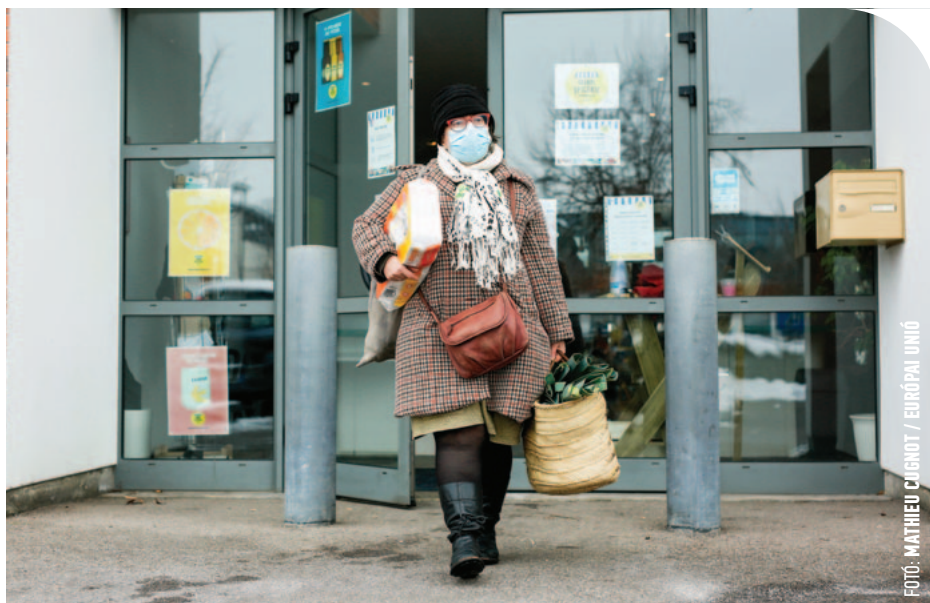
☉ Maszkos bevásárlás. Európában is tombol a negyedik hullám

A múlt hónapban az Európai Parlament elfogadott egy jogilag nem kötelező határozatot, amelyben az EU és Tajvan közötti politikai kapcsolatok erősítése mellett szállt síkra,