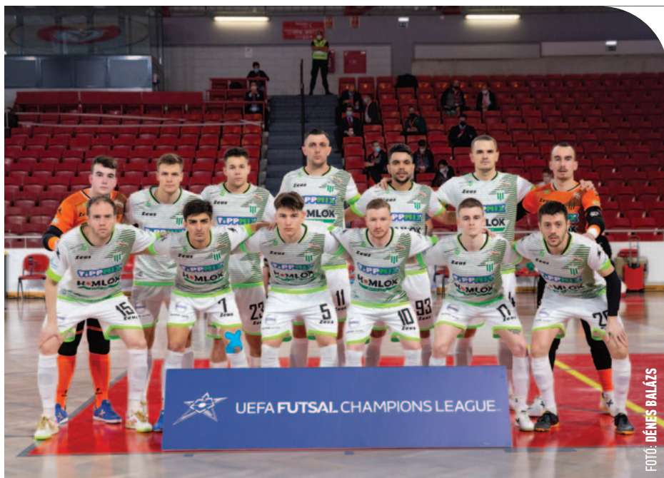
☉ A zöld-fehérek egyik legfontosabb fegyvere a csapategység

– Nagyon komoly játékerőt képviselő csapattal tudtunk megmérkőzni, és ebből lehet