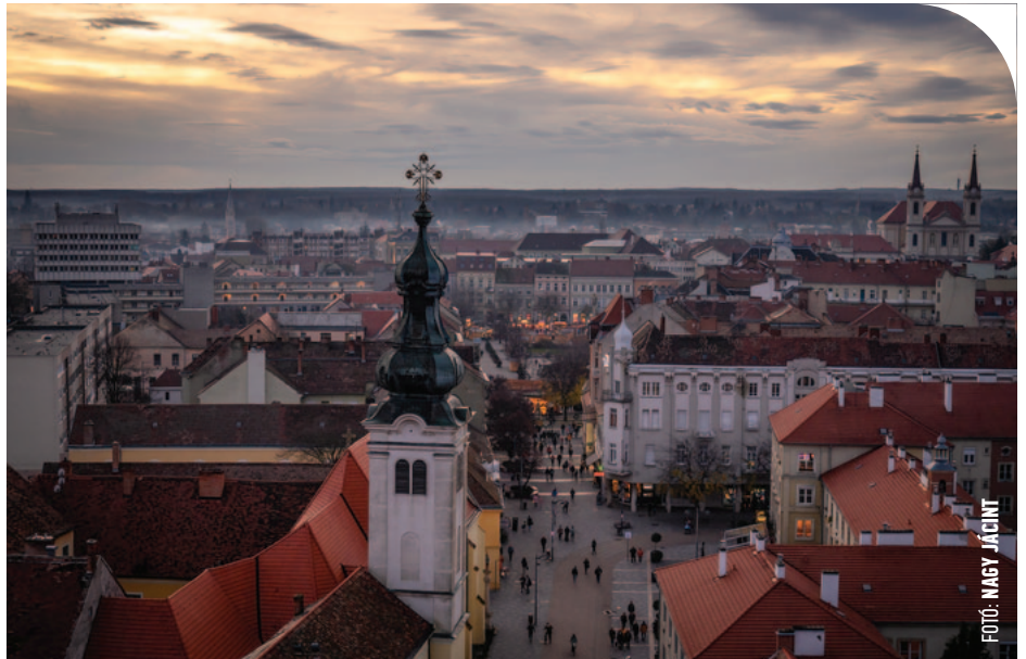
☉ Szombathelyi látkép: nem akar kimaradni a város a kompenzációból

Nem csoda, hogy ezúttal egységes elbírálást szeretnének a városok, ezért is döntöttek úgy,