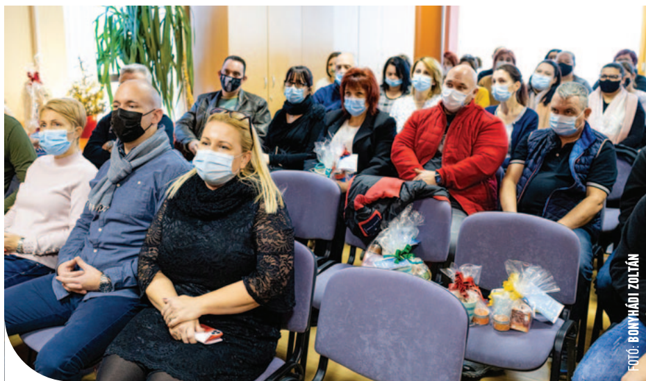
Elismerték a hajléktalanellátásban dolgozók munkáját

– A hajléktalanok ellátásával foglalkozó szociális dolgozók az egyik legnehezebb, mégis az egyik legkevesébé elismert munkát végzik – mondta el lapunknak dr. Czeglédy Csaba –, ezért tartottuk