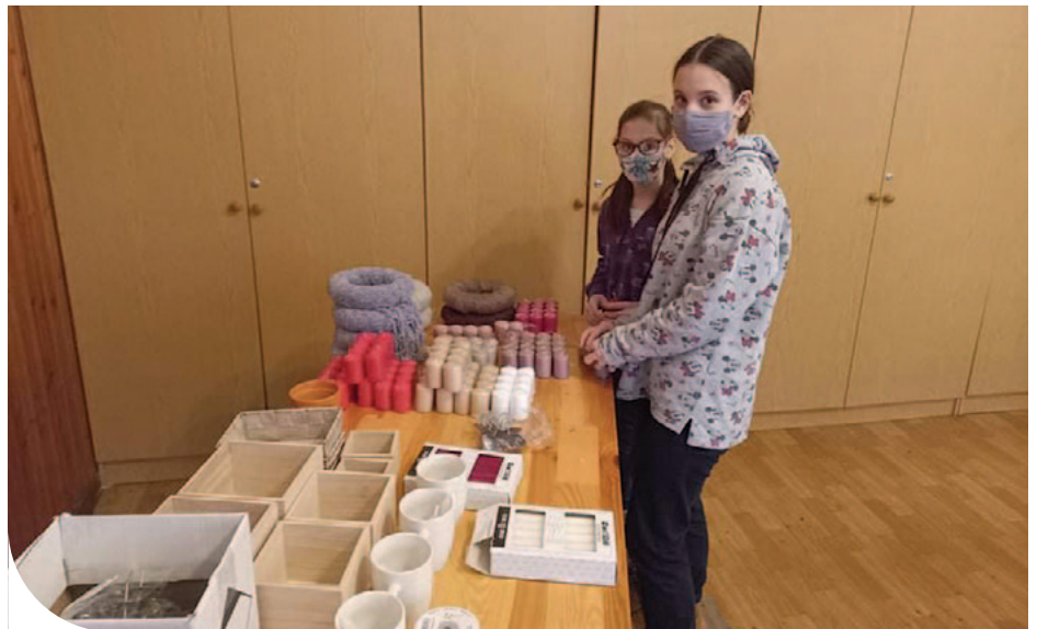
© A bütyköldében a gyermekek készítettek díszeket