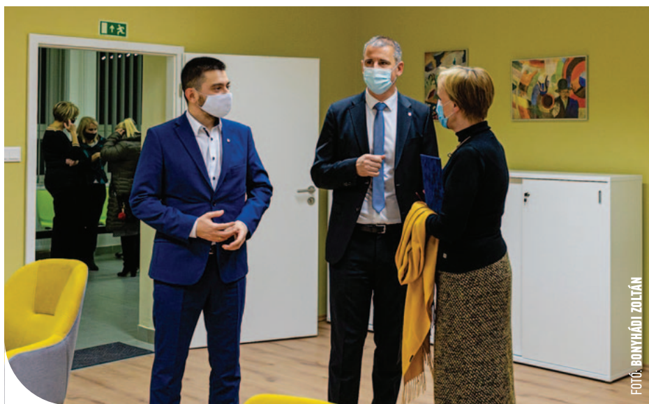
A múlt héten adták át az új közösségi teret