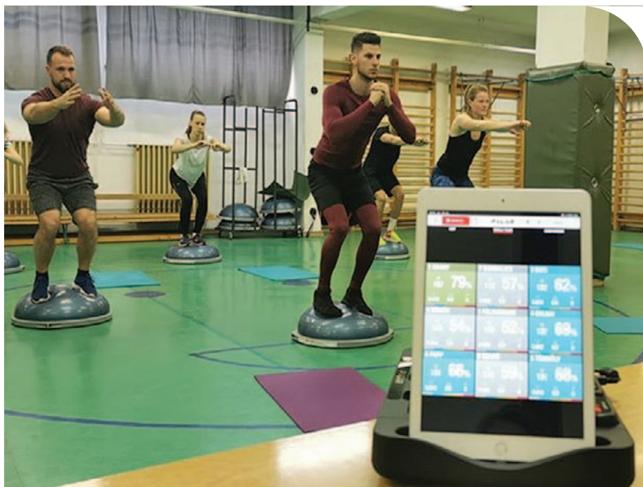
© Méréssel kísért fitnessóra a Sporttudomány Intézetben

Jövőre átalakul a tanárképzés. A hallgatók már nemcsak az utolsó félévben kerülnek iskolai környezetbe, hanem az első szemesztertől kezdve folyamatosan végeznek gyakorlatot. A testnevelés szakosok egyébként már most is gyakorlatorientáltan tanulnak: a testnevelésórákon teljesített gyakorlatokon kívül részt vesznek tömegsport-foglalkozások, szakkörök, diákolimpiai versenyfordulók szervezésében és lebonyolításában, a csapatok kísérésében. Mindez 2022 szeptemberétől csak fokozódik. Fontos változás az is, hogy már nem az érettségi pontokat veszik figyelembe a bejutásnál, hanem a jelentkezőknek gyakorlati felvételi vizsgát kell tenniük. A gyógytestnevelő-egészségfejlesztő tanár szak csak testnevelő tanári