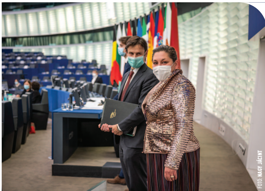
© Járóka Livia az az Európai Parlamentben

Járóka Livia szerint legalább pozitívum, hogy Magyarországon az utóbbi évtizedben drasztikusan lecsökkent a rendőri, sőt, bármilyen más csoportok által a kisebbségek felé irányuló atrocitások száma. Példaként hozta fel, hogy a magyar viszonyokat nemrég a mérvadó Fundamental Rights Agency is kifejezetten