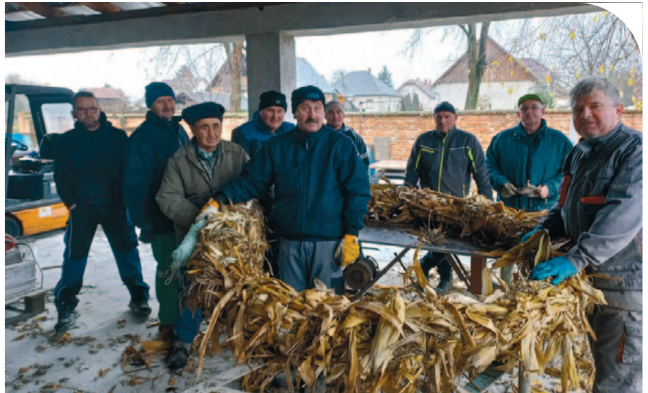
© Fiatalok és idősek egyaránt kivették a részüket a munkából

– Ami a legfontosabb, sikerült megajándékoznunk ezúttal is a kicsiket, azaz elérkezett a múlt vasárnap hozzánk is a Mikulás, ezzel nagy örömet okozva a gyermekeknek. Ha a megszokottól eltérő formában is tartottuk meg az ünnepséget, de így is kellemes emlékekkel gazdagodtunk valamennyien – mondta a polgármester.