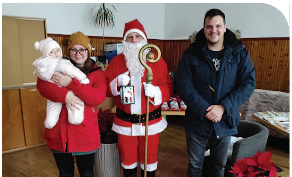
© A Mikulás a múlt vasárnap érkezett meg Balogunyomba