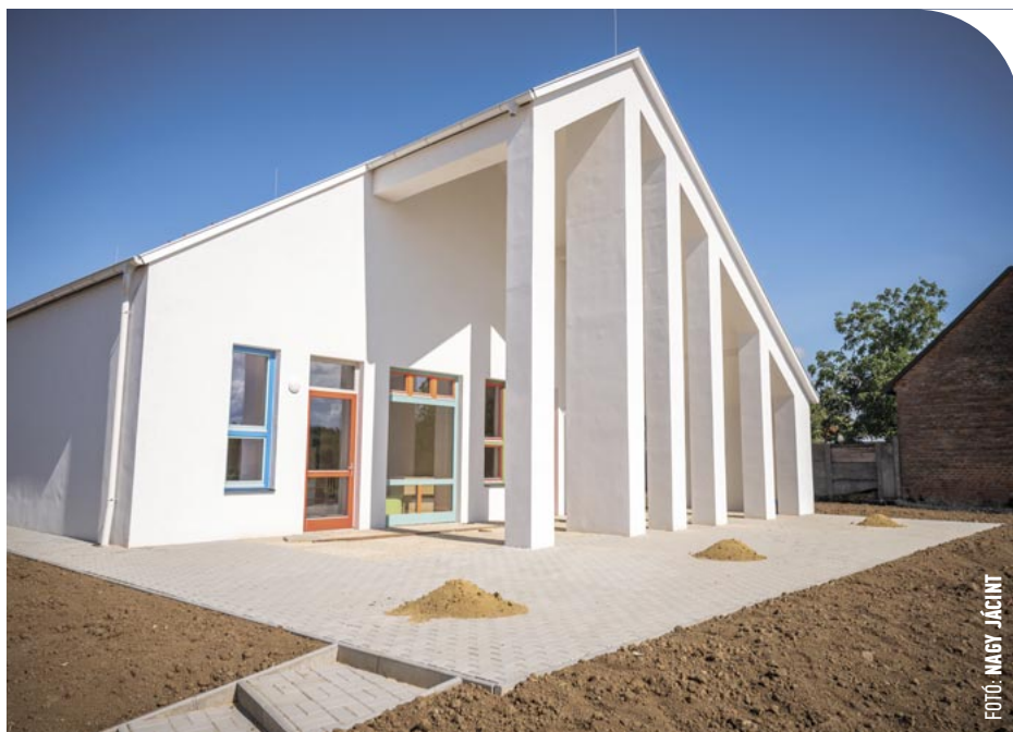
Az elmúlt év a bölcsődei beruházás éve volt, augusztus végére elkészült az új épület