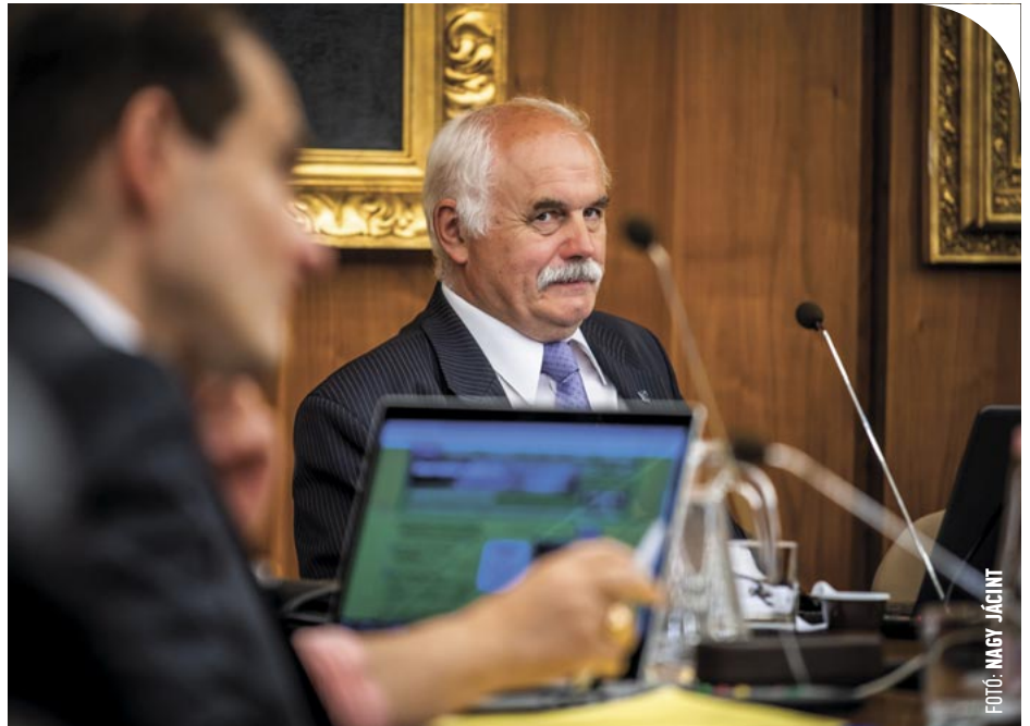
© Ágh Ernő képviselő (Fidesz-KDNP) volt a Fogadóóra vendége

A nagy 2020-2021-es városi kerékpáros-fejlesztési dömping keretein belül Ágh Ernő körzete is két újabb bicikliúttal gazdagodhatott. A politikus méltatta, hogy a Király Sportcentrumtól a Ferenczy utcáig a kerékpárút mellett gyalogjárda, csapadékvíz-elvezetés, sőt, közvilágítás is kiépítésre került, viszont maradt hiányérzete, miután a Náriai Külső úton csak biciklis nyomvonalat festettek fel, és csak toldoztak-foltoztak az útszakasz leromlott részein. Mint elmondta, erősen biztatja