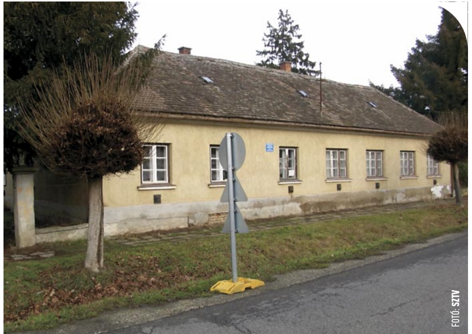
© A régi épületek helyén épülne az új bölcsőde

A decemberi közgyűlés döntése nyomán a helyreállítási terv keretében pályázatot nyújtott be az önkormányzat bölcsődeépítésre. Az 550 m 2 -es, energiahatékony épülethez tágas udvar, terasz és parkoló tartozna. Három csoportszobát, fürdőket, öltözőket, tálalókonyhát, irodát