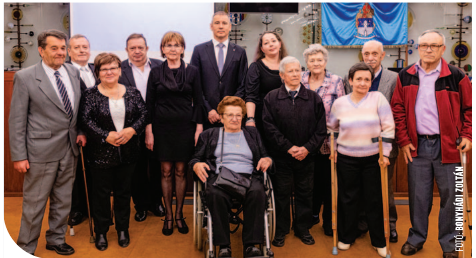
Jubileumi ünnepséget tartottak a városházán