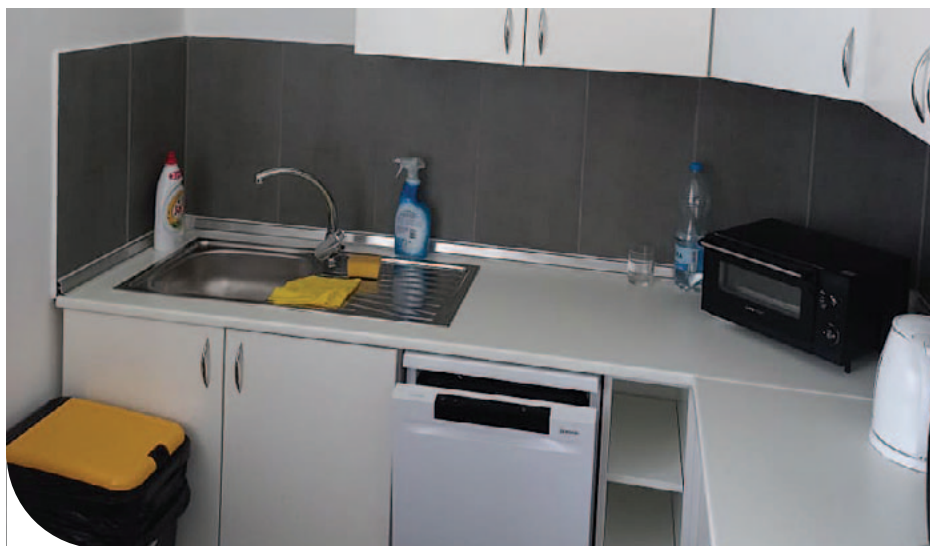
© A felújítás után nagyon otthonos lett a hivatal

– Az idén álltunk neki a hivatal teljes belső felújításának. A beruházás mintegy 50 millió forintos pályázati támogatásból valósulhatott meg. Míg folyt a munka, addig az ügyintézés a művelődési házban történt, ott volt az átmeneti otthonunk. A választások idejére vissza kellett költöznünk, ugyanis itt volt az egyik szavazókör. Végül március 28-án már berendezkedhettünk az épületbe, amely valóban csodás, modern és igazán otthonos lett. Napkollektorok kerültek a tetőre, klímák az irodákba, szinte minden új, ami most a házban található. Kiemelném a konyhát, amely teljes felszereltségű, de mindenhol új a burkolat és a parketta is. Kollégáim nevében mondhatom, hogy a kivitelező remek