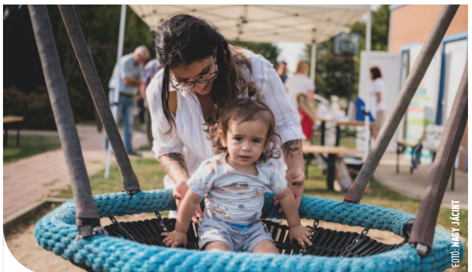
© Az idén is sok játék vár a kicsikre a gyermeknapon

– Dozmaton az idei évben megalakult a Dozmati Hagyomány- és Értéktörző Egyesület, melynek legfőbb célja a helyi hagyományok ápolása és a község kulturális életének fejlesztése mellett összefogni Dozmat Község Önkormányzatával, az Együtt Dozmatért Egyesülettel és más, helyi civil szervezetekkel, művészeti csoportokkal. Az új egyesület első alkalommal, hagyományteremtő céllal a község májusfáját állítja fel április 30-án. A májusfa kitáncolására a Pünkösdi hétvégén kerülne sor. Dozmat másik civil szervezete, az Együtt Dozmatért Egyesület a Családok erdeje környezetének rendbetételére, illetve a Csodaszarvas Tanösvény új jelölő tábláinak elhelyezésére hirdeti meg családi piknikkel egybekötött programját. Az erdei „munkálatok” mellett a gyerekek sem unatkoznak majd,