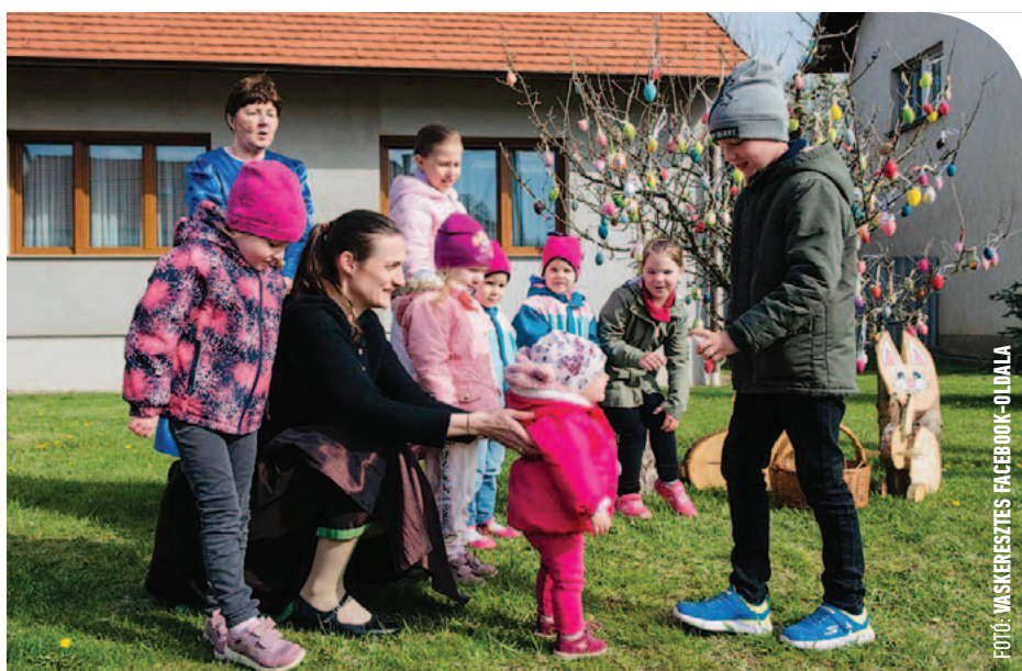
© A gyerekek díszítették fel a tojásfát

– Csodálatosan szép ajtókopogatók és asztali díszek készültek, a gyermekek pedig a falu tojásfájára alkották meg díszes tojásaikat, melyeket nagyszombaton közösen aggattunk fel a fára. Nagycsütörtök este a „harangok Rómába mentek”. A nagyszombati feltámadási szertartásig az imára hívás harangok helyett kereplőkkel történt. Napi 3 alkalommal a 12 főből álló lelkes csapat járta a falu utcáit, és ezzel vettek részt az egyházi értékmegőrzésben. Öröm látni, ahogy a fiatalabb generáció számára átörökítődnek hagyományaink. Húsvét vasárnap az idei évben első alkalommal rendezte meg az Alpesi Fogadó és Borház a húsvéti locsoló bált, ahová a környező településekről rengeteg fiatal érkezett és mulatott együtt. Elsőként a gyermekek locsolták