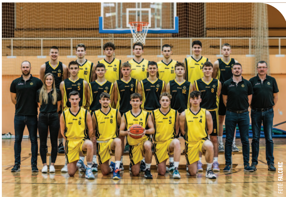
© A Kaposvár elleni sikerrel vívták ki a bronzérmeket a sárga-feketék

– A nyolcas döntő egy új fejezete volt a bajnokságnak. A Pécs és a Honvéd két nemzeti akadémia, akikről tudtuk, hogy komoly játékerőt képviselnek, és ezt igazolták is. Kulcsmomentum