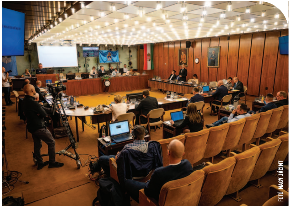
☉ Közgyűlési pillanatkép: több napirendet tárgyaltak a képviselők