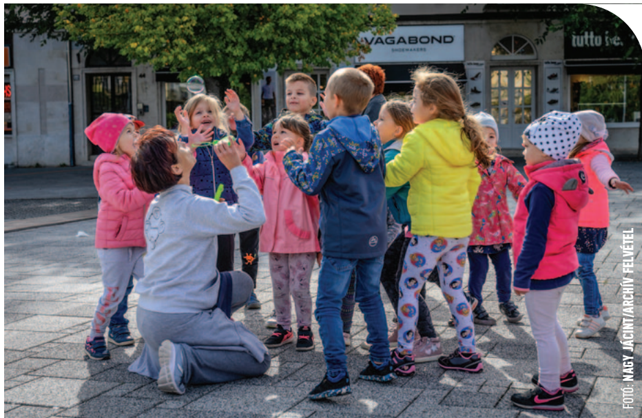
☉ Számos programot kínál a Városi Gyermeknap Forgatag az AGORA Sportháznál

– Minden évben fontosnak tartjuk, hogy olyan programokat találjunk ki, amely során a gyerekek a szülőkkel együtt játszhatnak, kapcsolódhatnak ki – folytatta az igazgató. – Így nemcsak előadásokat szervezünk, hanem rengeteg kísérőprogramot is. A téren népi játékok várják a gyerekeket, lesz körhinta, hintalóverseny, labdaelkapó játék, diótörő, rönkjáró, százlábú és ehhez hasonló kihívások. Ezek a játékok nagyméretűek, vannak, amiket