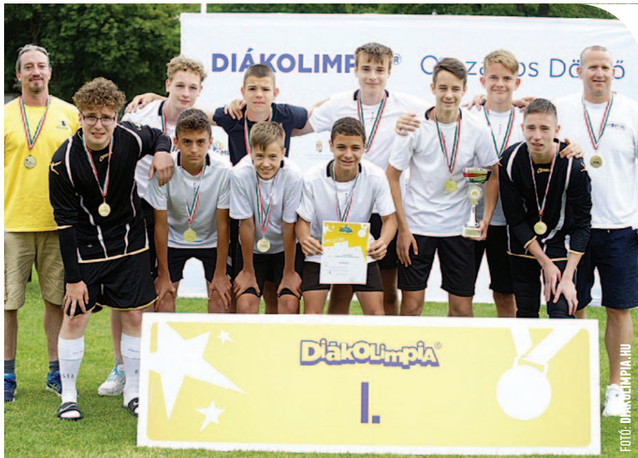
A Paragvári győztes csapata

A IV. korcsoportban a fiúknál a Paragvári Iskola csapata indult megyei bajnokként, a csoportkörben valamennyi ellenfelüket elgázolták (Érsekivadkerti Petőfi Sándor Általános Iskola 6-0, Sugovica Sportiskolai Általános Iskola 4-0, Németh László Gimnázium 8-1, Lövői Általános Iskola 4-0).