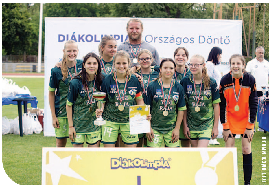
A Neumann Iskola lányai is aranyérmesek lettek

A lányokhoz hasonlóan vasárnap következett a rájátszás, itt két sima meccs vezetett a döntőig: Szent Márton Katolikus Gimnázium és Általános Iskola 8-1, Szentesi Klauzál Gábor Általános Iskola 7-0. A szombathelyiek így az aranyéremért a Sugovica Sportiskolai Általános Iskola csapatával játszottak, és 3-0-s győzelmet aratva szereztek meg az első helyet.