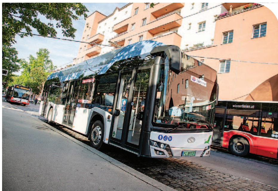
☉ Hidrogénnel hajtott busz Bécsben

Az osztrák főváros terve, hogy az amúgy is környezetbarát Euro-6-os buszok mellett, 2027-re összesen 82 elektromos és hidrogénhajtású jármű fusson majd az útjain. Az alternatív hajtású buszflotta és a hozzá szükséges infrastruktúra kiépítésére a Wiener Linien összesen 90 millió eurót fordít.