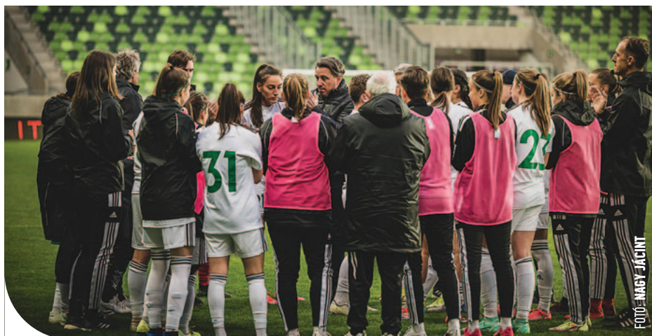
© A szombathelyiek legutóbb 2017-ben végeztek dobogós helyen a bajnokságban

A Simple Női Liga alapszakaszának utolsó fordulójában idegenbeli mérkőzés várt a Haladás-Viktóriára, méghozzá a Puskás Akadémia vendégeként. A zöld-fehérek számára remekül indult a találkozó, Nagy Vanessza révén már a 4. percben megszerezték a vezetést, a hazaiak