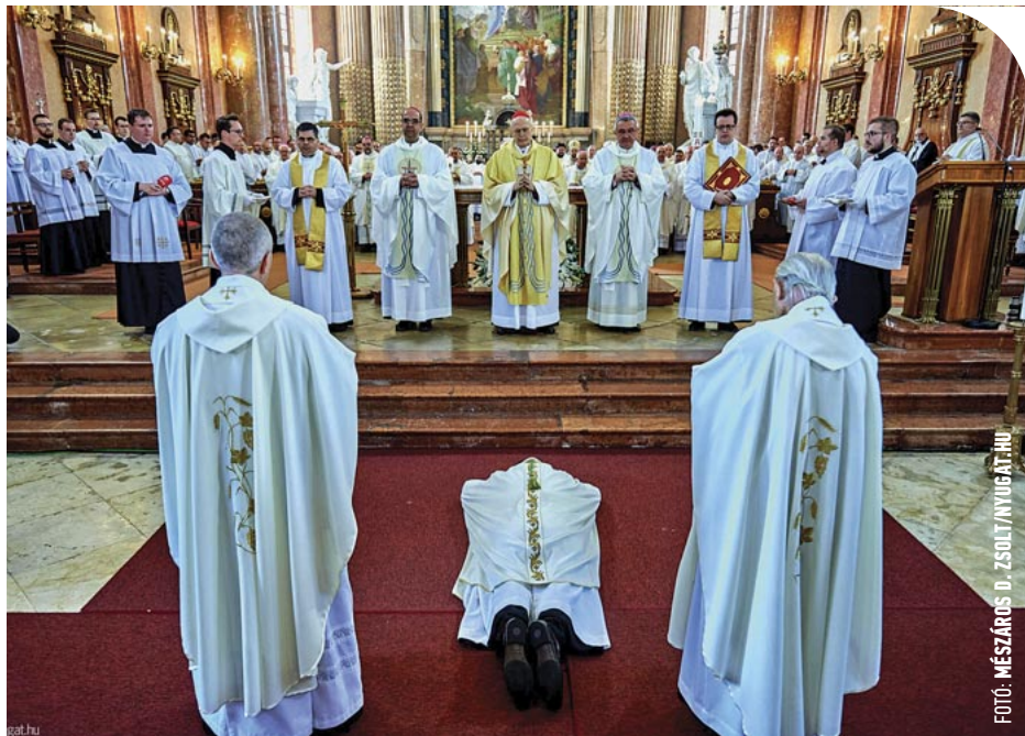
© Fekete Szabolcs Benedek püspökké szentelése

– Az egy isteni élmény volt. Gyökeresen megváltozott az életem. Elkezdtem naponta szentmisére járni. Addig nem szerettem, unalmasnak tartottam. Kezdtém odafigyelni arra, mi hangzik el. Mit prédikál a pap. Mit olvasnak föl. Mit éneklünk. Megtanultam az összes –