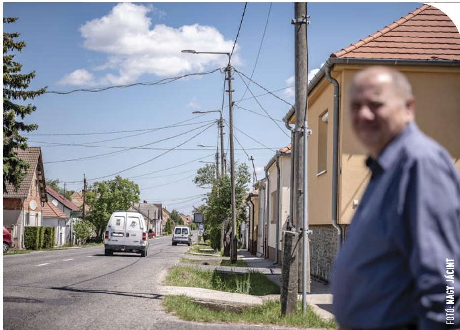
☉ A régi településrészben léghálókábelre érkezik a szolgáltatás

– Az új utcákban azonban földkábelrel építenek – mondta el a képviselő –, itt az öröm mellett egy kis kellemetlenséget is el kell viselniük a lakóknak. Az Áfonya, az Eper, a Fenyő, a Korpás és a Bogánccs utcában a járda mellett 30 centi széles és 60 centi mély árokban kell a vezetékhez a csöveket letenni. Gyakorlatilag