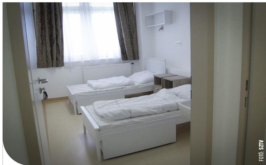
Bútorokat adományozott a Zseboroszlán Alapítvány