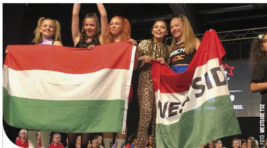
☉ Sikeres versenyt zártak a Westside táncosai

Az egyesület tagjai nagyon jól szerepeltek a versenyen, többen felállhattak a dobogóra is. Voltak, akik világbajnokként tértek haza, ezüst- és bronzérmeket is ünnepelhettek, emellett több értékes helyezést is elértek.