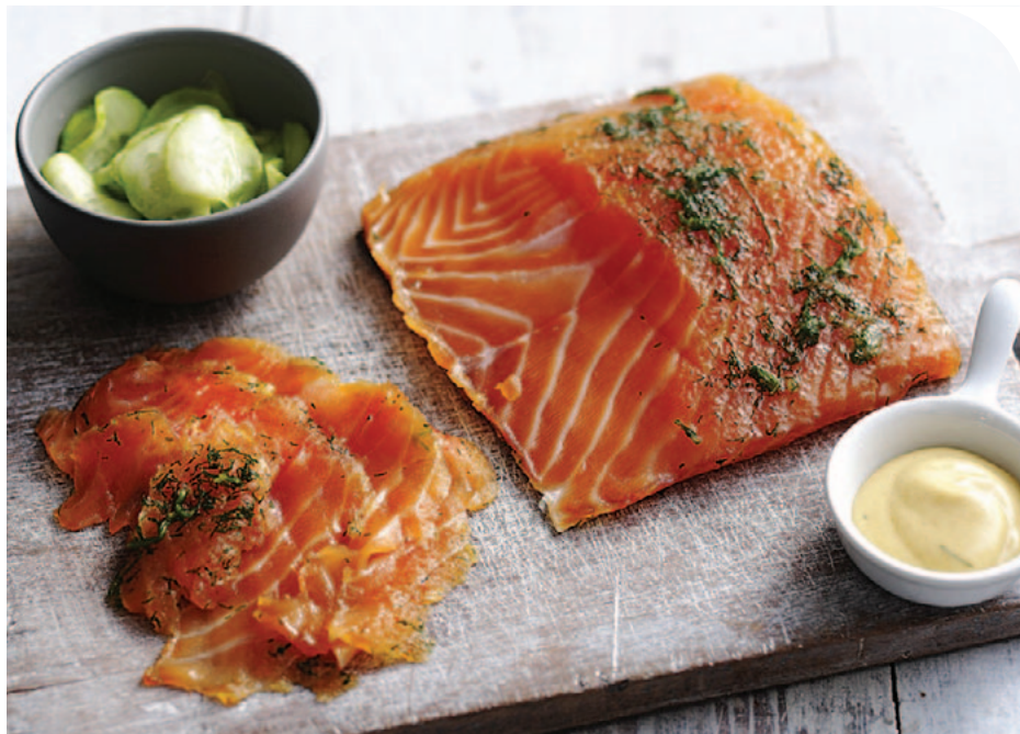
A pácolt lazac avagy gravad lax kedvelt finn halétel