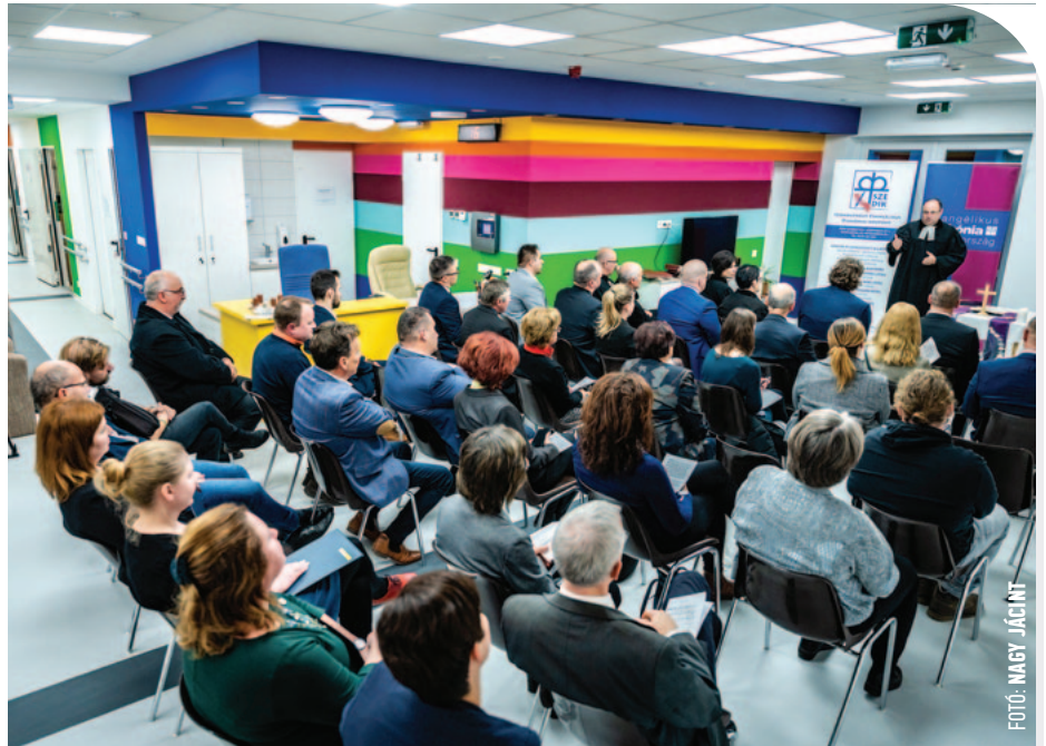
☉ Beszámoló a Diakóniai Központ bővítéséről

A beruházáshoz 550 millió forintot adott az önkormányzat, ennek fedezetét a Kolozsvár utcai sporttelep eladása biztosította. (A Falco Zrt. vásárolta meg a területet, de ipari tevékenységet nem végez rajta, hanem környezetvédelmi céllal hasznosítja: zajvédő sánc