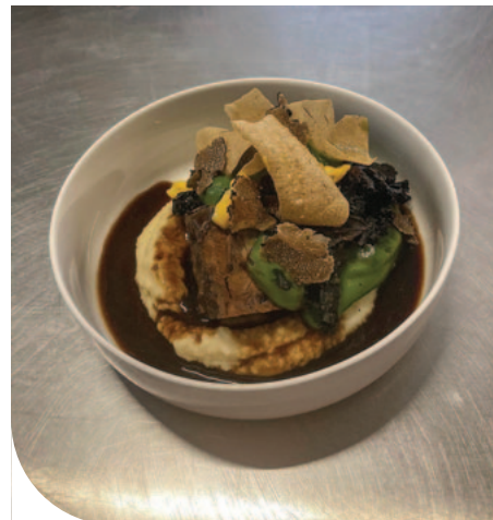
☉ Egy különleges fogás

A köret elkészítéséhez a burgonyát hámozzuk meg, főzzük puhára, törjük át, és ízesítjük sóval, szarvasgombaporral. Ezután adjuk hozzá a meleg tejet, majd habverővel keverjük bele a hideg, kis kockákra vágott vajat. Ízlésesen tálaljuk, a tetejére friss szarvasgombát reszeljük. (A barna alapléhez mindent, a zöldségeket és a húsokat vagy csontokat is meg kell kicsit pirítani, karamellizálni, és így