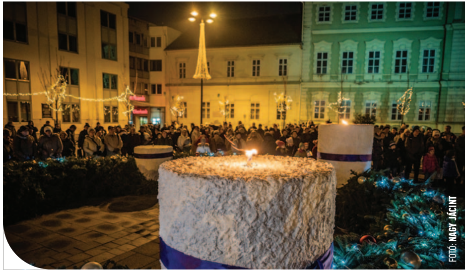
A második gyertya is fellobbant a város adventi koszorúján