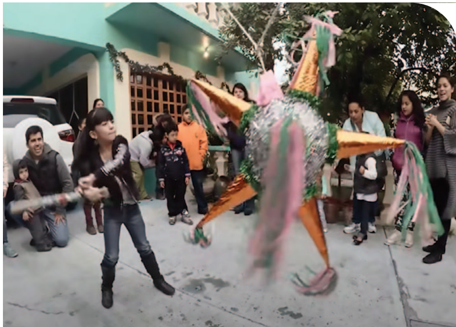
© A talányos nevű piñata ajándékokat rejt

Édességnek gesztenyés bejglit szoktam vinni magunkkal, és a férjem egy polvorones nevű édességet készít, ami pirított mandulával, cukorral és liszttel készül. Ez tipikus spanyol édesség, de itt is árulják, mert összekötődött a két ország hagyománya.