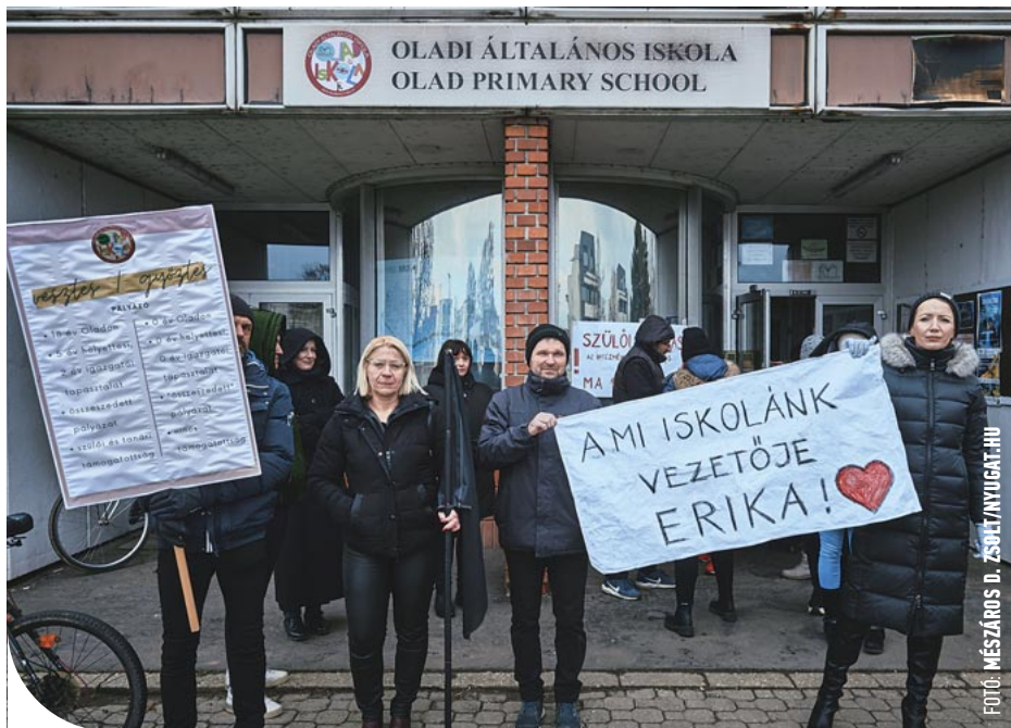
Tiltakozó szülők az iskola előtt