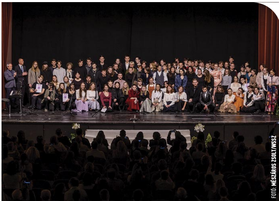
© Hét színjátszócsoporthoz vitte színre a jeleneteket

– Mindig találunk egy-egy témát, amire felfűzzük az előadást, és a témák egyes jeleneteit kiválasztják a középiskolások, hogy melyiket szeretnék, és akkor azon elkezdnek dolgozni – mondta el a munkafolyamatról Németh Gyöngyi drámapedagógus a Szombathelyi Televízióan. A diákszínjátszó fiatalok által megelevenedett jelenetek színre vitték Petőfi Sándor és Szendrey Júlia szerelmének főbb állomásait (az 1846-os nagykirályi báltól kezdve, ahol megismerkedtek), és megkerülhetetlenül szóltak a szabadságharc árnyékában szövdő szerelmi történetről elválaszthatatlan kérdésekről: mit jelent a szabadság, mire való a forradalom, és hogyan illeszkedik mindehhez a szerelem – azaz, mit jelképez Petőfi, 200 évvel a születése után, egy mai tizenévesnek. A diákszínjátszók bátran nyúltak a Petőfi-kultuszhoz, s olyan sokszínűen, amilyen maga az ifjúság: a romantika és a fennkölt érzelmek mellett a humor, az önironia és improvizáció jellemezte a jeleneteket, az ünnepben ott voltak a hétköznapiak, s a hétköznapiakban az ünnep.