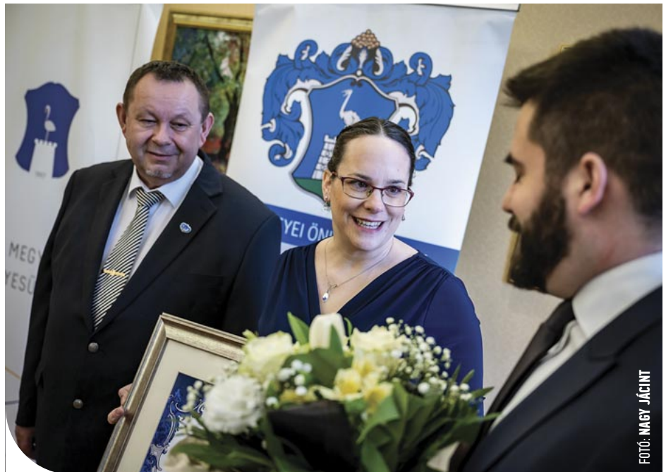
© Dr. Györke Eszter gyermek-onkohaematológus a díjátadón

– Sosem tudom levétközni anyai mivoltomat. A gyerekek ellátása során és a nehéz diag-