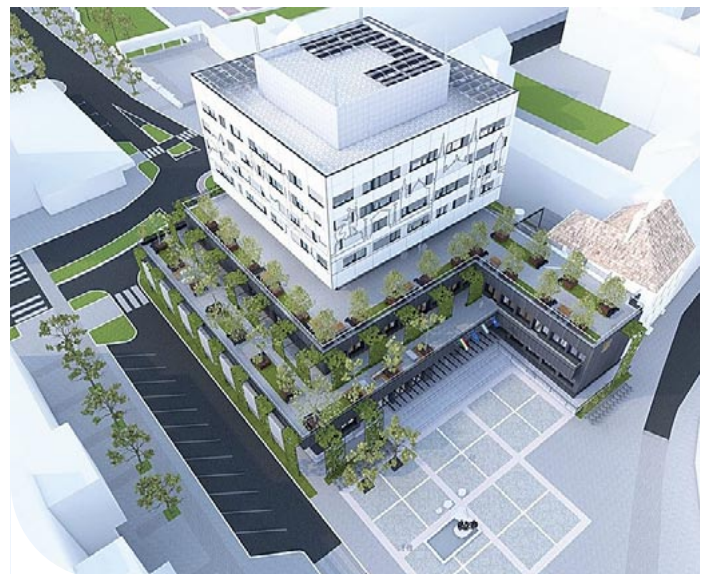
☉ 2017-es látványterv a felújításról