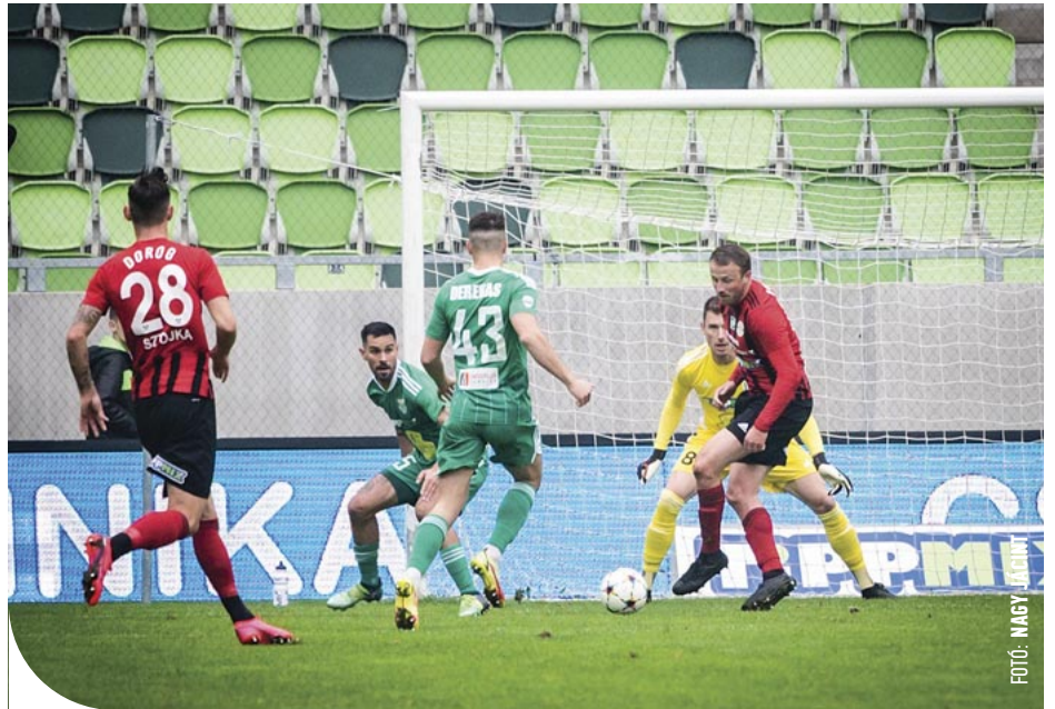
© Derekas góljával még a Haladás szerezte meg a vezetést

A 62. percben a semmiből szépített a Balaton-parti együttes: Szakály baloldali szöglete után Debrecen csúsztotta a labdát a bal alsó sarokba (2-1). A gól megfogta a vasi együttest – a 68. percben Polényi kis híján egyenlített,