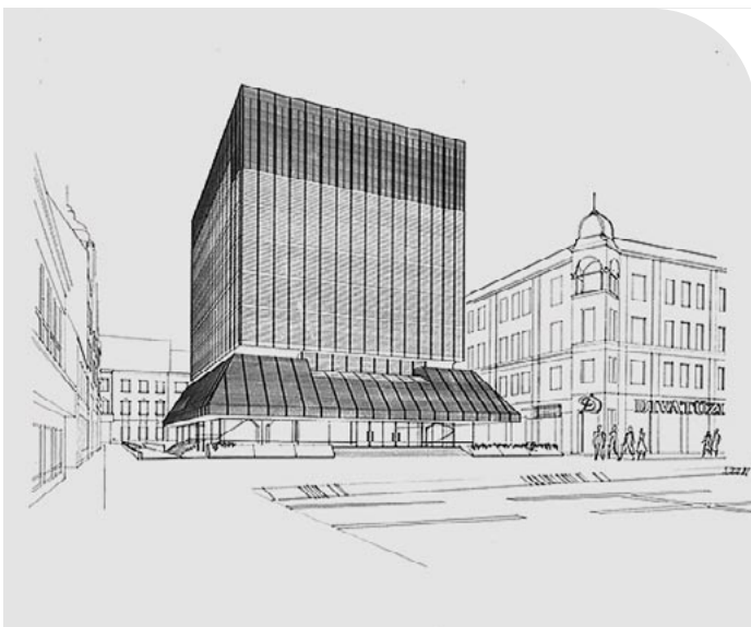
☉ Volt olyan terv, ami a Fő térre helyezte volna az épületet

– A Városháza legnagyobb értéke számomra egyrészt az a szellemi tőke, amit a hivatalban dolgozó 280 fő munkatársam szakmai tudása jelent, másrészt pedig az az összetartó, közösségi szellem, ami jellemzi ezt a kollektívát. A járványügyi veszélyhelyzet idején is bizonyított, és most az energia-veszélyhelyzetben is kiválóan helytáll ez a csapat, amellet, hogy