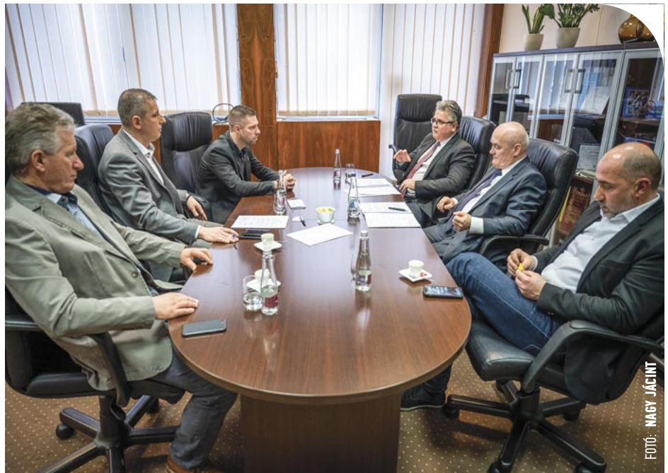
☉ Egyeztetés a volt strand ügyében 2022-ben: Dankó István jobbról a harmadik

Dankó azért indított pert Nemény ellen, mert szerinte a polgármester azt a valótlan tény híresztelte, hogy a volt államtitkár saját magának, cégének egy komoly közbeszerzést intézett, ezzel pedig megsértette a jó hírnévhez fűződő személyiségi jogát. Az első fokon eljáró Szombathelyi Törvényszék, majd a másodfokon a Győri Ítéltábla is úgy látta, Dankó Istvánnak van igaza, kimondták Nemény András felelősségét, mivel a volt államtitkár saját céggel nem rendelkezett, kizárólag vezető tisztségviselője volt a gazdasági társaságnak. A polgármesternek másodfokon a perköltség mellett Dankó István részére sérelemdíjként járó 100 ezer forintot és annak kamatait is ki