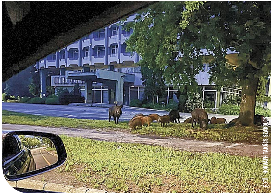
© Vaddisznókonda a Claudius előtt: alkalmazkodó, intelligens állatok

A szakirodalom szerint a vaddisznó az ötödik legintelligensebb állat a Földön, tanulékony, óvatos, kiválóan szaporodik, és remekül alkalmazkodik szinte bármilyen életkörülményhez. A konda tagjai folyamatosan kommunikálnak egymással, az állatok a kutatások szerint a megfigyeléseik és memóriájuk segítségével gyorsan megtanulják felmérni az adott helyzetet, és képesek a helyzetnek megfelelően cselekedni is.