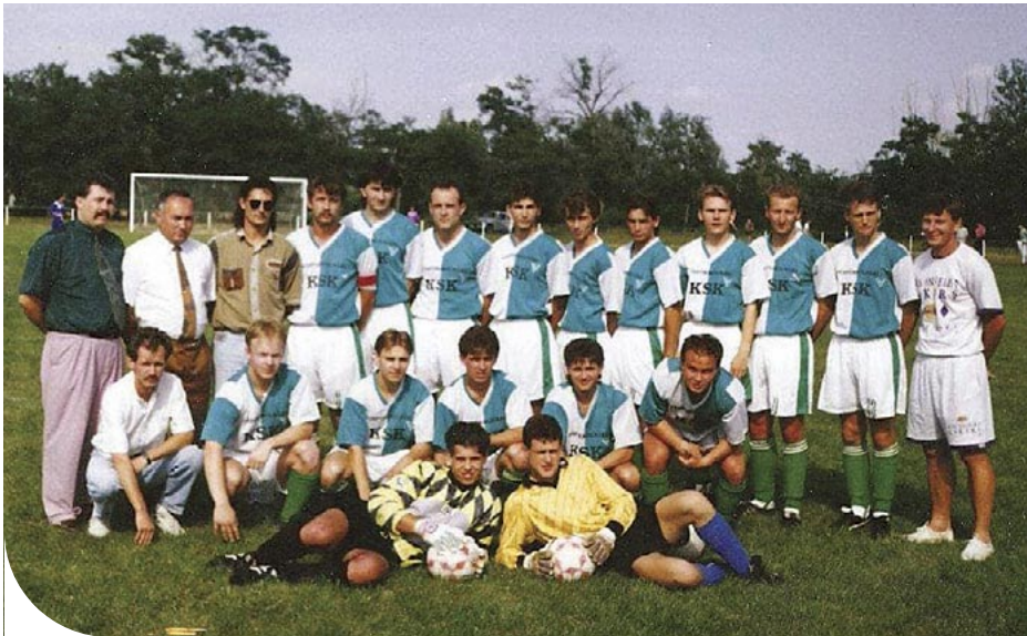
A 30 éve bajnoki címet nyerő Püspökmolnári KSK csapata