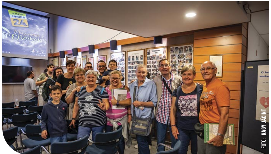
☉ A Sylvester János Nyomdáról és jogelődjeiről nyílt kiállítás a levéltárban