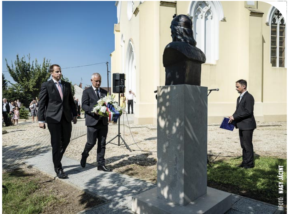
© Az ünnepi rendezvény koszorúzással zárult

– Mert ő is oly korban élt, amire bátran mondható, hogy nehéz idő volt. Hiszen a tét nem volt más, mint a nemzet megmaradása vagy pusztulása, amikor a hazán belül olyan konfliktusok feszítették népünket, aminek törvényszerűen háború és vérontás lett a vége. De a nehéz időkhöz súlyos döntések tartoznak, és István döntéseivel lehetővé tette egy azóta ezerévesre öregedett ország fennmaradását. Hiszen amikor a kereszténységet államvallássá tette, nem tett mást, mint hogy belesimította Magyarországot az európai fősodorba, és a többiekkel egyenrangú állammá váltunk a kontinensen. A kereszténység pedig azóta is nehezen választható el Mária országától. Antall József néhai miniszterelnök szerint Magyarországon az is keresztény, aki ateista. Gondolhatott itt arra, hogy a kereszténységnek van egy kulturális vonulata, amely szerint a bibliai örökség egy alapszinten művelt ember gondolkodására fontos hatással van hazánkban. Ha csak Ady, József Attila vagy Esterházy műveire gondolunk, máris kiderül, hogy azokat a Biblia ismerete nélkül nem lehet érteni – hangsúlyozta a politikus, aki hozzáfűzte: – Mit kell tennünk, amikor agresszió éri felebarátainkat? Helyes-e a saját érdekeinket előtérbe helyezni, és tűzön-vízen keresztül