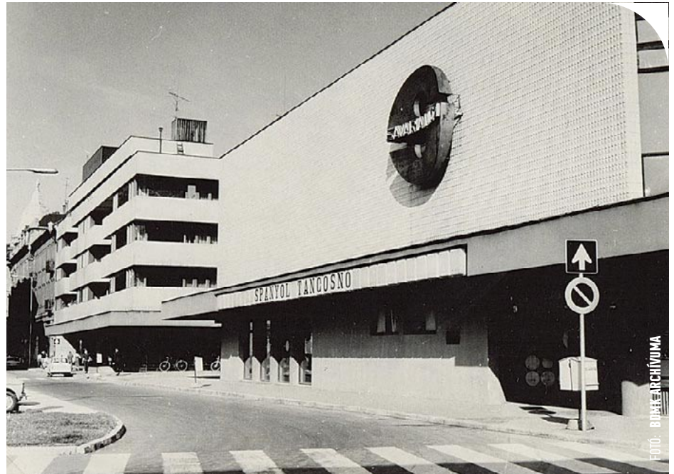
© „Az ország egyik legszebb és legkorszerűbb filmszínháza”

tekinteni. Így többek közt az akkor félezer férőhelyes, arényszerűnek mondott nézőteret (amely az előző évtized legelején történt átépítésig változatlan maradt), a tizenhét méter széles vetítővásznat a hetvenes évek elején meglehetősen újszerűnek számító panoráma vetítéssel és sztereó hanghatást lehetővé tévő technikával.