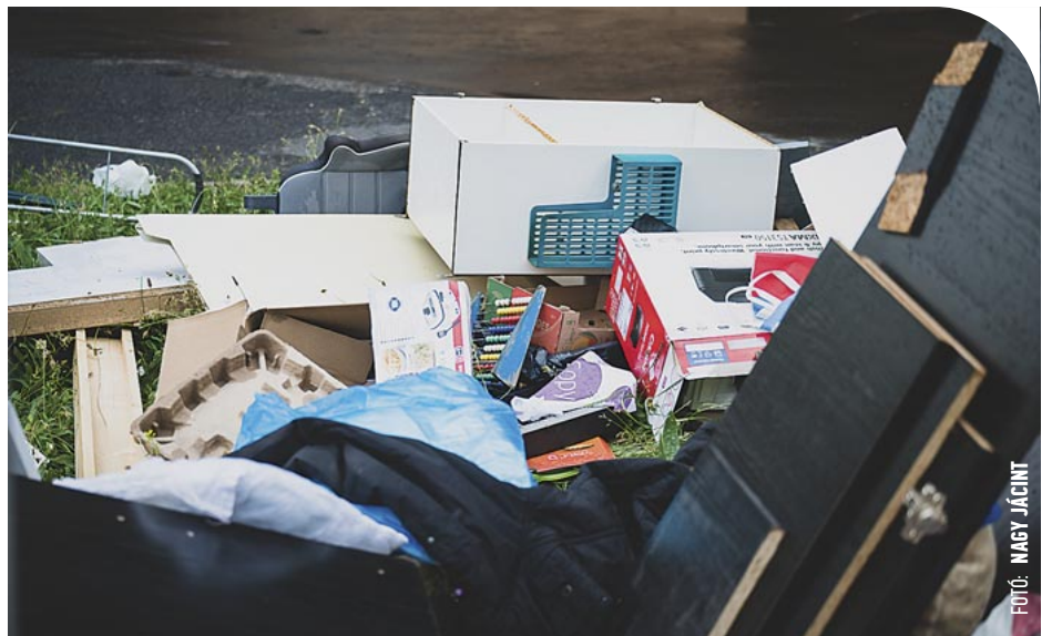
☉ Szeptember elején a belvárosban lesz lomtalanítás

Szeptember 2.: Ady E. tér, Báthori István u., Bejczy I. u., Deák Ferenc u. 1-3, Domonkos u., Dr. Pável Á. sétány, Fő tér, Hollán E. u., Király u., Kisfaludy S. u. 3-tól 29-ig és 2-től 40-ig, Kiskar u., Kórházköz, Kossuth L. u., Kőszegi u., Liszt Ferenc u., Malom u., Március 15. tér, Markusovszky Lajos u., Mártírok tere, Petőfi S. u., Semmelweis I. u. 4-6, Sörház u., Széchenyi I. u., Szelestey L. u. 13-tól 33-ig és 2-től 34-ig, Széll K. u. 1-től 25-ig és 4-től 18-ig,