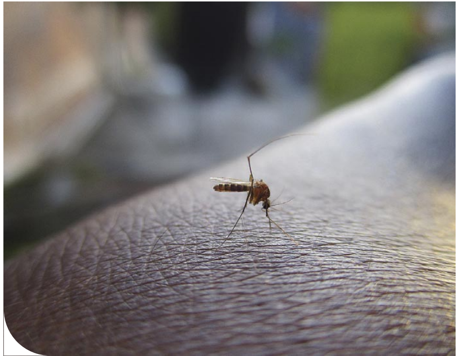
☉ Világos nappal is aktívak a szúnyogok Szombathelyen

A szúnyogokról az SZTV Víg Károlyt, a Savaria Múzeum tudományos igazgató-helyettesét kérdezte, aki elmondta, minél melegebb és nedvesebb az időjárás, annál több az időszakos, kisebb-nagyobb állóvíz. Pocsolóvízben, kinn felejtett gyerekjátékban, akár műanyagfólián felgyülemlik víz, és ha meleg van, tényleg nagyon gyorsan szaporodnak és egymást követik a szúnyoggenerációk. A víz és a meleg jó ideje adott, a szúnyoglárvák már egy hét alatt kifejlődhetnek,