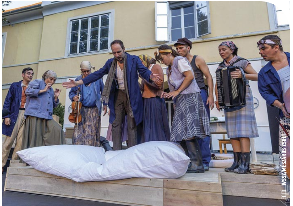
© Az előadás a Megyeháza udvarán látható

Ám egyszer csak „megérkezik” az isteni beavatkozás. (Akárcsak az ókori görög drámákban.) A csoda. Áldozati kancsó koppan a sokaság fején, s egyetlen pillanat alatt: kitisztul a kép. Mindenki a tudatára ébred. Valós képe születik világról, hazáról, városról. Múlttól. Jelenről. Jövőről. Kreatív, nyitott. Kész összefogni. Együtt, csapatban akár a világot is megváltani. A közösség túljár a basáskodó(k) eszén. A gonosz odakerül, ahová való: a krockodilok foga közé, onnan irány a bendőjük! Brillíroznak a színészek. Több alakba-szerepbe bújnak, jellemeseket, jellemteleneket formálnak meg. S mégis minden laza, könnyed.