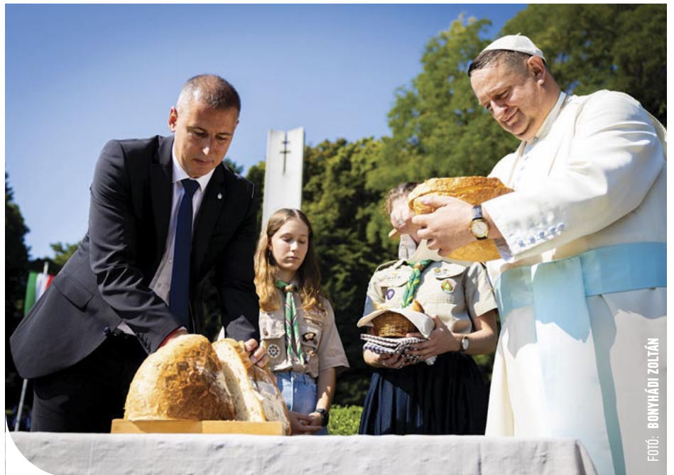
☉ A megszegett új kenyeret cserkészek kínálták körbe

– István a kereszténységet választotta, István a nyugatot választotta, István Európát választotta. István a jövőt választotta a múlttal szemben, a tiszta emberi értékeket a zavaros pogány hagyományokkal szemben. István a nyitást választotta a bezárkózás helyett. Megmutatta, hogy egy erős országnak nem félnie kell területén élő más nemzetiségektől,