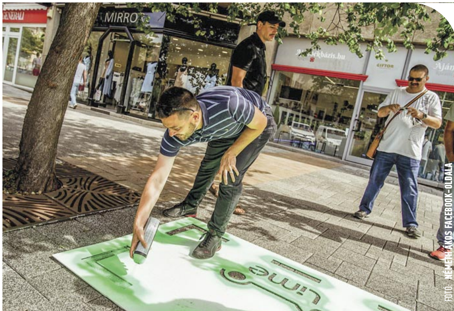
☉ A belvárosban már láthatók a Lime rollermegosztó-rendszer lerakási pontjai