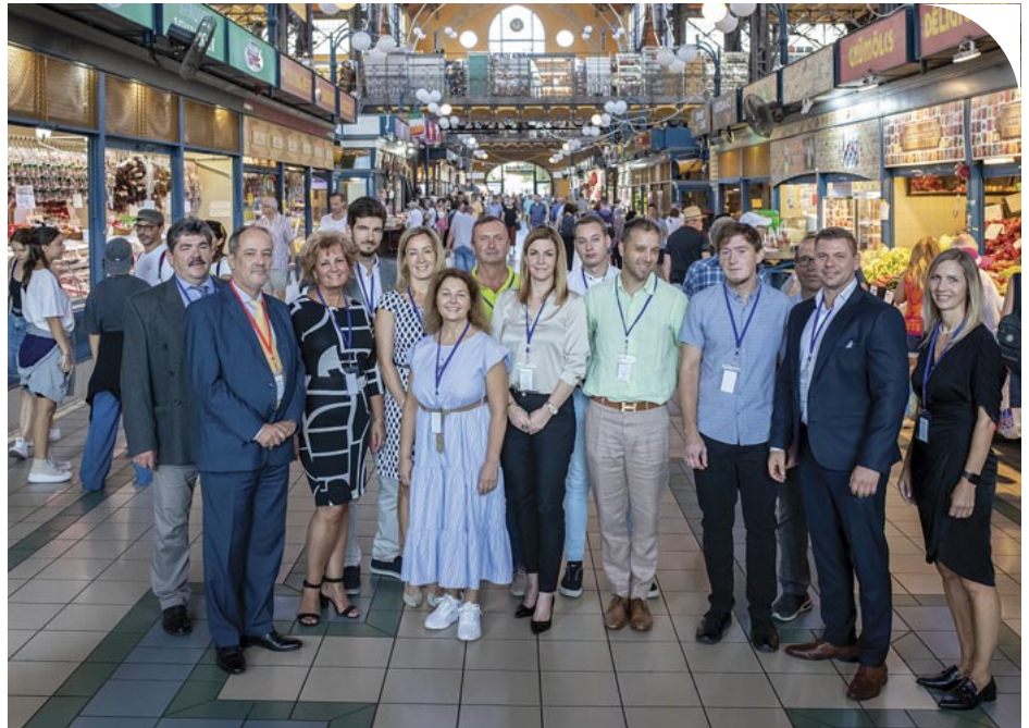
Megalakult a Vásárcsarnokok, Piacok Együttműködési Fóruma