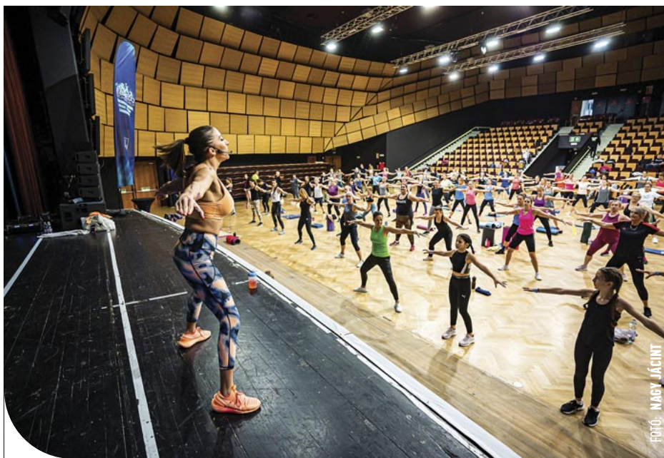
19. Második alkalommal rendezték meg a fitnessnapot

is rendben legyen. Idén azokat is be szeretnénk volna vonzani a FITT-MIX-re, akik nem a nagy tömeggel együtt akartak dolgozni, ugrab-ugrálni, hanem kicsit nyugodtabb stílusra vágytak, nekik a kistermet nyitottuk meg: egy tabata, egy bodyART edzéssel és meditációval készültünk – mondta el Soós Hajnalka, s azt is elárulta, bízik benne, jövőre is lesz folytatása a népszerű fitnessprogramnak Szombathelyen. A 2023-as FITT-MIX-et dr. László Győző, városunk alpolgármestere nyitotta meg, aki elmondta, nagy öröme szolgál, hogy másodjára rendezhetik meg az eseményt az Ébredj Szombathely! programsorozaton belül, majd jó szórakozást kívánt, és átadta a terepet Katus Attilának. A Pécsi Sasok egykori tagja Kántó kutyájával érkezett, és egy szuper hangulatú, a tőle megszokott humorral megspékelt „Best Body” aerobicórát tartott a hölgyeknek. Őt követte Rubint Réka, akit férje, Schobert Norbi kísért el a sportházba: az ő órájára megtelt az AGORA nagyterme, kőkemény alakreformedzést tartott, aminek a végén