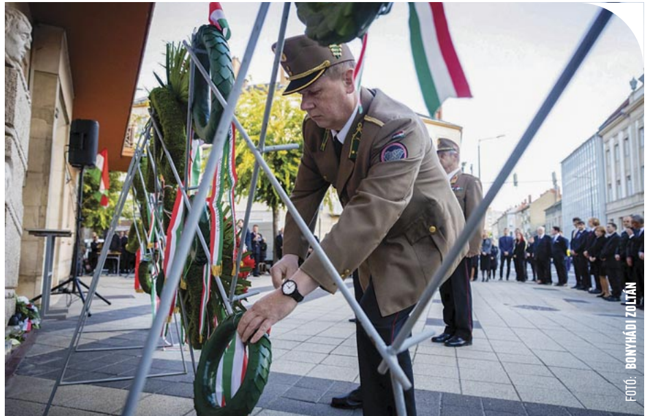
☉ Koszorúzás az 56-osok terén