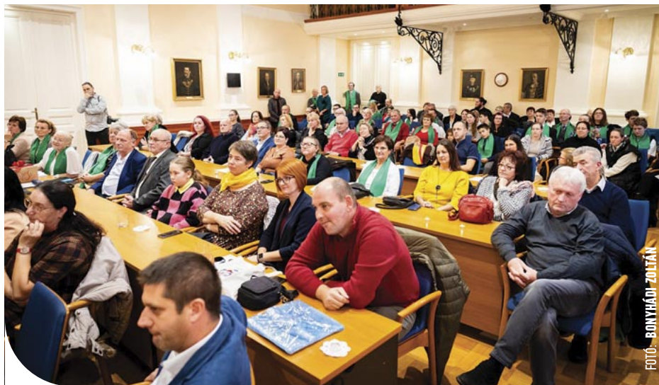
© Az Alpokalja Nagycsaládos Egyesület 1988-ban alakult

„Én azt látom, hogy a nagycsaládosok valójában a gyermekeik életével teljesítik ki a saját életüket. Az élet a legfontosabb érték, melyből további értékek következnek: a tisztelet, a szeretet, az önzetlenség és mások segítése.