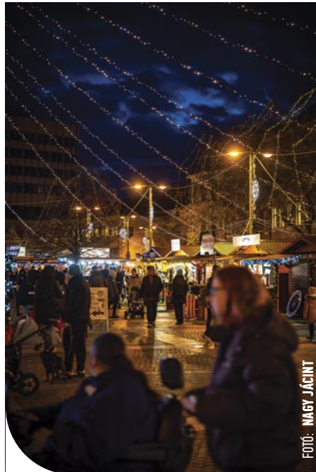
☉ Múlt pénteken nyílt meg a vásár