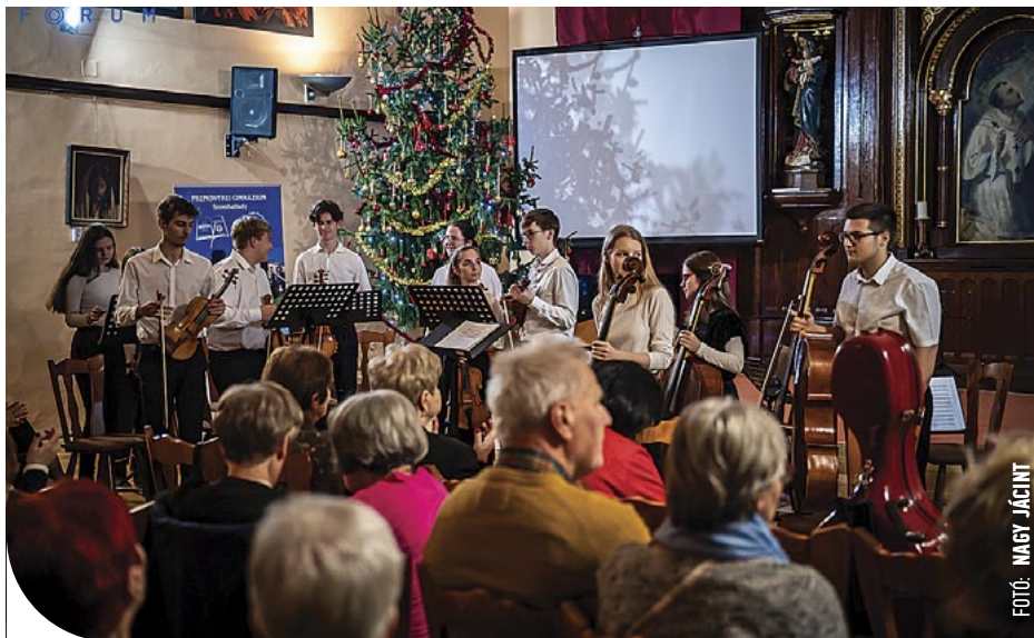
Jótékonyági előadás: a zene felszabadít és erőt ad