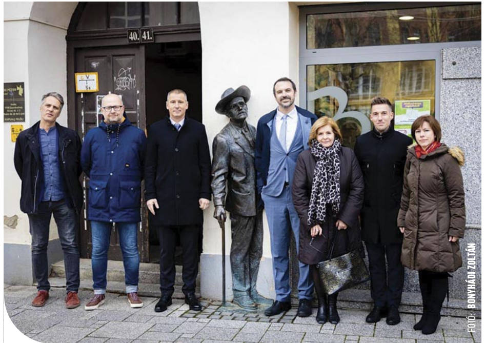
© Az új ír nagykövet (balról a negyedik) szombathelyi látogatásán

Ez önmagában is kuriózum, s ha elkészül mind a 18 murália, Közép-Európa legnagyobb kültéri kortárs kiállítását jelentheti. A fesztivál egyre népszerűbb, és a presztízse nő: nem véletlen, hogy tavaly Zürich és Párizs mellett Szombathelyt állította az Ír Külügyminisztérium és média a figyelem középpontjába. A szervezők célja, hogy megjelenjen a minőségi ír kultúra is a fesztiválon – a kapcsolat a dublini Project Arts Centre, a ULYSSES European Odyssey vagy a Művészet Határok Fellett Alapítvány szervezeteivel is ezt szolgálja –, és hogy a kortárs művészet minden ágát megjelenítse és inspirálja.