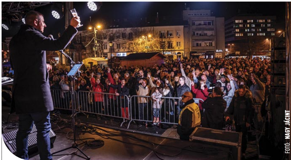
Sokan ünnepelték az újévet a Fő téren

hogy a 2024-es év jót fog hozni – folytatta, mert, bár biztosan lesznek olyan nehézségek, amiket nem tudunk befolyásolni, de az leginkább rajtunk múlik, hogyan tudjuk megtalálni a mindennapokban az örömet a saját, a barátaink és a családjaink, a munkahelyünk vagy éppen a város életében. Azt kívánom minden szombathelyinek, mondta végezetül, hogy érezze jól magát a saját életében, és akkor biztos, hogy ez egy nagyon jó év lesz. És hogyan is kezdődjön el? Mi a recept? Csak annyi, hogy éljünk szívből, és ezt kezdjük most, kezdjük itt – Boldog új évet Szombathely! – zárta beszédét. Az idei tűzijáték mellett a városházát fényjáték öltöztette ünnepi díszbe. Aki a koccintás után még bulizni vágyott, meglehet: a Fő téren a Retroleum zenekar hajnali kettőig szolgáltatta hozzá a régi idők népszerű slágereit. A város szilveszteri házibuliját az AGORA Savaria Kulturális és Médiaközpont NKft. szervezte.