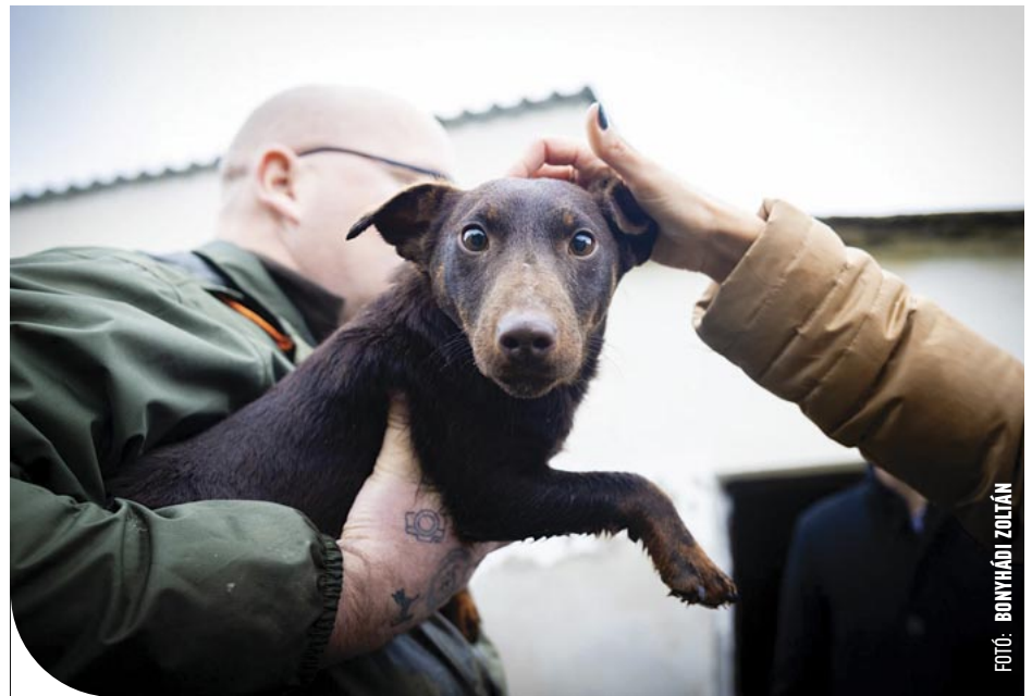
FOTÓ: BONYHÁDI ZOLTÁN

© Örökbefogadási nap az ebrendészeti telepen