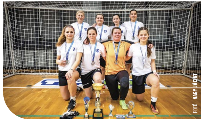
☉ A női győztes a Kinizsi SK Gyenesdiás lett