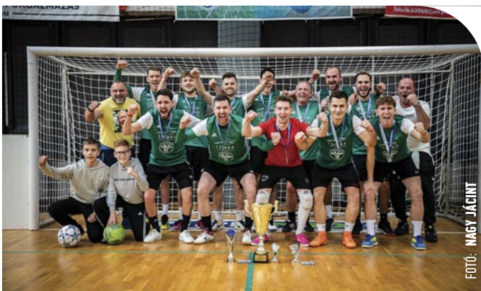
☉ A Szikra Autókozmetika nyerte a nyílt kategóriát