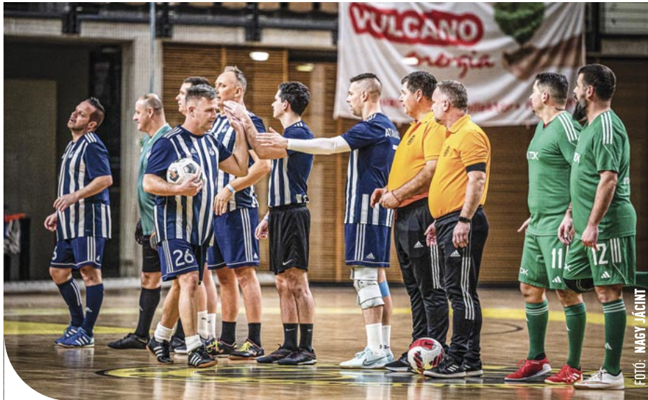
☉ A döntő előtt: csíkos mezben a Polgármesteri Hivatal csapata

A szombathelyi polgármesteri hivatal csapata nyerte a cégeknek, intézményeknek kiírt kispályás focitornát, miután sem a csoportmeccsekben, sem pedig az egyenes kiesés szakaszban nem talált legyőzőre. Tizenhat együttes lépett pályára, négy csoportban küzdöttek a gárdák.