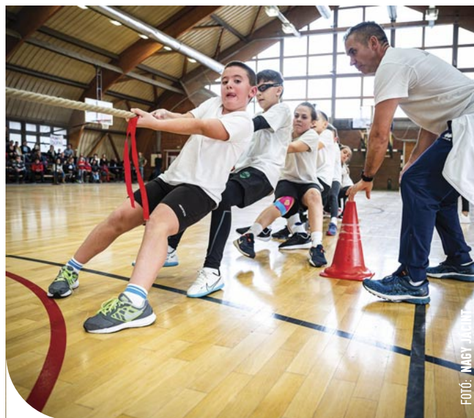
© Teljes szombathelyi siker: első lett a Derkó, második az Oladi iskola