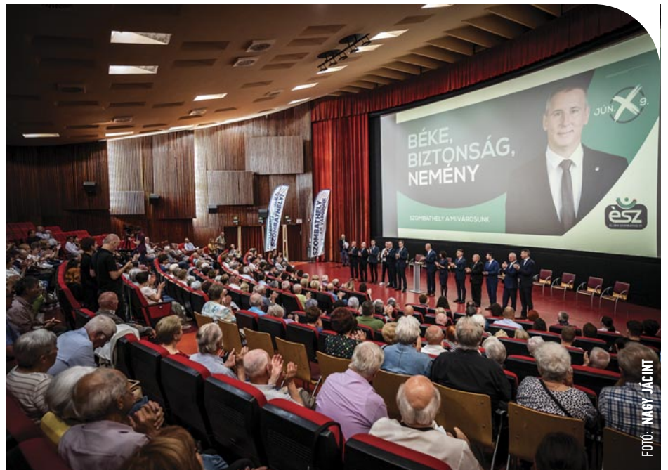
© A moziban tartotta az Éljen Szombathely! nagyrendezvényét

Nem volt kisbetűs rész a világvárványnál, de a céljait egy percre sem adták fel: újraterveztek, mint az útvonaltervezők. Ez a ciklus áthatóan a biztonságról szólt. Bátrak voltak, és azonnal reagáltak az egészségügyi krízisre: maszkokat osztottak elsőként az országban, biztonságossá tették az orvosi rendelőket, bérletidő-kedvezményeket adtak és 100 ezer forint támogatást a munkahelyüket elvesztőknek, bevezették a piaci vásárlási utalványokat és a „Ne cipekedj nagy!” programot.